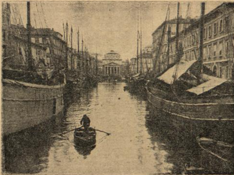
Der große Kanal in Triest. Berliner Ill. -W. m. S. S.

In einer Viertelstunde erschien der Doktor. Mit einem zärtlichen Blick umfasste er sein blondes Lieb, das in einem flüchtig übergeworfenen Morgenrock, das herrliche Haar in zwei lange Zöpfe geflochten, wie Liselotte allabendlich vor dem Schlafengehen tat, auf dem Bettrand der Mutter saß. Sie hielt der letzteren Hand in der ihren. Mit den zärtlichsten Namen hatte sie sie gerufen. Hatte sie vergebens gefleht, ihr doch ein Zeichen des Lebens zu geben. Aber nichts rührte sich in dem marmorblaffen Gesicht. Und Liselotte begriff — der Tod war durchs Zimmer gegangen und hatte die geliebte Mutter mit sich genommen. Ihre liebe, schöne, stets so gesunde Mutter!