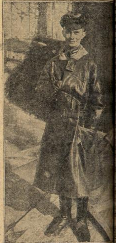
Füßergroberleutnant Kurt Wolff, einer der erfolgreichsten Richtschützen-Kanonen des Pour le mérito. (Mit Text.)

endlich brachte Georg die Rede darauf. Sie waren allein. Am nächsten zum Einkaufen in der Stadt und hatte die Kinder mitgenommen. Die Gelegenheit wollten sie zu einer Aussprache benutzen. Liselotte war sich längst darüber klar, daß sie entsagen