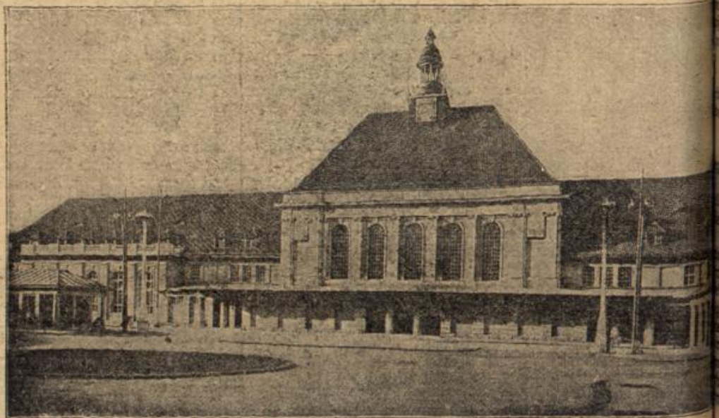
Der soeben fertiggestellte neue Bahnhof in Görlich.