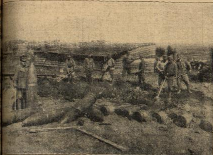
schwere russische Granaten aus einem durch deutsche Artilleriewirkung die Luft gesprengten Munitionslager in Sozowa.

nd den Männ n; und weil sie lingsger gewesen Seit dem und sie ie je in werde ge e ihm un en Zufall war er, be hatte an lassen. S en hatte tet. Als Püße ng. id nun eld ganz de bekom von ig machen gen, ihm ann vol füße zu eit Wode nd dräm er, die der De Eisen efahren ganz ert und net han ein lie te der in es urchau Selig t, wam hm da tun? E tlichen läßt gen ein habe u ange ndfüde erte äude sem über die D ältisse edwehel Stadt nden an e Zukun rtlich un er Leide Sanat Aber doch rennen erwid t. Eine barau b ihr nieren lgen. eine daß n ab Eigent hrer Un taucht immerte ht zu nach