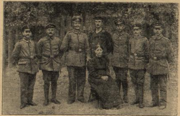
Sieben Söhne im Felde. (Mit Text.)

Es war nun ganz Nacht geworden. Mit der Zigarette, die ein rotleuchtendes Pünktchen bildete, lag sie still brütend auf dem Divan. — Plötzlich klang die Türglode.