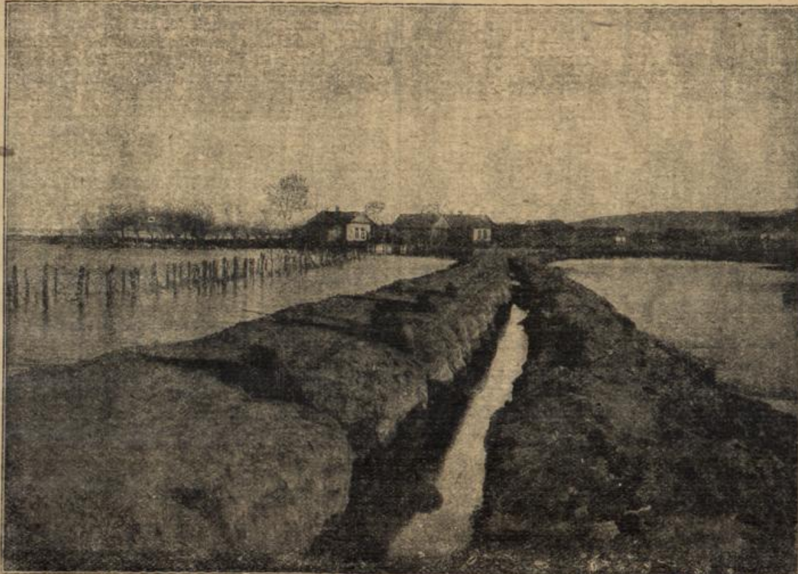
Bulgarische Stellung im Sumpfgelände der Donau an der bekarabischen Front. Phot. Max Wipperling.

Der „Onkel“ Hofmarschall nahm es mit der ihm eigenen kühlen und weltmännischen Gelassenheit auf. — Mia schwieg, und nur Rita meinte, er hätte immerhin einmal kommen können, um die schönen Sommer-Erinnerungen aufzufrischen. Dann gab es wieder eine Verlegenheitspause, die ein Artischodengang mit einer Ragoutbeilage angenehm ausfüllte.