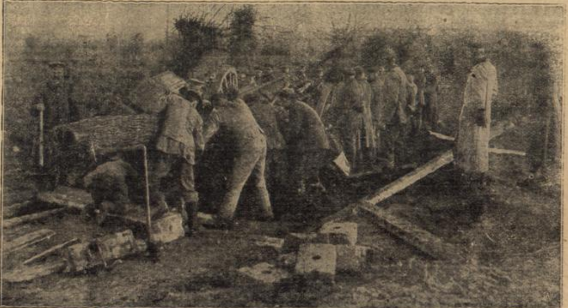
Aufmontieren eines Scheingeschüzes. (Mit Text.)

Sein fester, harter Schritt ertönte, der ihr stets, wenn sie ihn vernahm, ein eisiges Gefühl des Erschreckens auslöste. Er sprach einige Worte mit dem Mädchen und ging dann in sein Zimmer. Ilse machte Licht. Sie fühlte ihr Herz heftig