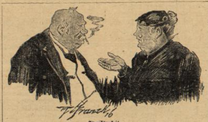
Eparaulkeit. „Sehen nur, Moiss, dds floane Studert Zolletteise kost' neunzig Pfennig!“ „Hu, ma muss' s' nachher halt' möglichst' wenig bemengen!“

zur Kirche getragen wird, legt man einen Bejen (oder auch eine anderen Bejen kreuzweis) auf die Türschwelle, die der Laufzug über dieses Mittel bricht die Zaubermacht alles Bösen, das das Kind je beunruhigen könnte. Aber die Taufe gehalten wird das Kind von einem Paten oder einem Geschlechts — andernfalls bleibt es ledig. Knaben und Mädchen aber taufte man nicht mit demselben Wasser, sonst — bekommen die Kinder einen Bart, und keines der Kinder verheiratet sich später einmal.