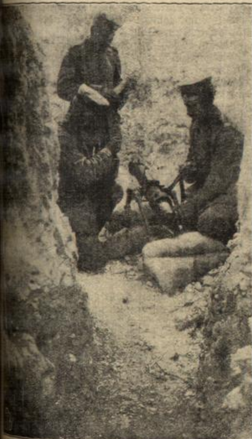
Assemblierung eines Minenwerfers in einer deutschen Zappe an der Westfront.

Um Gottes- willen, hal- ten Sie ein, wenn meine Tochter Sie hört, sie ist im Neben- zimmer“, der Alte streckte dem andern wie beschwö- rend beide Hände ent- gegen und in dem verwit- terten Ge- sicht suchte es von mühsam unterdrück- ter Aufre- gung. „Mei-