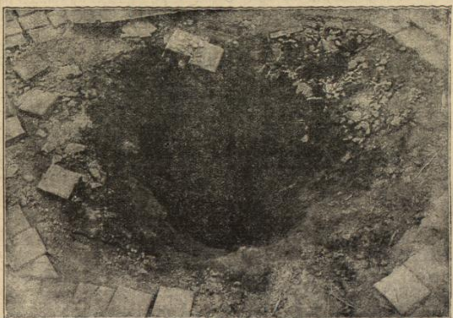
Von den Kämpfen an der Westfront: Einschlag eines feindlichen 30,5-cm-Blindgängers. Das Granatloch hat eine Tiefe von 8 Metern.

In Pieter de Ruiter's Kopf flogen die Gedanken durchein- ander, stießen sich gegenseitig und fielen, hoben sich wieder und quälten sich weiter und das Gesicht des Alten sah plötzlich greifen- haft verfallen und mitteilbar aus. Wie überwältigt vor dem Gedankenchaos wankte er zu dem Armstuhl hin und mit der Hand auf einen danebenstehenden Sessel deutend, sagte er kurz: „Nehmen Sie Platz, mein Herr, ich will Ihnen erklären, wie einfach das im Anfang aussah, um dessenwegen Sie mich jetzt mit dem abscheulichsten Namen benennen, den es auf Erden gibt.“