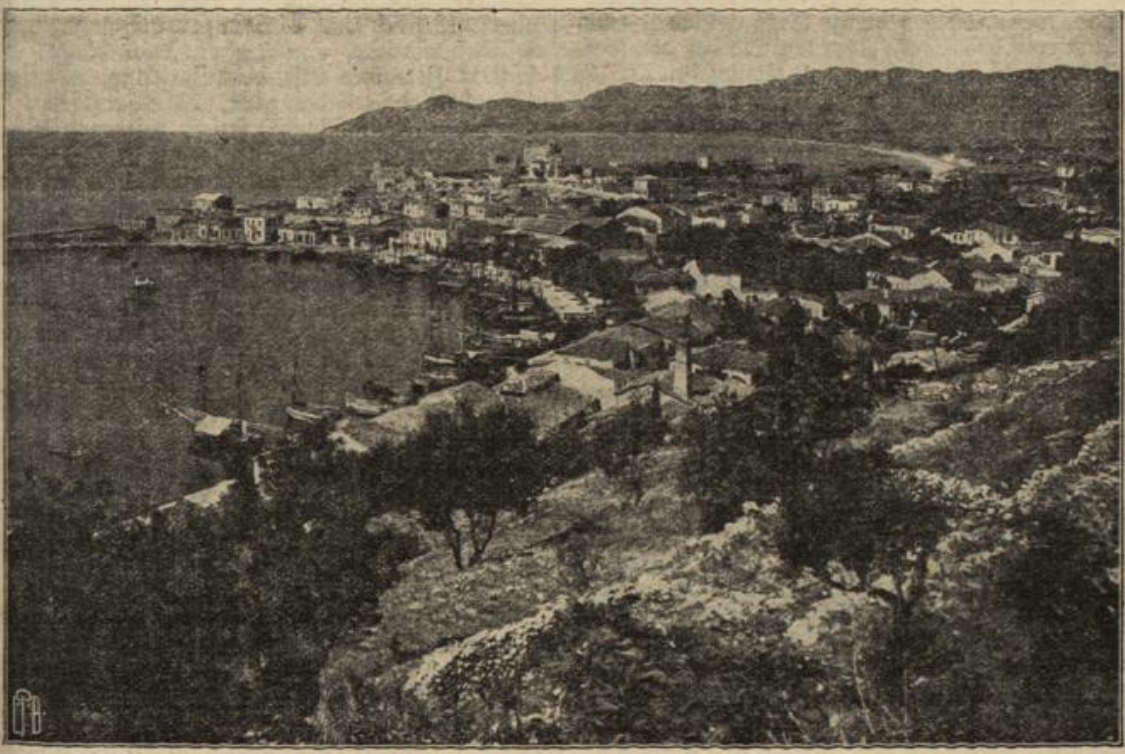
Blick auf Bashi, die Hauptstadt von Zamos, welche von einem deutschen Flugzeug mit Bomben belegt wurde.

...direktor zugestanden, würde freilich einen großen Schaden im Haushalt verursachen, denn die Witwenpension, auf die ich ein Anrecht hatte, war dagegen nur unbedeutend. Aber ich werde trotzdem ihr Leben sorgenfrei und standesgemäß führen und brauche mich nicht einzuschränken. Diese Sicherheit war ungemein wohlthuend.