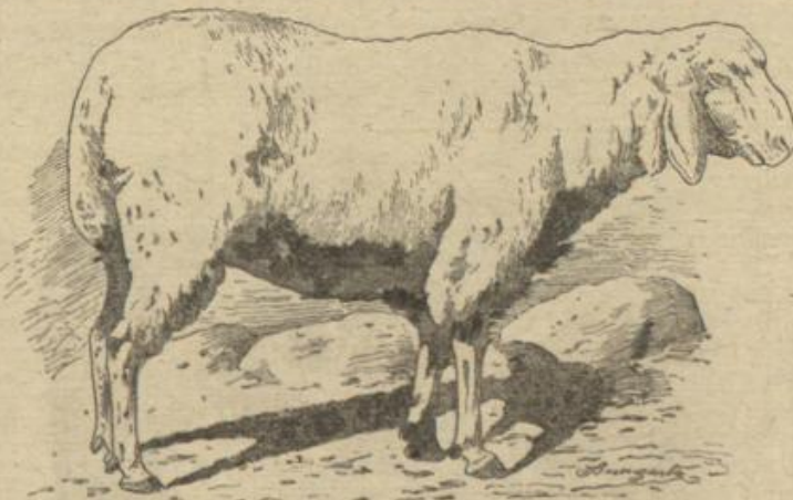
Das Bergamascher-Zhaf. (Mit Text.)

"Dort tief im Böhmerwald, da ist mein Heimatsort, Es ist schon lange her, daß ich von dort bin fort. Doch die Erinnerung, die bleibt mir stets gewiß, Daß ich am Vaterhaus auf grüner Wiese stand Und weithin schaute auf mein Heimatsland..."