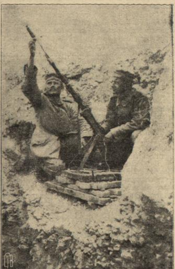
In die Wand eines deutschen Schützengrabens einge- baute Gewehrgranate beim Zerschlagen.