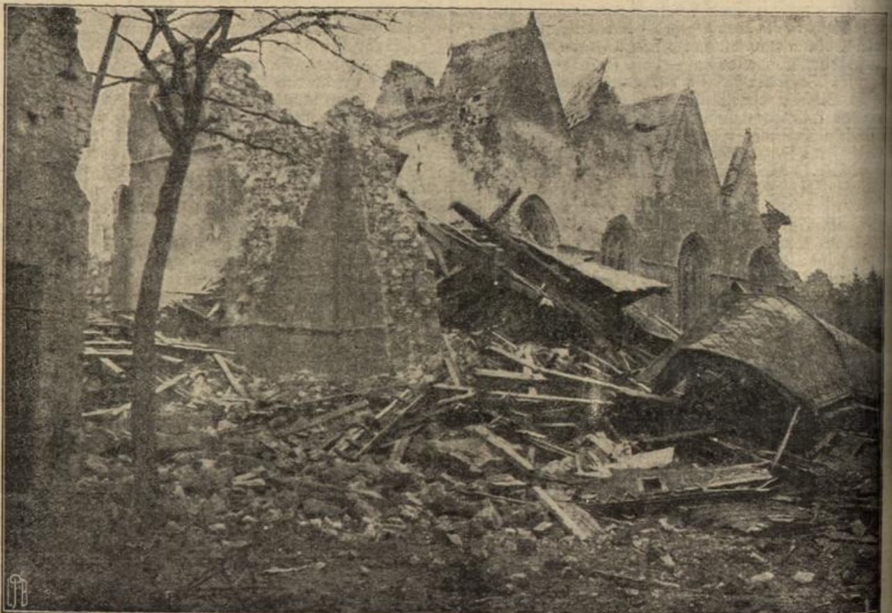
Die durch die feindliche Artillerie zerstörte Kirche von Sapaume.

Nun war es da, das Entsetzliche, das Furchterliche, er fliehen wollte und er wußte, der große, junge Hüner vor ihm stand und ihn unablässig anblickte, wußte alle, wußte, wer die unglückselige Rolle des alten Thomas Der Mann da vor ihm mußte in jener Nacht der des Professors gewesen sein! Angstschweiß brach ihm an