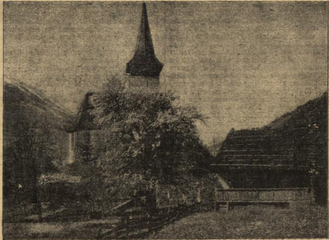
Frühling in Frutigen. (Mit Text.)

noch nach, daß er vorhin seiner Erzählung mit Mißtrauen begegnet war. Das tat ihm leid und um sein Verschulden wieder gut zu machen, sagte er schnell: „Ich bitte nochmals um Verzeihung, Vater, daß ich deine Erzählung skeptisch aufnahm, ich gebe dir die Versicherung, daß ich jetzt anders urteile und du kannst dir denken, wie lebhaft es mich deshalb interessiert, den Schauplatz der geheimnisvollen Erscheinung kennen zu lernen, noch dazu jetzt, zu dieser Stunde, die dem Schauplatz erst die richtige Milieustimmung für den Geist gibt,“ er lachte leise auf, „vielleicht hast du dich auch vor einem Schatten erschreckt, der von weitem Ähnlichkeit mit einem kleinen Manne hatte und auch andere sind durch solchen Schatten getäuscht worden.“