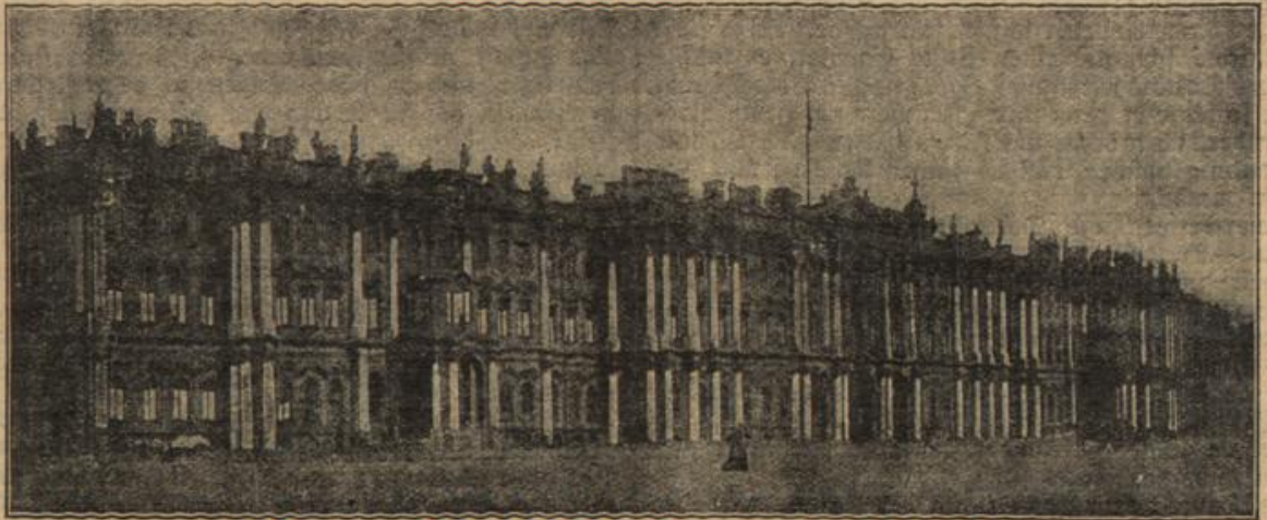
Der Winterpalast des abgesetzten Zaren in Petersburg. (Mit Text.)

ihrer Kunst gelang, den Inhalt des Stückes voll auszusprechen. — Wenn es ihr gelang! Es mußte gelingen! Ihr ganzes hing davon ab. Berühmt würde sie dann werden und