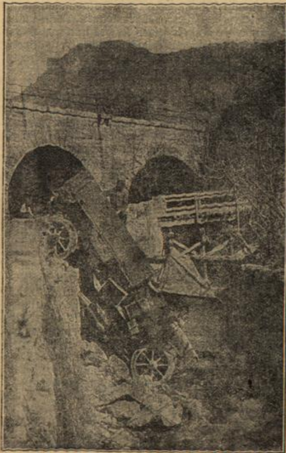
Ein Opfer des Gebirgskriegs: Abgeschätztes Automobil auf dem italienischen Kriegsschauplatz.

frau nur kam täglich, um die groben Arbeiten zu verrichten und mittags das Essen aus einem nahegelegenen Restaurant zu holen. Vater und Tochter lebten ganz für sich, eines in des anderen Liebe Genüge findend und sich an ihren Zukunftsplänen berauschend. Pieter de Kuyter beherrschte die deutsche Sprache ziemlich vollkommen, er las viele deutsche Blätter und ging zuweilen im Dämmerlicht mit Ada aus. Das Lesen und die Ausgänge, das nannte er „Studien machen“. Er schrieb voll Begeisterung und Eifer an einem Schauspiel, das sollte „Die Spionin“ heißen. Die Hauptheldin darin war eine Frau, die immer so auftrat,