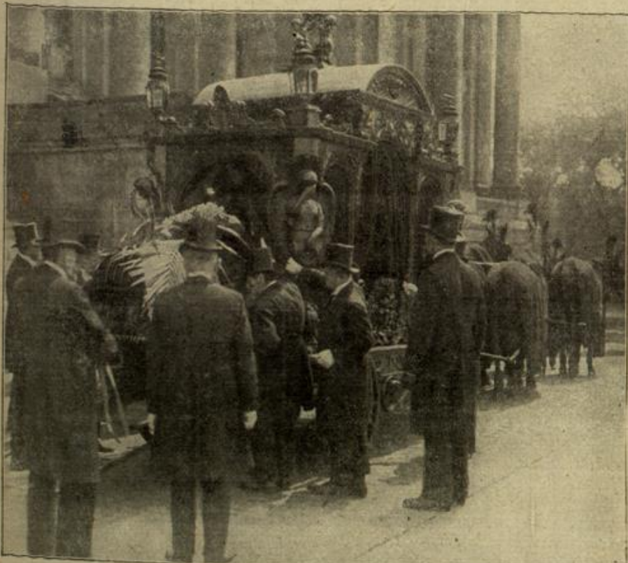
Beisetzung des verstorbenen Reichstagspräsidenten Dr. Kaempfer: Verbringung des Sarges nach der Trauerfeier im Reichstagsgebäude zum Leichenwagen.

Es war in der Tat so, wie Kläre vorausgesagt hatte. Ihr Vetter Kurt wartete seit mehr als einer Stunde auf ihr und Gabrielles Erscheinen in seinem festlich geschmückten Atelier. Zum ersten Male sollte das geliebte Mädchen sein Heim, seine Künstlerstätte betreten, zum ersten Male wollte er ihr Einbild gewähren in all sein Schaffen und Denken. In schön geordneter Reihenfolge hatte er Kopien jener Bilder, die ihm bereits Ansehen und klingenden Lohn eintrugen, an den Wänden aufgehängt. Einige flüchtige Skizzen, die sonst noch dort hingen, hatten allerdings verschwinden müssen. Es waren weibliche Alte gewesen, und Kurt wußte, er hätte damit das reine Empfinden der beiden jungen Mädchen beleidigt,