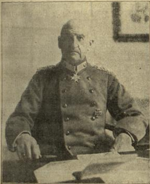
Generaloberst von Linfingen, der neuernannte Oberstkommandierende in den Marken.