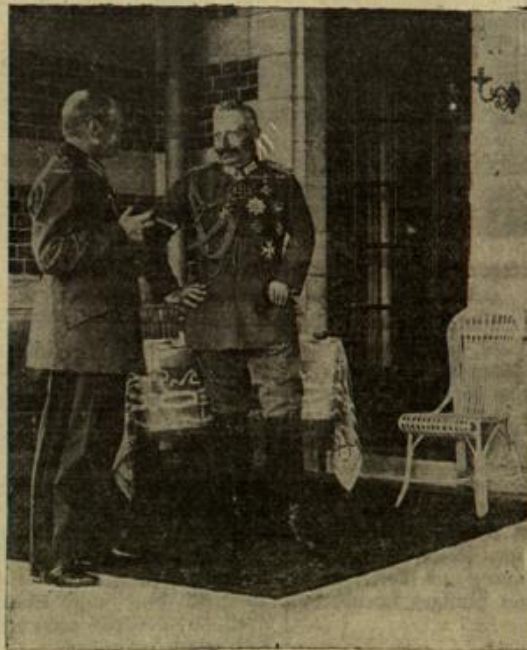
Besuch des Königs von Sachsen im Großen Hauptquartier: Kaiser Wilhelm im Gespräch mit König Friedrich August.

Der Mutter zitterten die Hände vor Aufregung, als sie der Tochter leidenschaftliche Anklage vernommen: „Welch aufrührerischer Geist ist über dich gekommen, Gabriele,“ sagte sie endlich tonlos. „Wenn Vater dich so reden hörte; er würde dich vielleicht für immer ausstoßen aus den Reihen unserer Familie. Du weißt doch, daß wir eine der alteingewachsensten und angesehensten Familien der Residenz sind. Vater hat sogar schon einmal an der Tafel des Herzogs gefessen und der sprach öffentlich seine Anerkennung aus über die treuen, wertvollen Dienste, die die Unseren ihm schon geleistet. Der Herzog freute sich, daß es eine Familie gab in seinem Reich, wo der Beruf des Vaters sich fortpflanzte auf Kinder und Kindeskinde. Und er sprach die Hoffnung aus, daß dieses stolze, pflichtgetreue Juristengeschlecht auch weiterhin nicht aussterbe; daß auch die neuen Nachkömmlinge einst dem Staate und der Rechtswissenschaft ebenso treu dienen wollen wie ihre Vorfahren.“