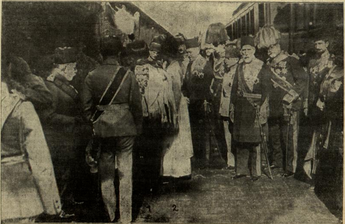
Zur Reise des österreichischen Kaiserpaars nach Konstantinopel: Empfang bei der Ankunft in Konstantinopel.

Kläre Meyer empfing ihre Freundin, die um einige Jahre jüngere, aber viel größere Gabriele schon unter der Tür. „Endlich bist du da,