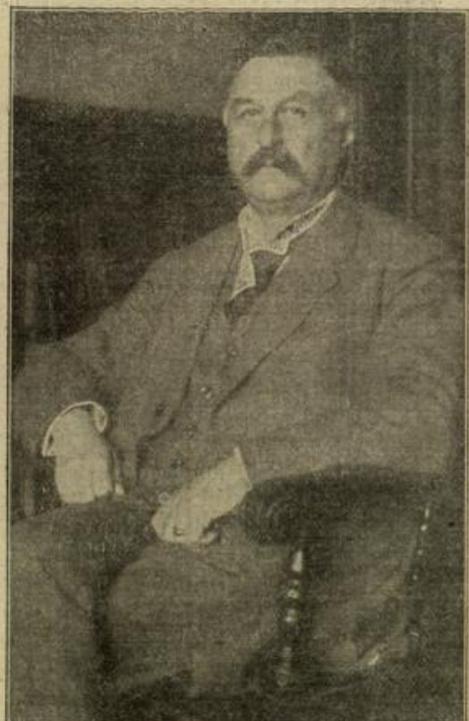
Zum Wechsel im Reichstagspräsidium: Der neue Präsident Konstantin Fehrenbach.