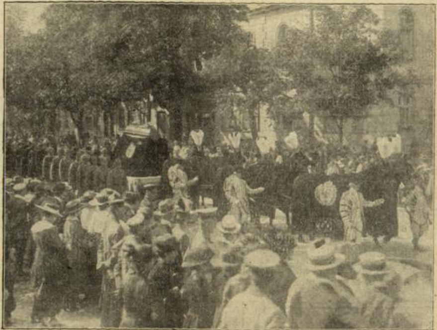
Zum Tode des Generalobersten von Kessel: Der Leichenzug auf dem Wege zum neuen Friedhof in Potsdam.