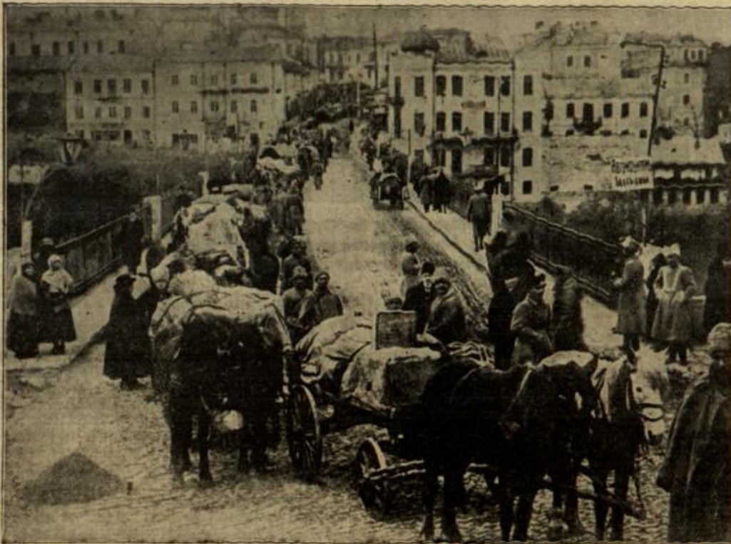
Aus der Ukraine.

„Ja, Dora, kannst denn du dich auch für einen lebenden Mann begeistern?“ lachte Renate scherzhaft. „Weißt du noch, wie du oftmals im Berliner Heim behauptet hast: „Aus den Männern mache ich mir gar nichts, die meinen, sie hätten alle Weisheit der Erde für sich allein gepachtet, und wenn sie unsereins im Hörsaal erblicken, steht ihnen auf der Stirn geschrieben: Alpha, da kommt auch selch eine überspannte Gans ...“ Sind hier die Männer anders, oder ist Doktor Rusten eine Dase in der Wüste?“