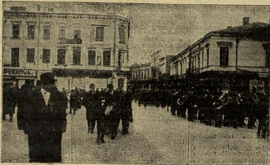
Zum Friedensschluß mit Rumänien: Deutsche Truppen-Parade in Bukarest nach Unterzeichnung des Friedens.