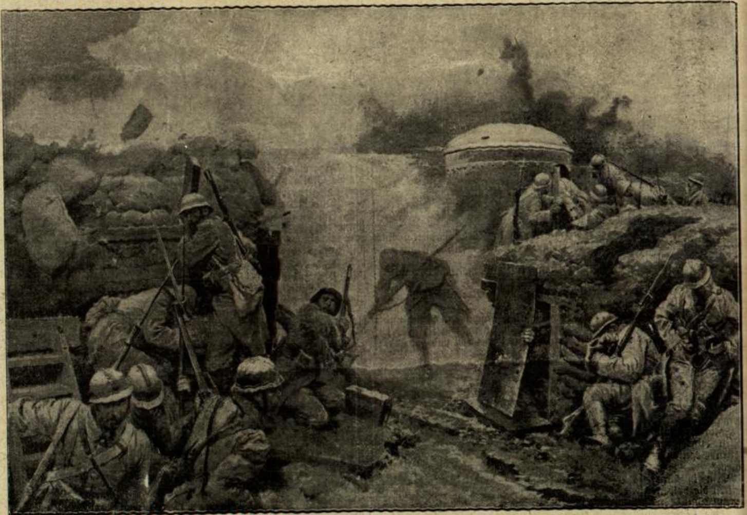
Vom Krieg im Westen: Französische Infanterie in einem gepanzerten Schützengraben während einer Beschießung durch deutsche Artillerie. (Nach einer englischen Zeichnung.)

Dora hörte den bangen Herzenston, der aus der tiefen, warmen