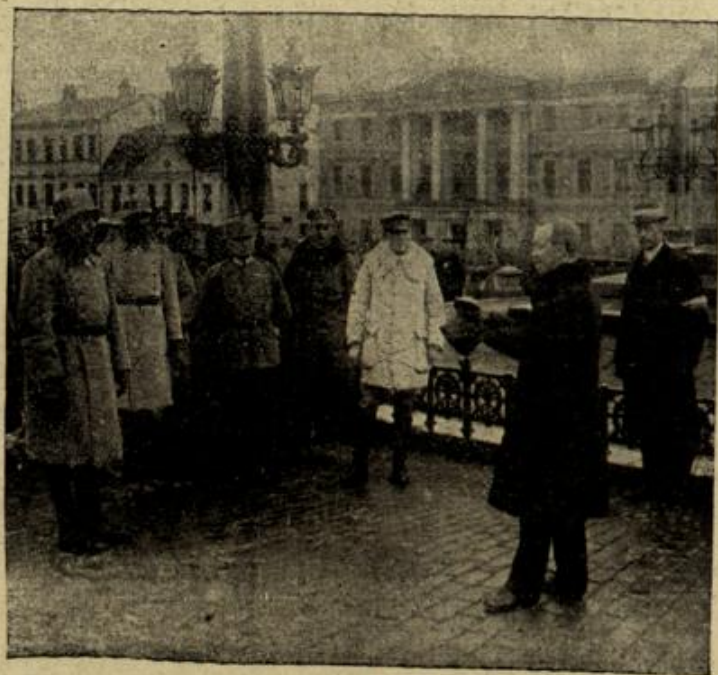
Aus dem befreiten Finnland: Der Magistrat von Helsingfors begrüßt den Führer der deutschen Besatzungstruppen Grafen v. d. Golz.