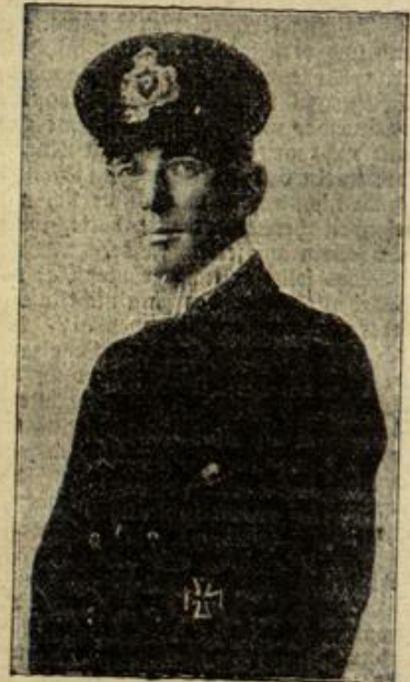
Kapitänleutnant Klasing, der erfolgreiche Kommandant eines der deutschen U-Boote.