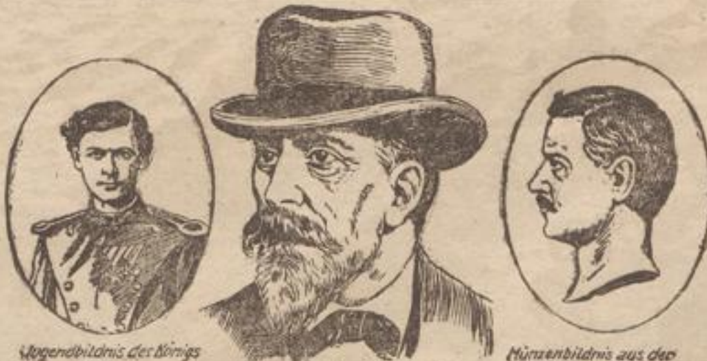
Jugendbildnis des Königs 1879

genügen ist. Waffen und Munition sind auch für den stärksten Bedarf vorhanden, ebenso die Roh- stoffe zur Ergänzung unserer Waffen und unserer Munition. Unser Wirtschaftslieben darf der Er- folg der 5. Kriegsanleihe beruhigen. Wir wissen auch, daß wir mit unseren Lebensmitteln ausreichen, wenn wir mit ihnen vorsichtsam ver- fahren. Doch wir uns Beschränkungen auferlegen müssen, doch auch die Lebensmittelerzeugung viel- fach Anlaß zu Kernaernis gibt, ist bedauerlich. Aber das darf uns nicht hindern, auch wenn wir noch viele Klagen darüber hören, unsere Pflicht gegen Volk und Vaterland andauernd zu erfüllen. Allen denen, die die Friedenssehnsucht betonen — es kommen ja Schriftstücke jetzt häufiger in vertrau- licher Form an uns heran —, ist entgegen zu hal- ten, daß zu einem Friedensvertrag notwendig auch unsere Gegner gehören. (Sehr richtig!) Unsere Gegner aber haben bisher keine Friedenssehnsucht uns gegenüber zu erkennen gegeben. Sie sind nicht bereit gewesen, auf die Friedensangebote, die in den Worten des Reichskanzlers lauten, auch nur transparenz einzugehen. Dort schuldete wir den Siegern an der Front und denen hinter dem Rücken. Die militärische