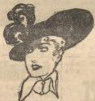
Vornehmer Damenhut mit Reihergarnitur.