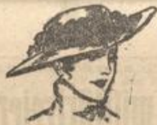
Jugendlicher Samthut mit hübscher Blumengarnitur.