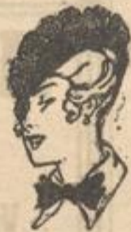
Samt-Bolero fesche Form mit Blumen- garnitur.