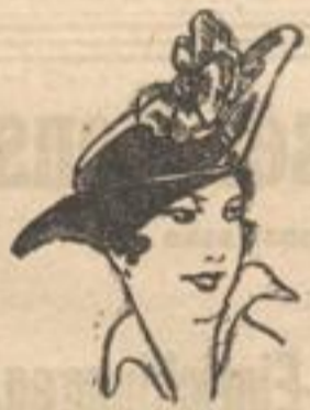
Eleganter Dreispitzhut mit Tresseneinfaß.

Im Zeichen der neuen Mode steht unsere gesamte Schaufensterfront!