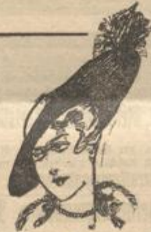
Großer eleganter Samthut mit Reihier-Plantasie.