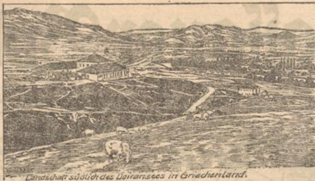
Landschaft südlich des Doiransees in Griechenland.

Ich trenne mich darüber, daß die Zeichnungsfreie seit von 14 Tagen auf vier Wochen verlängert worden ist. Wenn man die „trüge Rasse“ in Bewegung setzen will, so braucht man dazu Zeit.