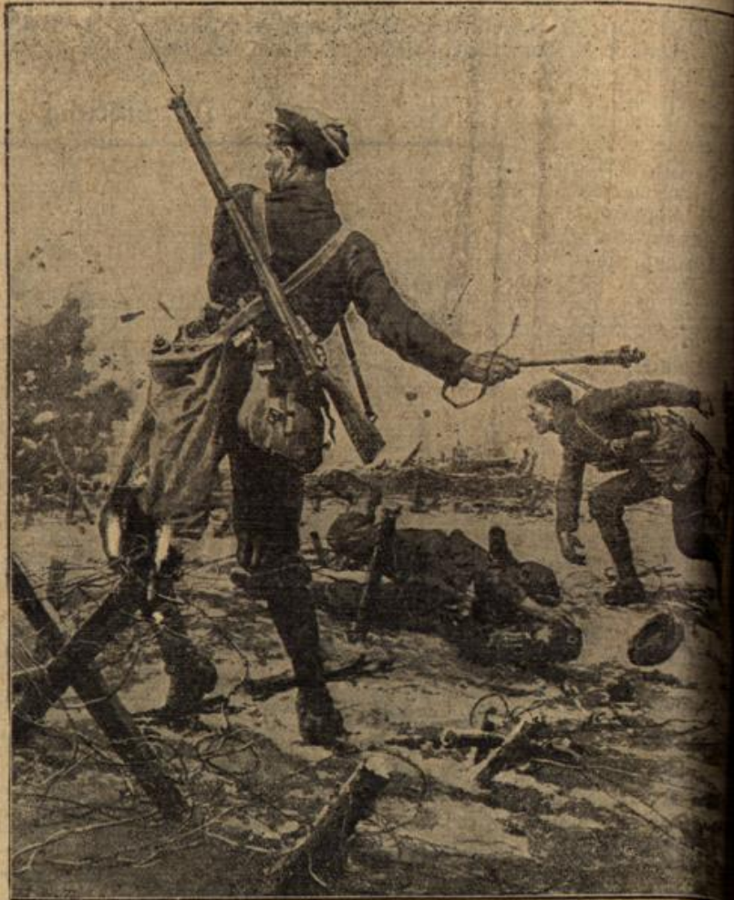
Englische Minenwerfer in Tätigkeit.