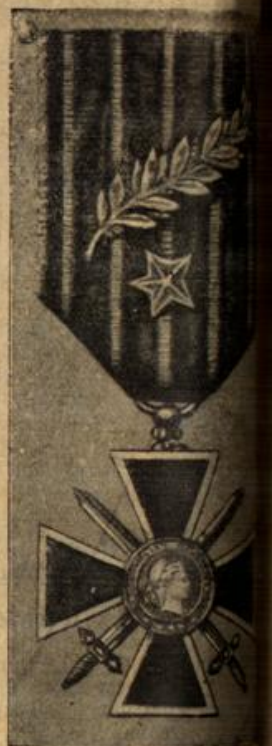
Eine neue Kriegsauszeichnung Frankreich. Das französische Kriegskreuz Nachahmung des Eisernen Kreuzes.