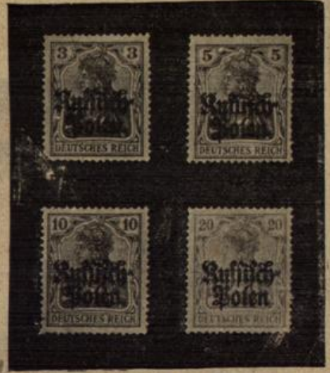
Deutsche Reichspost in den besetzten Gebieten.

Deutsche Marken sind für die besetzten Gebiete Russisch-Polens herausgegeben worden.