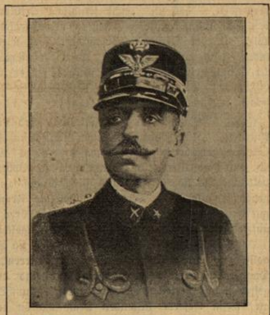
Der italienische Generalstabschef Cadorna, der Oberbefehlshaber der italienischen Streitkräfte.