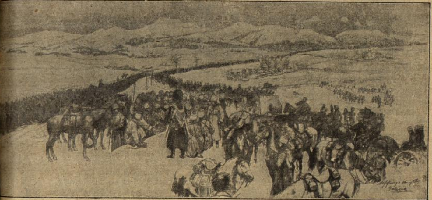
Zum Rückmarsch der russischen Truppen in den Karpaten.