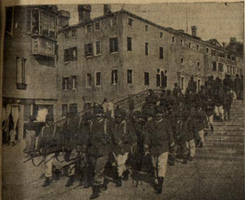
Italien im Kriegszustande. Infanterie-Truppen in feldmäßiger Ausrüstung durchziehen die Straßen Venedigs.