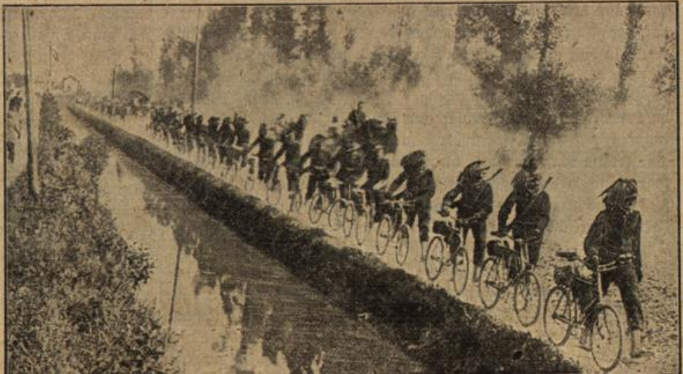
Italienische Bersaglieri beim Vormarsch auf einer Landstraße.