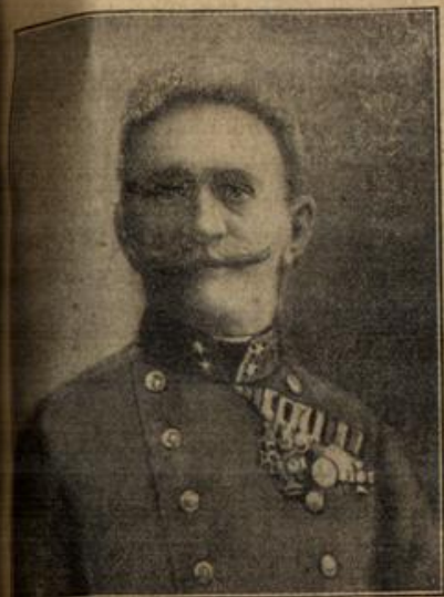
Freiherr Franz Konrad von Höhendorf, österreichisch-ungarischer Generalmajor, der den Krieg gegen Italien bis ins kleinste ausgearbeitet hat.

Bl. 25 || Beilage zum Taunusboten (Homburger Tageblatt). || 1915.