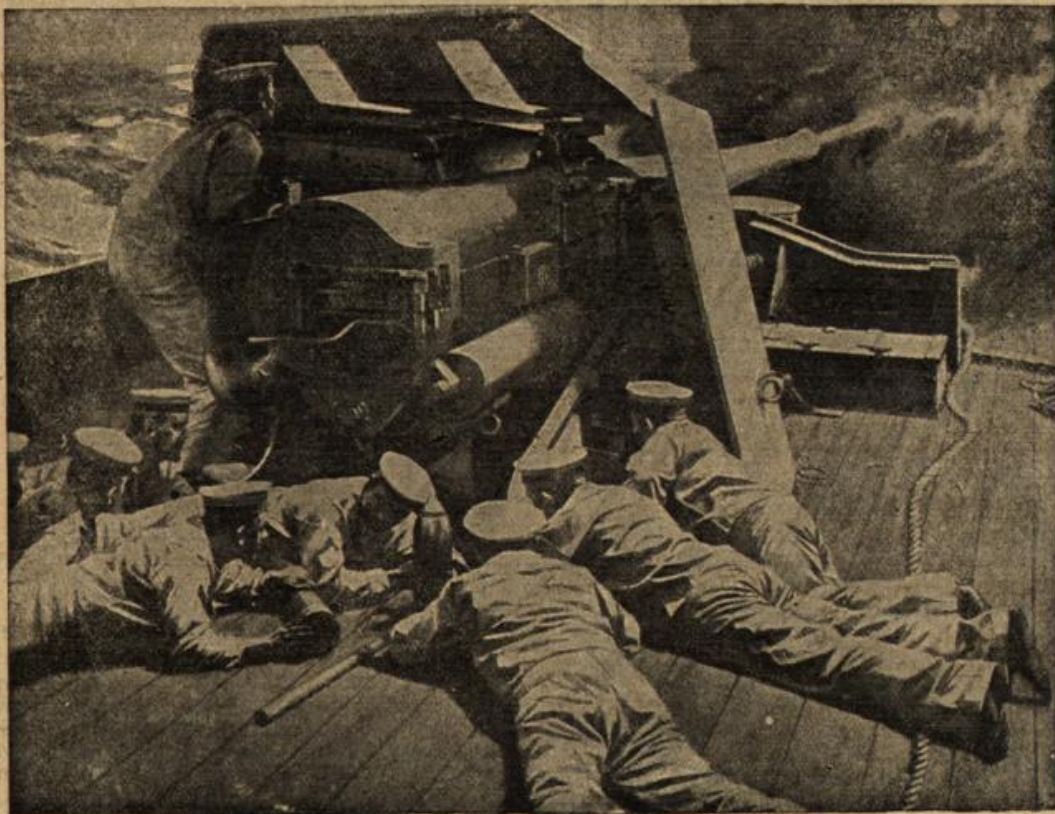
Ein 6zölliges Geschütz in Tätigkeit an Bord des englischen Schiffes „Highflyer“. Nach einer englischen Darstellung.

Das obige Bild zeigt englische Soldaten, die während eines Sturms Bomben und Handgranaten gegen die Deutschen schleudern. Nach einer englischen Darstellung.