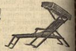
Liegestühle mit Sonnendach 8.50 11.50