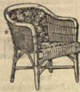
Peddigrohr-Sessel mit modernem Stoffpolster 12.75 15.75 17.50