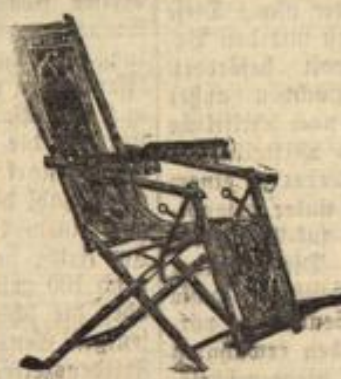
Liegestühle mit gutem Läufer 7.50 9.75 10.75 bis 21.—