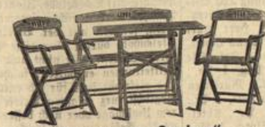
Clappgarnitur „Gronberg“ massiv Buche Bank 6.— Sessel 4.25 Stuhl 3.25 Tisch 5.75 zusammen 19.25