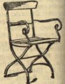
Sessel gelb lackiert 4.95

Wir übernehmen als Spezialität die Einrichtung ganzer Villen, Pensionate u. s. w. Kostenvoranschläge und Möblierungspläne ohne Verbindlichkeit bereitwilligst.