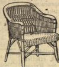
Peddigrohr-Sessel „Taunus“ 9.50