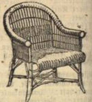
Peddigrohrsessel „Eppstein“ 16.75