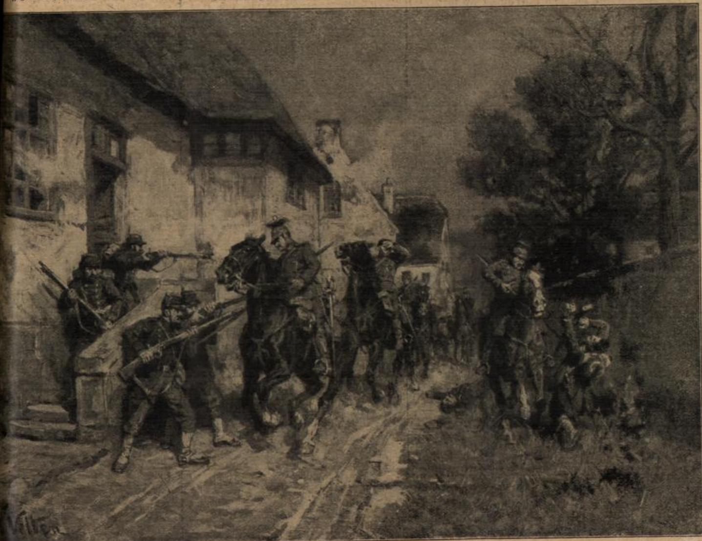
Überfall einer Männenpatrouille in einem französischen Dorfe. Von W. Belten.

Wenn's nur erst so weit wäre, dachte die Bierer-Batterie und sonnte, träge glitzernd, ihre Eisenglieder auf dem Hügel vor dem Walde.