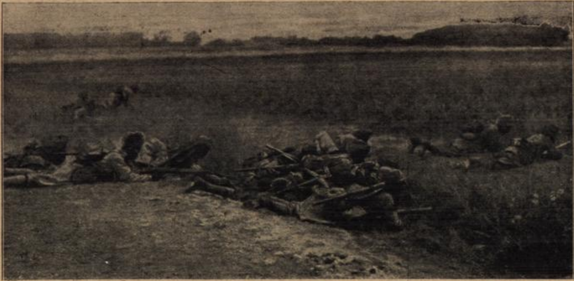
Englische Hilfsstruppen: Eine indische Schleichpatrouille in Nordfrankreich. Nach einer englischen Kriegszeitschrift.