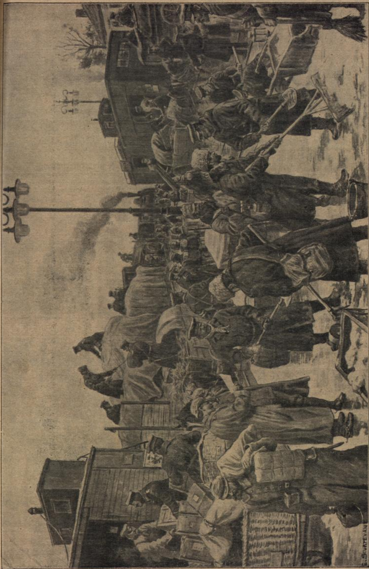
Telegraph station on a telegraph line in the Arctic. After a painting by G. Sturtevant.