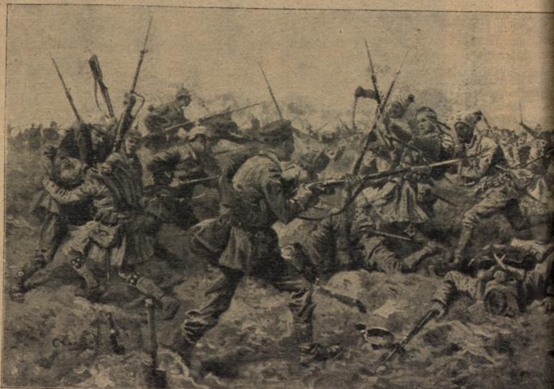
Deutsche Truppen im Kampf mit Engländern und Indern in Flandern. Von G. Koch.

Eine halbe Stunde mochten wir im kühlen Waldesföhne marschieren, da wurde plötzlich Halt befohlen. Wir lagerten in einem vor feindlichen Geschossen gut gedeckten Talteffel. Es wurde der Befehl zum Abkochen gegeben. Unsere so ungemein praktische Feldküche war uns leider beim gestrigen Gefecht von den Franzosen in Stücke geschossen worden. So mußten wir Feuer anmachen. Glücklicherweise fehlte es nicht an Kochgeschirr. Doch kaum war mit Essen zu Ende, als ich zum Brigadegeneral befohlen wurde. (Fortsetzung folgt.)