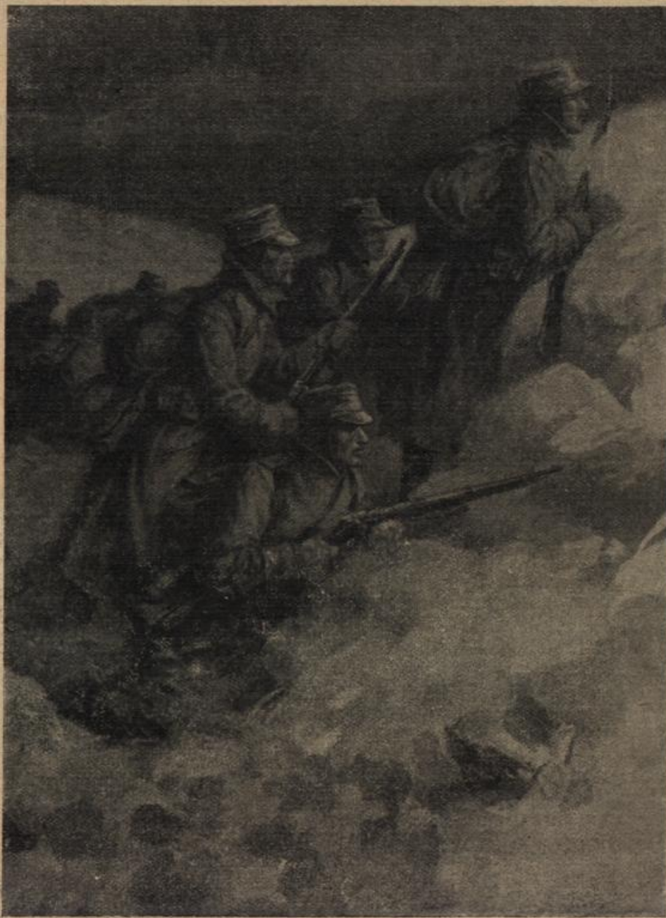
Winterkrieg im Gebirge. Nach einer Zeichnung von Hans Treiber.

... wa eine halbe ... de lagen wir in ... ung in einer jump- ... t so Wiese, dann kam ... Befehl: Zweites ... illon durch den ... vor! Da gab ... im Baudern, kein ... legen mehr. Wir ... len vor nach dem ... hundert Meter ... uns liegenden ... bett, das mit Er- ... und Weiden um-