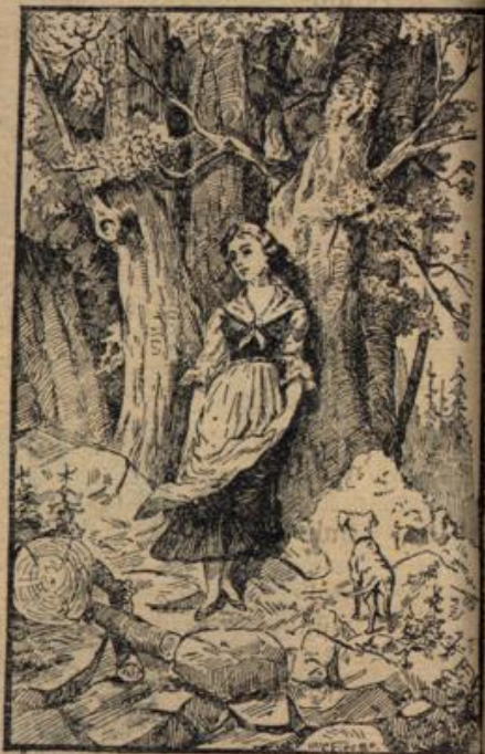
Wo ist der Jägerbutse?

Abdruck unserer Originalartikel wird gerichtlich verfolgt.