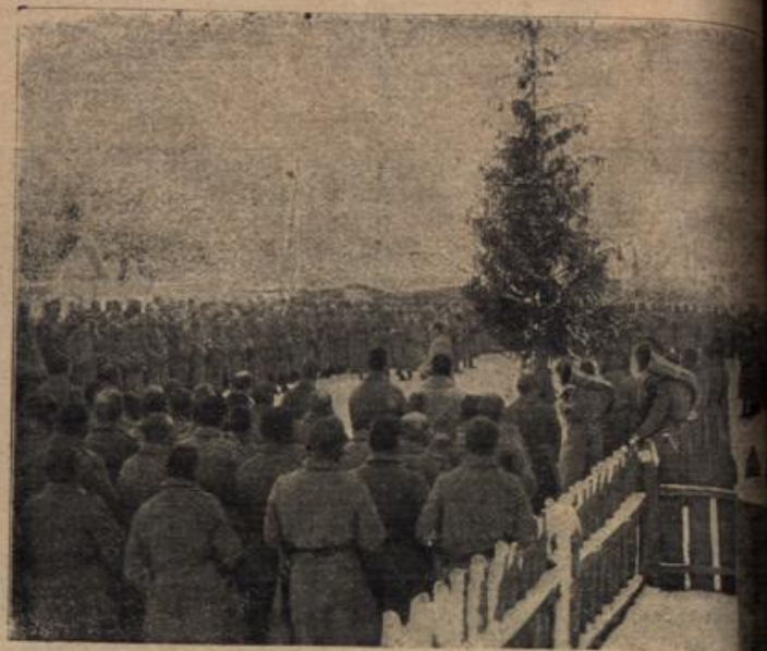
Feldgottesdienst eines Landsturmbataillons in Rußland.