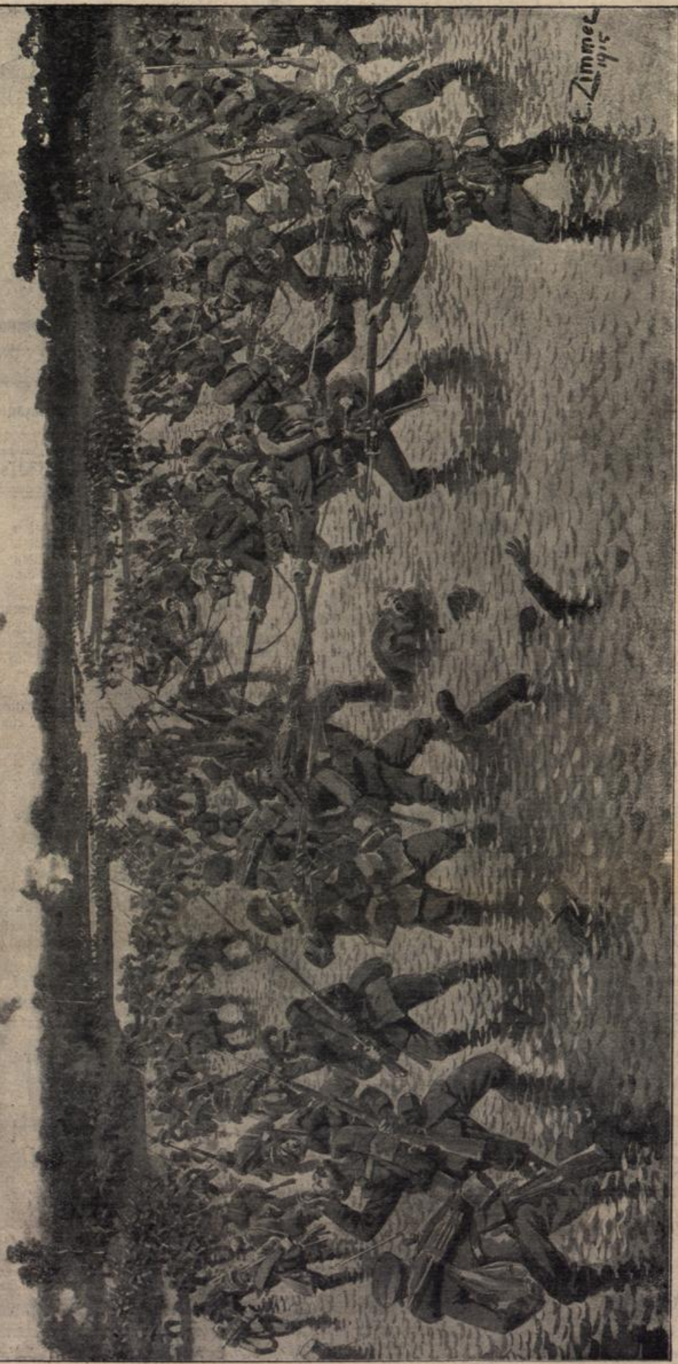
Vajouettkainuf in der Dubissa.

Während die Deutschen auf Mitau marschierten, gelang es den Russen noch im letzten Augenblick, alles, was sie an Truppen aufbringen konnten, hastig zusammenzuraffen, um die rückwärtigen deutschen Verbindungen zu bedrohen. Im Verlauf dieser Operationen entwickelten sich um Szabla, das als Knotenpunkt der beiden Eisenbahnlinien Tilsit—Riga und Elbau—Wilna seine Bedeutung hat, und namentlich längs der Dubissa hartnäckige Kämpfe, aus denen wir hier eine Episode zeigen.