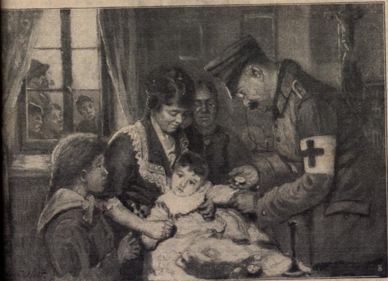
Deutscher Stabsarzt am Krankenlager eines französischen Kindes. Gezeichnet von Adolf Obst.

einen reizenden Pavillon gebaut, von dessen offener turmartiger Veranda man einen weiten Ausblick auf die ganze Umgegend ge- noß bis zum Isteiner Aloh hin und das Rheintal abwärts. Die beiden näherten sich langsam der Höhe. Sie waren dabei in ein ernstes Gespräch vertieft, so daß sie lange gar keinen Blick zu dem „Ausguck“ empor sandten. Fritz blieb nachdenklich stehen. „Hör' mal, Marie!“ sagte er dann plötzlich in völlig verändertem, fast hartem Tone. „Hör' mal, ich bitte dich jetzt, mir die volle, uneingeschränkte Wahrheit zu sagen.“ „Aber Fritz, was denkst du von mir?“ rief da Marie heftig er- schrocken. „Ich habe dich noch niemals belogen.“ „So, dann ist es gut. Du sagtest vorhin, Charles, dein Bruder, der Chasseurlapitän, sei noch gestern früh hier gewesen. Ist das