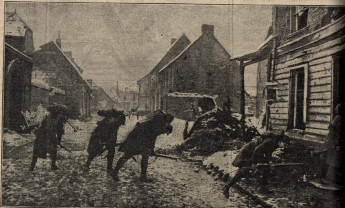
Aus der Winterschlacht in der Champagne: Eine französische Aufklärungspatrouille im deutschen Schützengraben; sie benutzt ihre Kornisier als Kopf-, Hand- und Nackenschuß gegen die Schrapnellflieger. (Nach einer engl. Zeitschrift.)