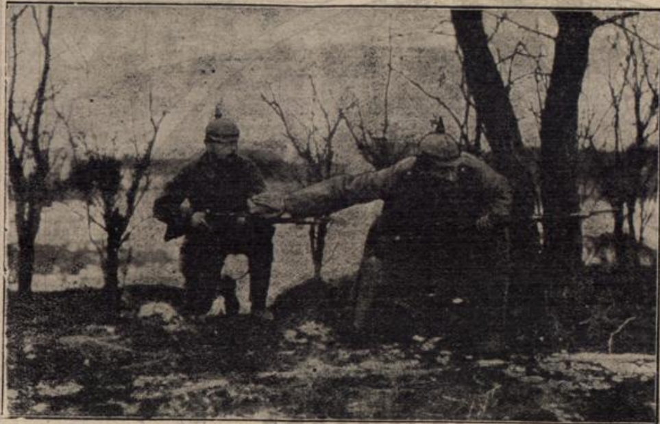
Vom östlichen Kriegsschauplatz: Feind in Sicht!

russischer Flieger habe Bomben auf eine deutsche Artilleriestellung abgeworfen.