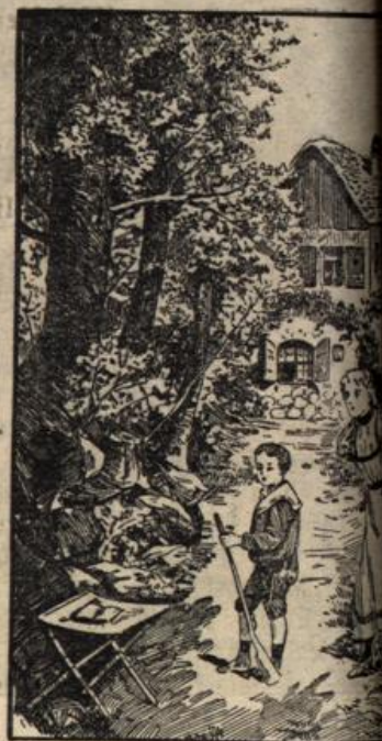
Wo ist die Mutter?

Nachdruck unserer Originalartikel wird gerichtlich verfolgt.