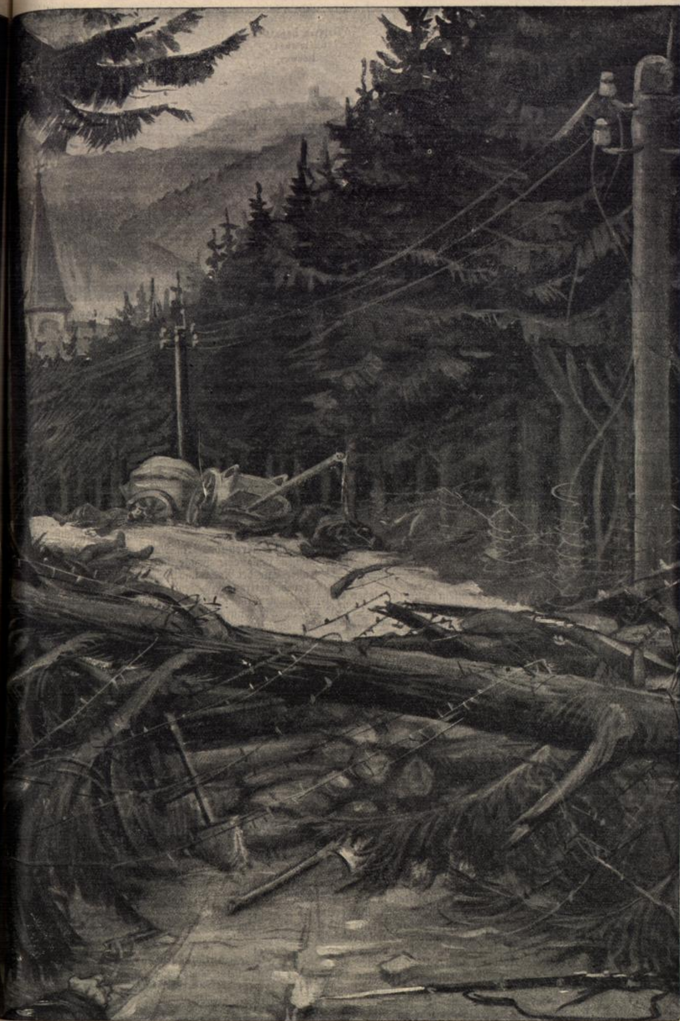
Im schweren Kämpfen in den Vogesen: Eine von den Franzosen zum Schutz gegen das Vordringen der Deutschen auf einer Waldstraße errichtete Barrikade. Nach einer Zeichnung von dem Kriegsteilnehmer Ernst Buch.