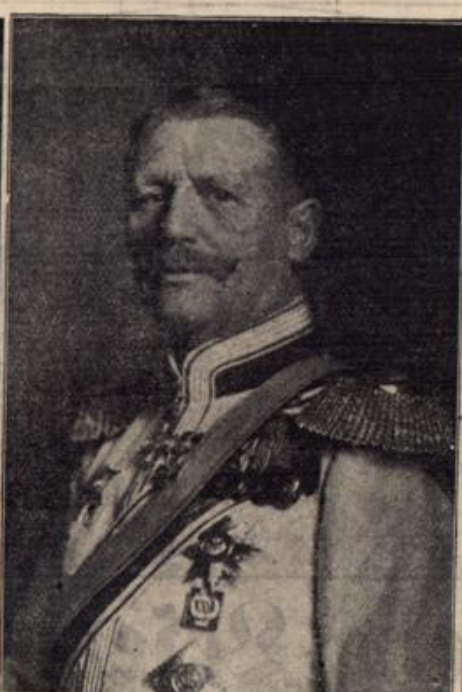
Generaloberst von Einem, der sich in der Winterschlacht in der Champagne auszeichnete.