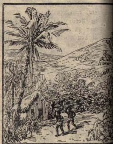
Wo ist der Aufseher der Teeplantage?

Auflösungen aus voriger Nummer: des Quadraträtsels: Maus, Alma, Umea, Saar; — des Nenderer Glas, Was; — des Osterbilderrätsels: Horch, die Osterglocken tönen! Daß du würdig bist des Heil'gen Osters! Heiz, nun sei auch festbereit, In der heil'gen Osterzeit!