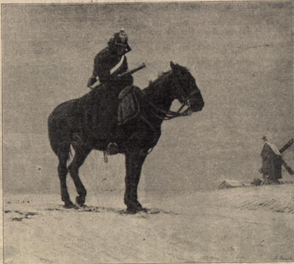
Auf Forposten. Nach einem Gemälde von A. Koloff.

Aber dennoch freute sie sich, in seiner Nähe zu sein, und ein Lächeln um seinen Mund dünkte ihr ein köstliches Geschenk. Hanna, die blonde Hanna, wußte nicht, was mit ihr geschah, aber sie empfand, es ging in ihr eine große Wandlung vor. Alles, was ihr vor kurzem noch unendlich wichtig erschienen, schrumpfte zu erbärmlichen Kleinigkeiten zusammen, und sie vergaß fast völlig, daß da draußen, nur wenige Meilen entfernt, der Krieg lärmte, vergaß, daß der Krieg vielleicht auch bald bis hierher die grausamen Arme reden würde. — Am nächsten Tage sah Hanna