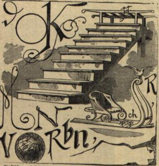
Auflösung folgt in nächster Nummer.

Auflösung des Homonymis in voriger Nummer: Das „i“.