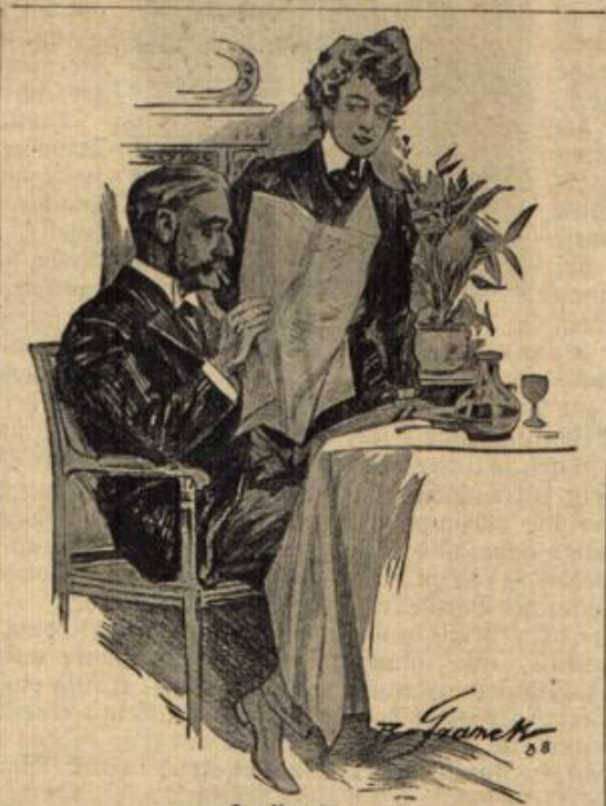
Der Vantischer. Frau eines Weinhändlers: „Ich begreife nicht, warum du nicht mit mir in ein Seebad gegangen bist, du kannst doch sonst das Wasser so gut leiden!“