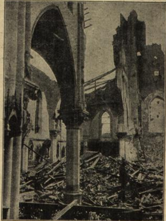
Die Kirche in Aubers in Französisch-Flandern.