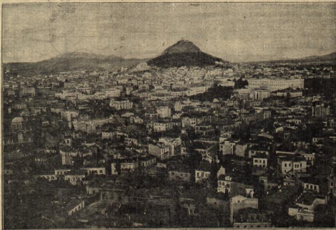
Athen, die Hauptstadt Griechenlands. (Rechts das königliche Schloss.)