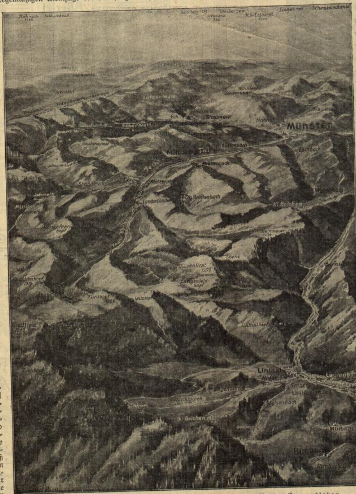
Der Schauplatz der Kämpfe in den mittleren Vogesen. Gezeichnet von Walter Emmerleben.

„Schön! Schön! Aber Wort halten, Bünz!“ Damit verschwand er in der Weinstube, in der die Franz-Joseph-Dusaren Sonntags ihren Frühschoppen leerten. Der Kellner sprang dienstfertig hinzu. Leutnant von Granitz rannte mit ihm zusammen, schnarrte den