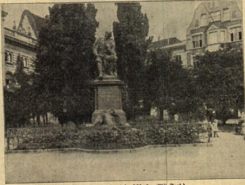
Das Geibel-Denkmal in Lübeck. (Mit Text.)

„Ich verspreche es, Bünz.“ „Ich danke Ihnen.“ Ein Händedruck. Bünz eilte zu seinem verunglückten Freunde.