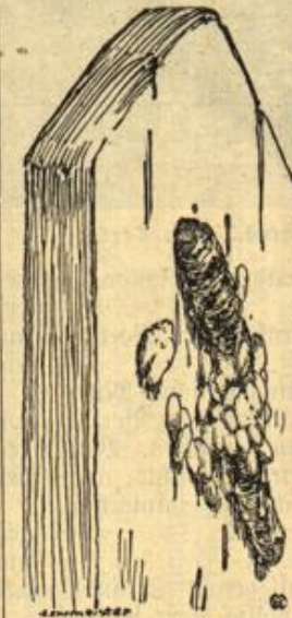
Abb. 1. Schlupfwespenkokons an einer toten Raupe.

Sind die Kokons der Schlupfwespe. Die Raupen legen keine Eier, sondern die Schlupfwespe bohrt ihren Legeftachel in die Raupe des Kahlweißlings und legt dabei ihre Eier in die Raupe ab. Sehr bald entschlüpfen den Eiern die Larven, kleine gelbe Maden, die sich von den Säften der Raupe nähren; sie hüten sich aber wohlweislich, den Darm ihres Wirtes zu verlegen. Die Raupe scheint keinen Schmerz zu emp- finden, denn sie kriecht ruhig weiter. Ist aber die Zeit ge- kommen, daß sie sich verpuppen will und erklimmt sie zu diesem Zweck Bäume oder Mauern, so durchfreiset sie inzwischen bis 5 mm lang gewordenen Ra- den die Haut der Raupe, die dann natürlich schnell zusam- menschrumpft und stirbt, während die gelben Maden sofort anfangen, sich einzuspinnen. Es ist erstaunlich, wie viele davon oft in einer ein- zigen Raupe schmarozen. Es mögen deren durch- schnittlich einige dreißig sein. Die gelben Kokons überwintern, ohne Schaden zu nehmen, und im Frühjahr entschlüpfen daraus die Schlupfwespe. Es sollten deshalb die gelben Kokons, die man im Winter an Wänden und in den Ritzen der Bret- terzäune sieht, geschont und nicht zerstört wer- den, wie es gewöhnlich geschieht, damit die nüt- lichen Schlupfwespen nicht vermindert werden.