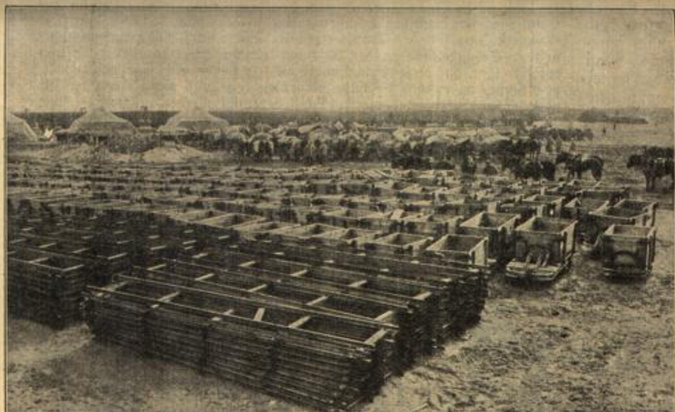
Der Wiederaufbau Ostpreußens. (Mit Text.)

aus: „Dann wach mit der ganzen Verlobung nicht! Den Vetter kenne ich zur Genüge, der tut es auf keinen Fall. — Du mußt Rat schaffen, Mama!“ „So versuche es doch erst noch einmal mit Onkel Eberhard!