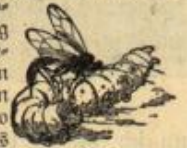
Abb. 2. Schlupf- wespenei, eine Raupe mit Eiern verhebt.