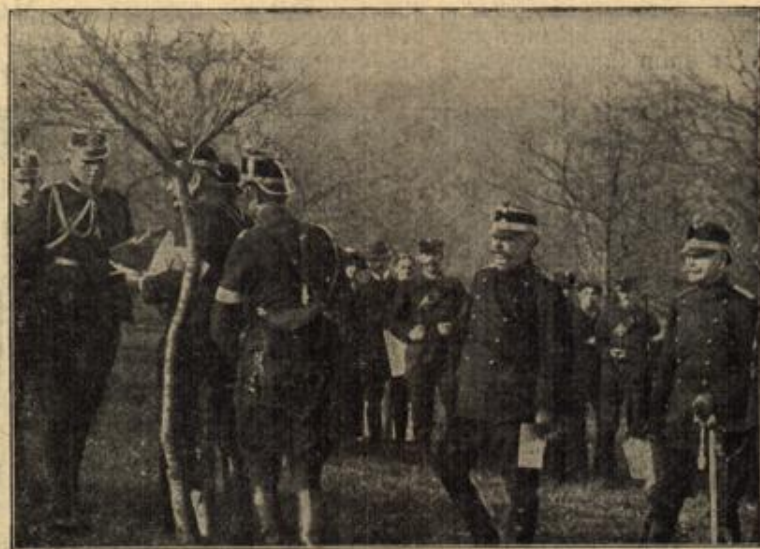
Schweizer Grenzwaht: Die Spitzen der Schweizer Bundesarmee bei einer Besprechung. In der Mitte: General Wille.

aus Dinkel Eberhards Andeutungen konnten sie ja schon vermuten, daß er ihnen sehr interessante Neuigkeiten verkünden werde. Und das war nun auch wirklich der Fall. Nachdem er erfahren, wie es um die Tante stand und ihnen in aller Kürze berichtet, daß der Inspektor Ellerhus sich nicht mehr in Haft befinde, sondern bei Nacht und Nebel geflüchtet sei, kam die Hauptsache: „Ja, denkt mal an, ich habe die ernstliche Absicht, mich zu verloben“, sagte er mit breitem Grinsen. „Und meine Zukünftige dürfte ganz gewiß nach eurem delikaten Geschmack sein: Es