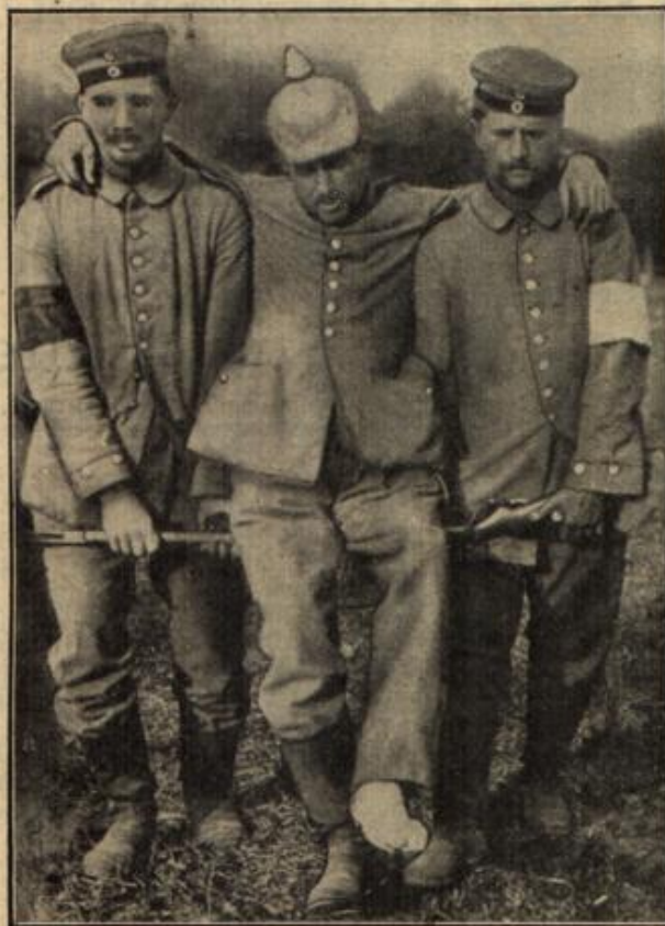
Beförderung von Verwundeten aus dem Schlachtfelde. (Mit Text.)

Ist nicht auch er einst heiß und stürmisch, von Offiziersberlangungen gewesen. Der Vater aber hat ihn in die Tretmühle des Alltags genommen, ihm immer schwierigere Aufgaben zu lösen gegeben.