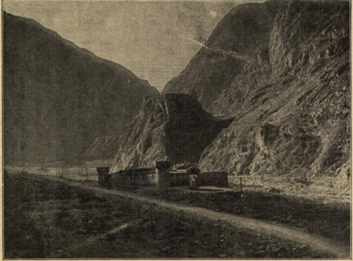
Alte Festung bei Tiflis an der grusinischen Heeresstraße im Kaukasus. Diese mehr als 220 km lange Gebirgsstraße, die bis zur Höhe von 2432 m aufsteigt, bildet eine Hauptverbindung zwischen Rußland und der Türkei.

Übermüdet von dem Schweren, das ihn betroffen, sank er schmerzerfüllt in seinen Stuhl zurück. Er wollte nichts sehen,