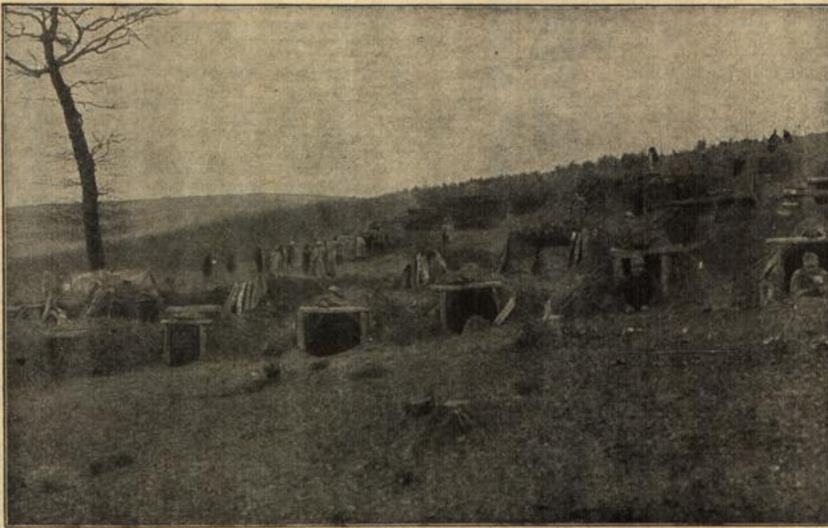
Vom österreichisch-ungarischen Kriegsschauplatz: Höhlenwohnungen der Tiroler Landesjäger bei Diszkovica.

ein furchtbares Erwachen aus einem seltsamen Traum. Alle Freude, alles Licht ist nun aus seinem Dasein gewichen. Ulla hat ihn verraten, verlassen um eines andern willen. Nichts wird sie davon abbringen, auch die flehende Bitte: „Ulla, lehre zu mir zurück, du tötest mein Herz, zerbrichst mein Leben, wenn du mich freigibst.“ Es würde alles nichts nützen, selbst wenn er sie zwingen wollte, die Seine zu werden, so würde ihm dies nie gelingen. Was wäre es auch, ein Almosen empfangen, da wo er selbst feste Liebe zu erwarten geglaubt. Stöhnend verbirgt er sein Haupt auf dem Schreibtisch. So verharrte er lange, überhört das Eintreten Jambo's, der seinen Herrn schon mehr als zehnmal zu Tisch gebeten hat. Als Jambo, beunruhigt über das Gebaren seines Herrn, näher kommt und sachte dessen Schulter berührt, fährt Armin wie aus schwerem Traume empor. Fremd und finster blickt er auf seinen Diener, so daß dieser erschrocken einen Schritt zurückwich. Was ist nur