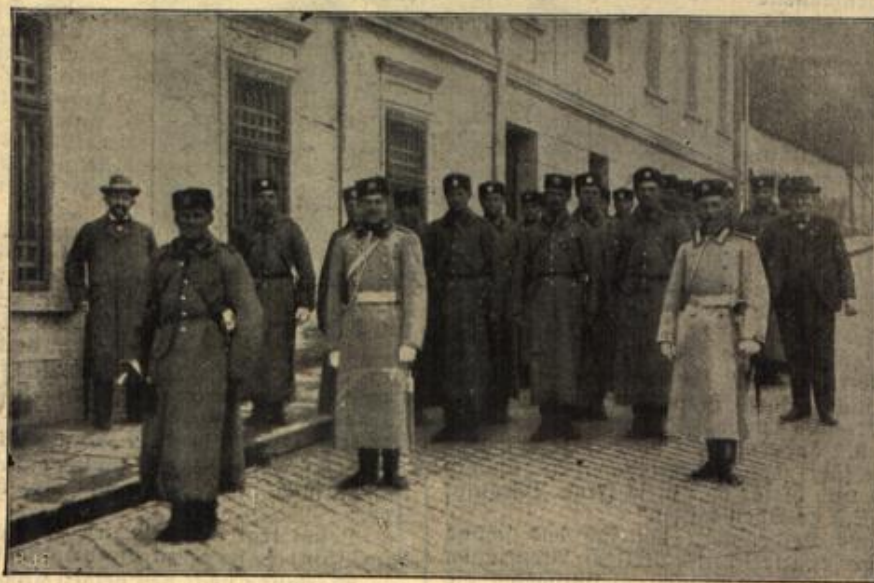
Zur Mobilmachung Bulgariens. Bulgarische Infanterie.

So schwach und nachgiebig Baronin Strehlen auch meist war, in einem Punkte konnte sie stark sein, selbst Konstanze gegenüber, in der Liebe zu ihrem Sohne. Ueber ihn duldete sie kein abfälliges Wort. Konstanze weiß das zur Genüge, aber gerade