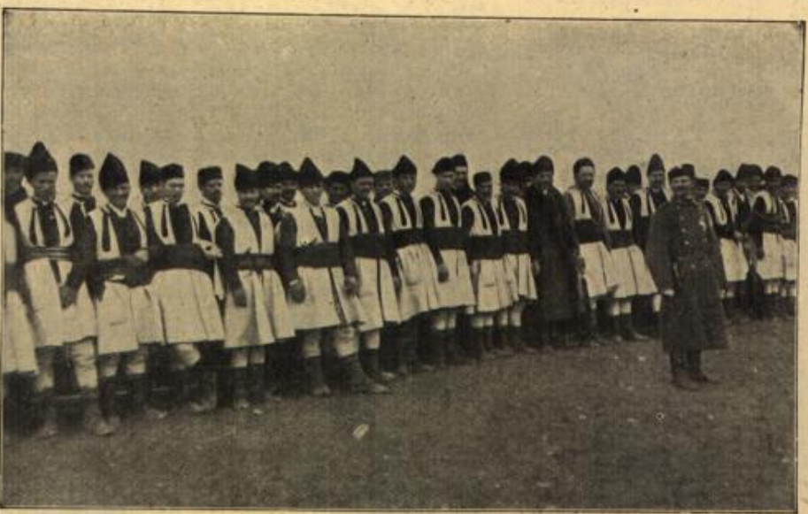
Mazedonische Truppen im bulgarischen Heere.

Marianne ist feuerrot aufgesprungen bei den harten, höhnischen Worten. Wie hilflos blickt sie zu Herbert hinüber. Da erblickt sie jäh. Was sie in seinen Augen liest, treibt ihr alles Blut zum Herzen. Unverwandt blidt er auf Konstanze, in namenloser Qual saugen sich die Blicke der beiden, schönen