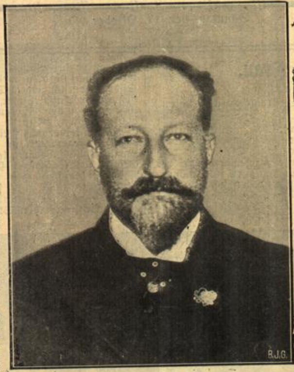
König Ferdinand von Bulgarien.

„Nein, ich gehe nicht, Tante Hildegard.“ Wenigstens geht noch nicht. Erst will ich die Süßigkeit meiner Rache verkosten. Aber fürchte nichts! Eine Konstanze Wanderott vergibt sich nichts.