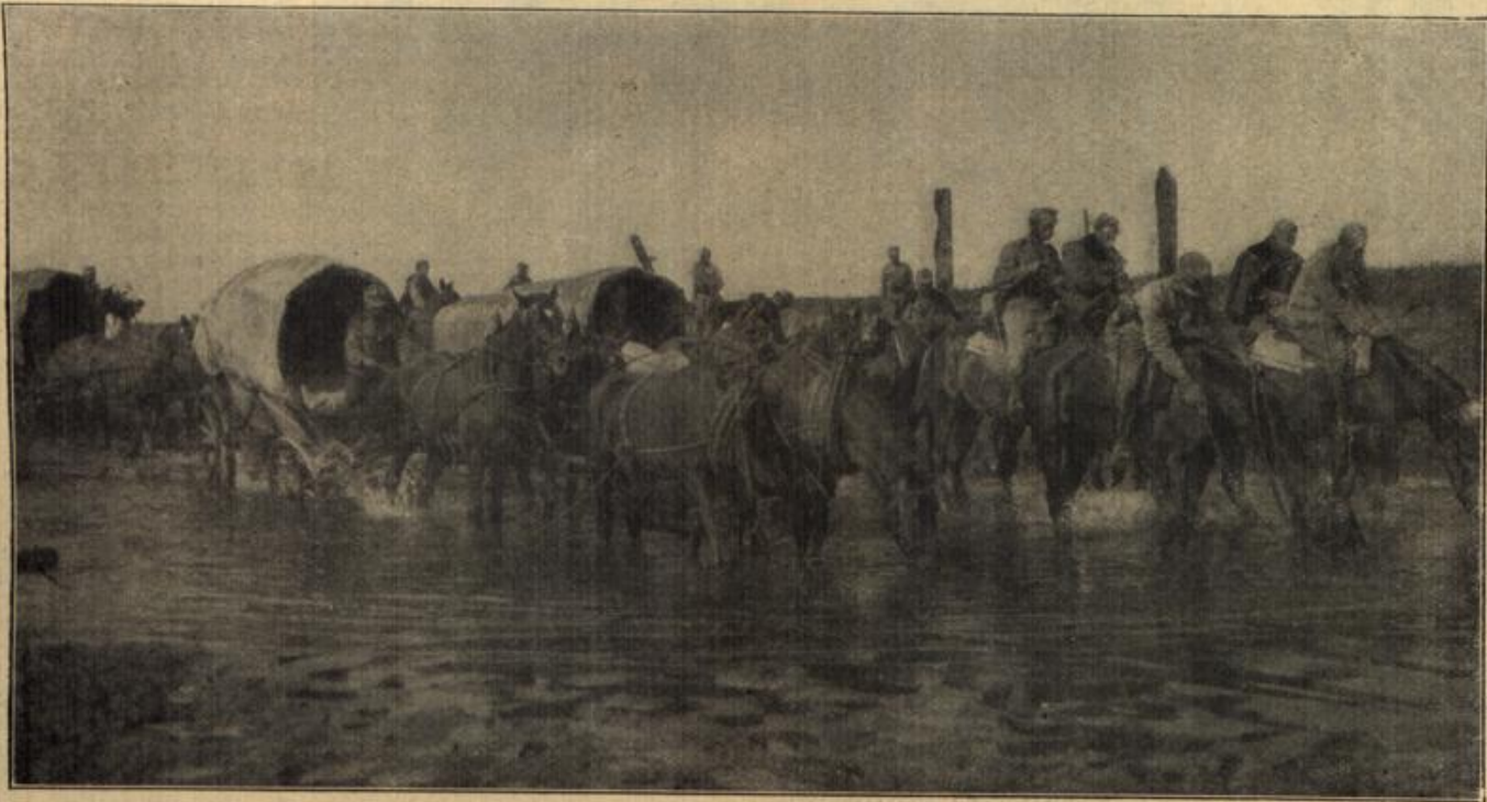
Traintolonnen beim Durchqueren eines der vielen kleinen Seen im Pripjetgebiet.

Manchmal mußte sie notgedrungen innehalten; dann erschütterte ein heftiger Husten ihren mageren Körper und zwei brandrote Flecke zirkelten sich auf ihre knochigen Wangen.