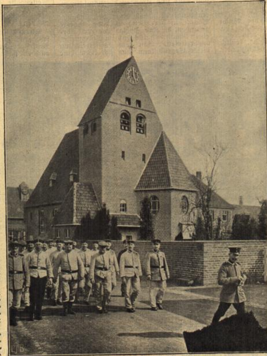
Die Werkbund-Ausstellung in Köln während des Krieges: Pioniere vor der Kirche.

Sie streifte sich den Ärmel des Kleidchens auf und hielt der Näherin den mageren Arm hin. Der war an manchen Stellen mit dunklen und schorfigen Flecken bedeckt, wie scharfe Züchtigungen mit harten Gegenständen sie hervorzurufen pflegen.