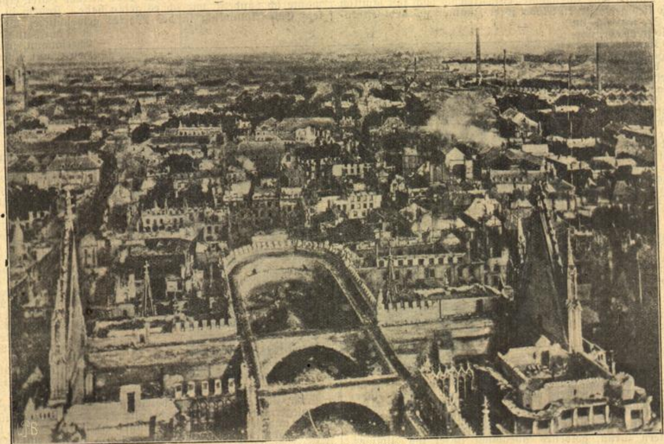
Wie Reims heute aussieht.

Gleich am andern Morgen stellt sie Herbert zu Rede. Sie sieht bleich und übernächtlich aus, dunkle Ringe umschatten ihre