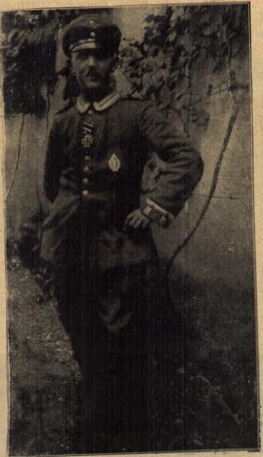
Walter Kandulski, der Ueberwinder des französischen Sturzfliegers Pegoud.