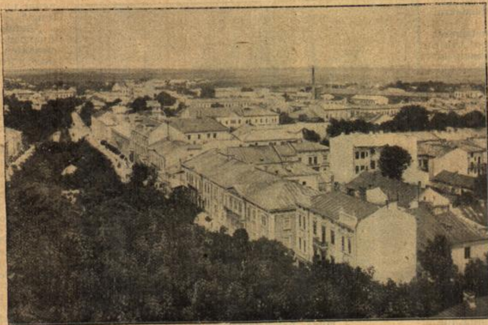
Gesamtansicht von Tarnopol.

Aber mit einem Male kam in die sonst so stille Kammer, in der in den Ecken Spinnen nisteten, ein erregtes Leben. Da brachte der Mann mit dem blauen Rod und den goldenen Borten noch viele andere mit. Dieselben griffen nach den Stiefeln, die erschrocken aus ihrem langen Schlafe aufwachen, und schleppten alle fort. Dann wurden die vielen Paare in einen Hof gebracht, in dem lange Reihen von Männern standen; und jeder erhielt ein Stiefelpaar. Und das eine des Meisters Theobald empfand etwas wie Freude dabei, als es in dem einen, dem es zugereicht wurde, eben den Meister Theobald erkannte. Aber das Erkennen bei diesem Wiedersehen wurde nicht erwidert, denn der Meister Theobald sah so ernst drein und zeigte keinerlei Freude bei diesem Begegnen.