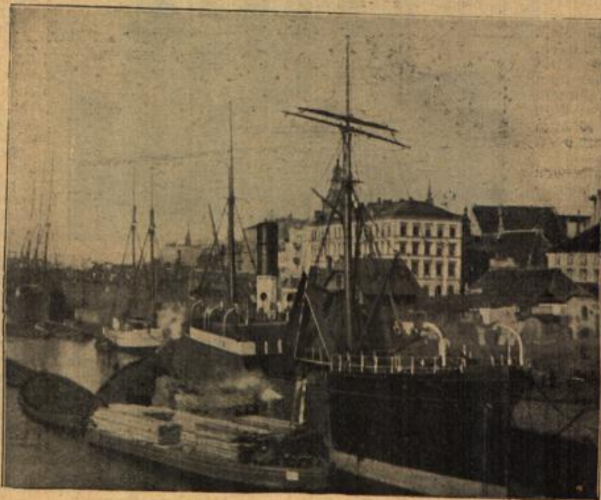
Riga. Am Linaqual.

„O Gott! Mein Vater! Meine arme, arme Mutter!“ rang es sich wie ein Aufschrei von seinen Lippen.