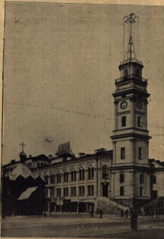
Das Dumagegebäude in Petersburg.

Nachdruck aus dem Inhalt dieses Blattes verboten Gesetz vom 19. Juni 1901. Verantwortl. Redakteur Z. Kellen, Bredeneß (Kultur.) Gedruckt und heraus- gegeben von Fredebeul & Roenen in Essen (Ruhr)