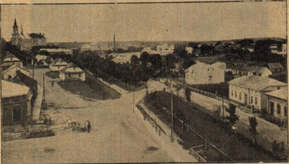
Blick auf den Promenadenring und das Schloß in Carnopol.

Was mochte das für ein anderes Feld sein? Hatte ihn das alte Paar nicht auch über Felder getragen, wobei gleichfalls von allen Seiten Salven geknattert hatten? Nur waren dabei nicht so viele niedergestürzt wie auf den Wegen, über die es den Meister Theobald geführt hatte. Sollte der Geselle Martin aber trotzdem gerade eine Sehnsucht nach jenem Felde haben? So mußte es wohl sein, wenn dies auch von dem alten Stiefelpaar,