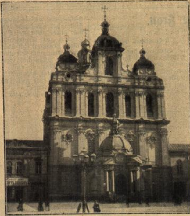
Vilna: Die berühmte Kathedrale.

unerschütterlicher Festigkeit gehalten. Nicht eigener unerschütterlicher Festigkeit gehalten. Nicht eigener