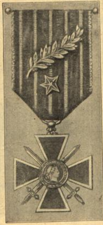
Eine neue Kriegsanzzeichnung in Frankreich.

Der alte Herr war diesen klaren Ausführungen mit größter Aufmerksamkeit gefolgt. „Ich räume ohne weiteres ein," sagte er jetzt bedächtig, „daß die von Ihnen dargelegten Verdachtsmomente die Verhaftung des Kassenboten wohl rechtfertigen können. Und doch — Sie werden bald einsehen, Herr Kommissar, daß noch ein zweiter Mensch, wenn man sich nur auf Indizienbeweise stützen will, mindestens ebenso schwer belastet ist, wie jener Hartung. Die Umstände nun, die mich in diese Kriminalsache mit hineingezogen haben, sind so eigenartig, daß ich schon etwas weiter ausholen muß. In unserem juristischen Bureau beschäftigen wir seit drei Jahren ein junges Mädchen als Tippfräulein, wie man ja wohl zu sagen pflegt, welches ich mir mit der Zeit zu einer für mich recht wertvollen Hilfskraft herangebildet habe. Das ständige Zusammenarbeiten brachte es mit sich, daß ich bald ein freundschaftliches Interesse an diesem ebenso bescheidenen, wie fleißigen und intelligenten Kinde nahm. Seit einigen Tagen nun fiel mir Fräulein Manfred durch ihr bedrücktes, völlig verändertes Wesen auf. Und