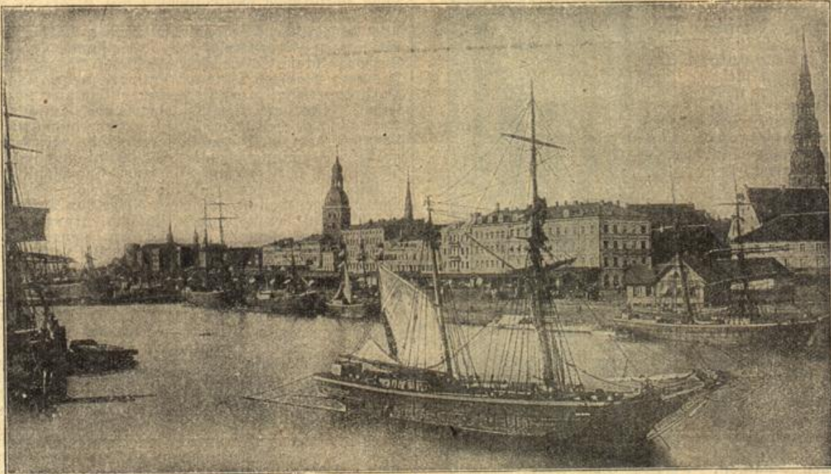
Die Stadt Riga, Hafenanficht

Unbegreiflich. Da lese ich eben, in Serbien soll es an Papier fehlen. Das ist mir unbegreiflich, es gibt dort wahrhaftig „Lumpen“ genug!