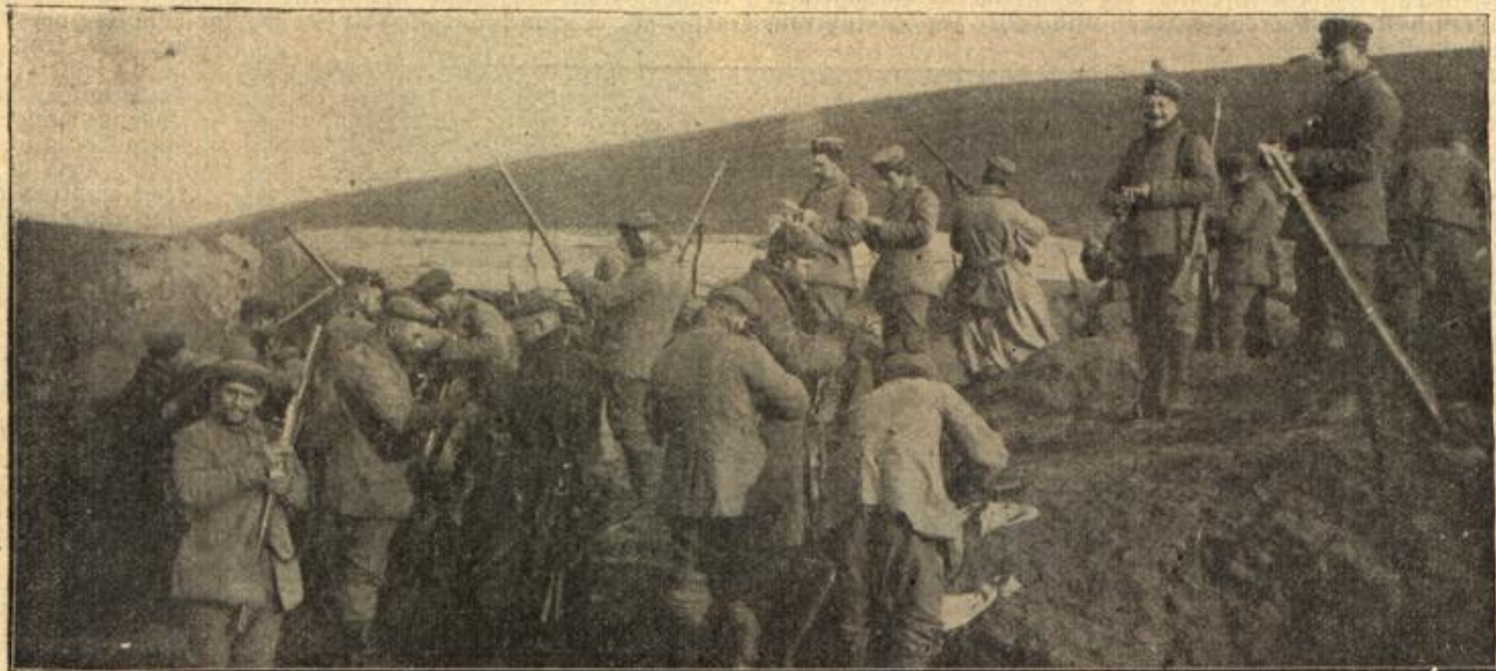
Gewehrreinen nach abgeschlagenem Angriff im vordersten Schützengraben (Westgalizien).