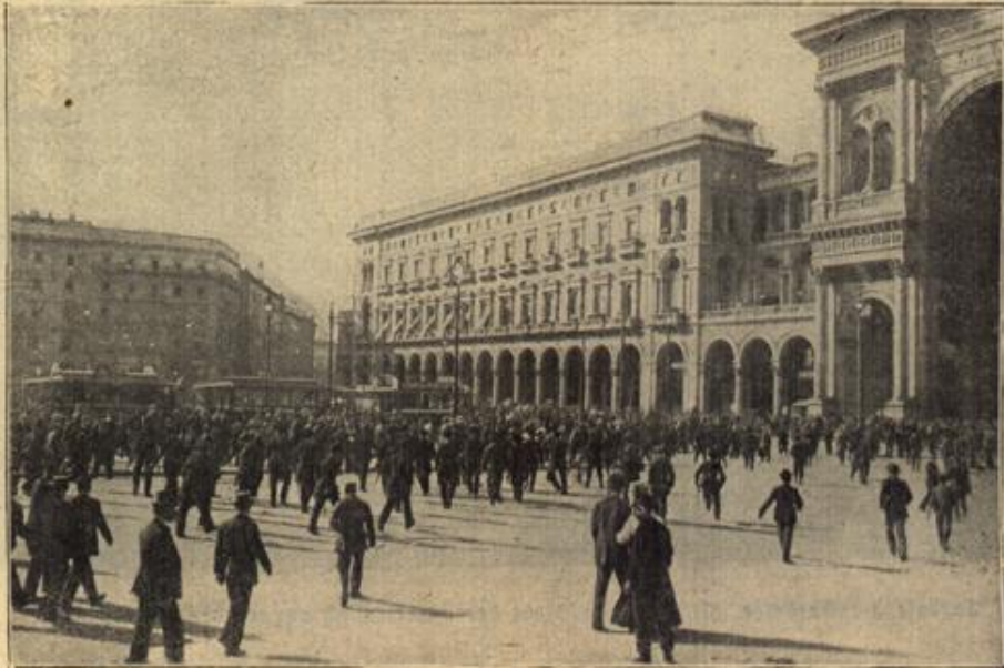
Die Kriegsstimmung in Italien.

Vor Verdun hatten sie zuletzt gelegen. Es war ein ermüdender Stellungskampf, der harte Anforderungen an ihre Nerven stellte. Manchmal war es wohl ruhig, so daß nur hin und wieder eine Granate sich zu ihnen herüberverirrte — dann aber wieder gab es Lagen, an denen die Franzosen erbitterte Ausfälle und Angriffsversuche machten. Seinen Helm hatte schon in Belgien eine Kugel durchschlagen, seine Feldflasche war zerschossen, selbst seinen Mantel hatten mehrere Geschosse durchpflissen — doch ihn selbst traf es nicht. — Da, beim letzten Sturmangriff, hatte er es plötzlich in seiner Brust gefühlt, wie einen Schlag zuerst, und dann stechenden Schmerz. Warmes, rotes Blut quoll unter der Uniform hervor; blutigroter Nebel, darin feurige Funken tanzten, wogte vor seinen Augen — ihm schwanden die Sinne — kam jetzt die Erlösung vom Leben?