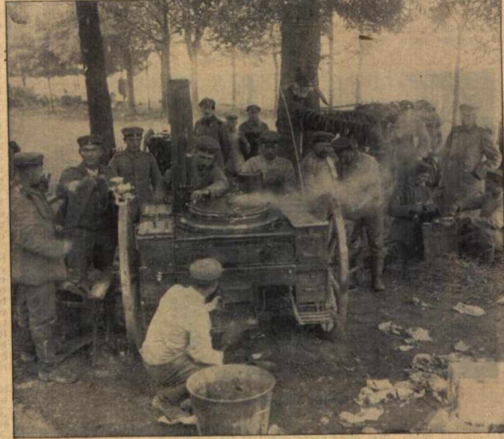
Hinter der Front in der Champagne: Deutsche Wurstfabrik im Walde.

Die beiden Freunde hatten beschlossen, bei der Suche nach einer Stellung vor allem darauf zu achten, daß sie im gleichen Unternehmen, zum mindesten in der gleichen Stadt eine solche fänden. Würde es auch gelingen? Es wäre ein Zufall, und in beiden war eine bange Sorge, die der Gedanke an eine Trennung, die dann wohl eine Trennung fürs Leben wäre, heraufbeschworen hatte, erwacht. Gegenständig ließen sie sich dies freilich nicht merken. Die Fahrt in die Dolomiten sollte diese Sorge überflüssig machen.