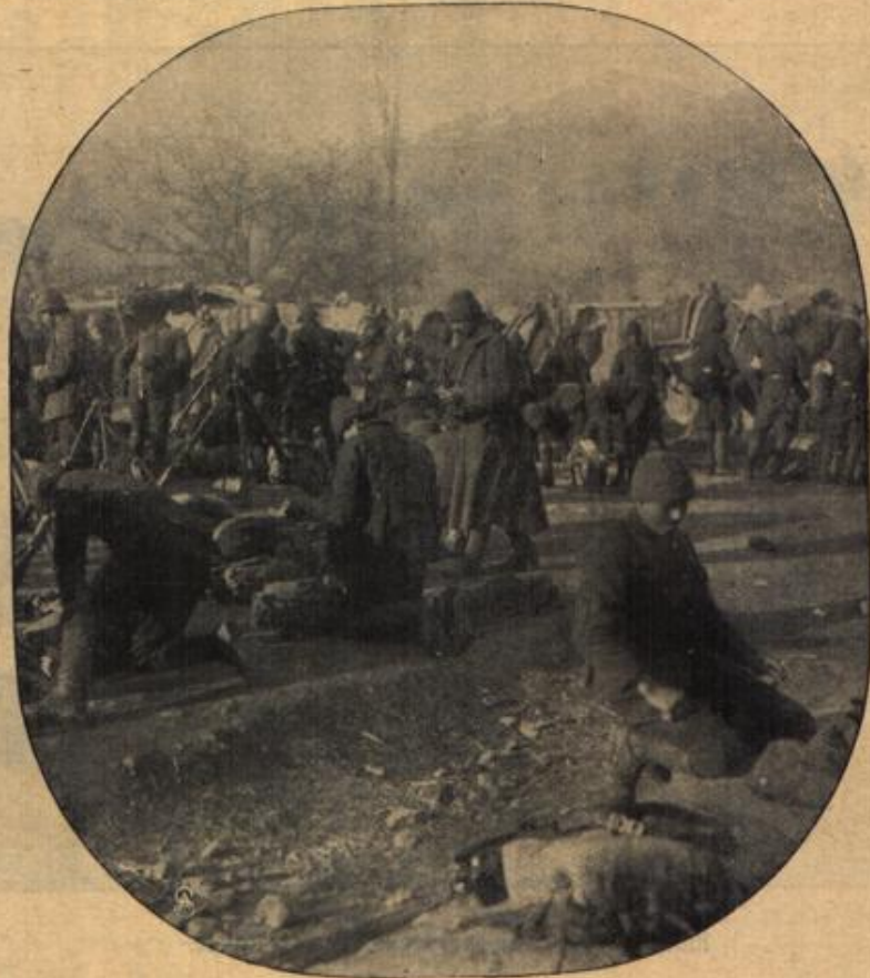
Türkische Infanterie vor dem Ausbruch im Caucasus.