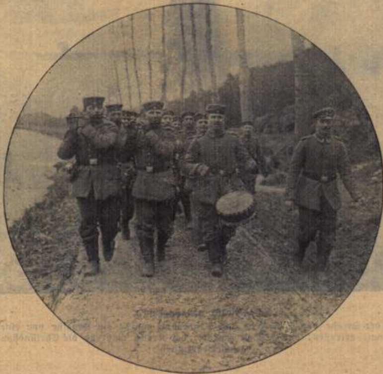
Ein Übungsmarsch bei klingendem Spiel an den Ufern der Aisne.

Erstaunt hatte Martha zurückgeblickt und sah sich einem Fremden gegenüber, einer mittelgroßen Gestalt mit bartlosem, knochigem