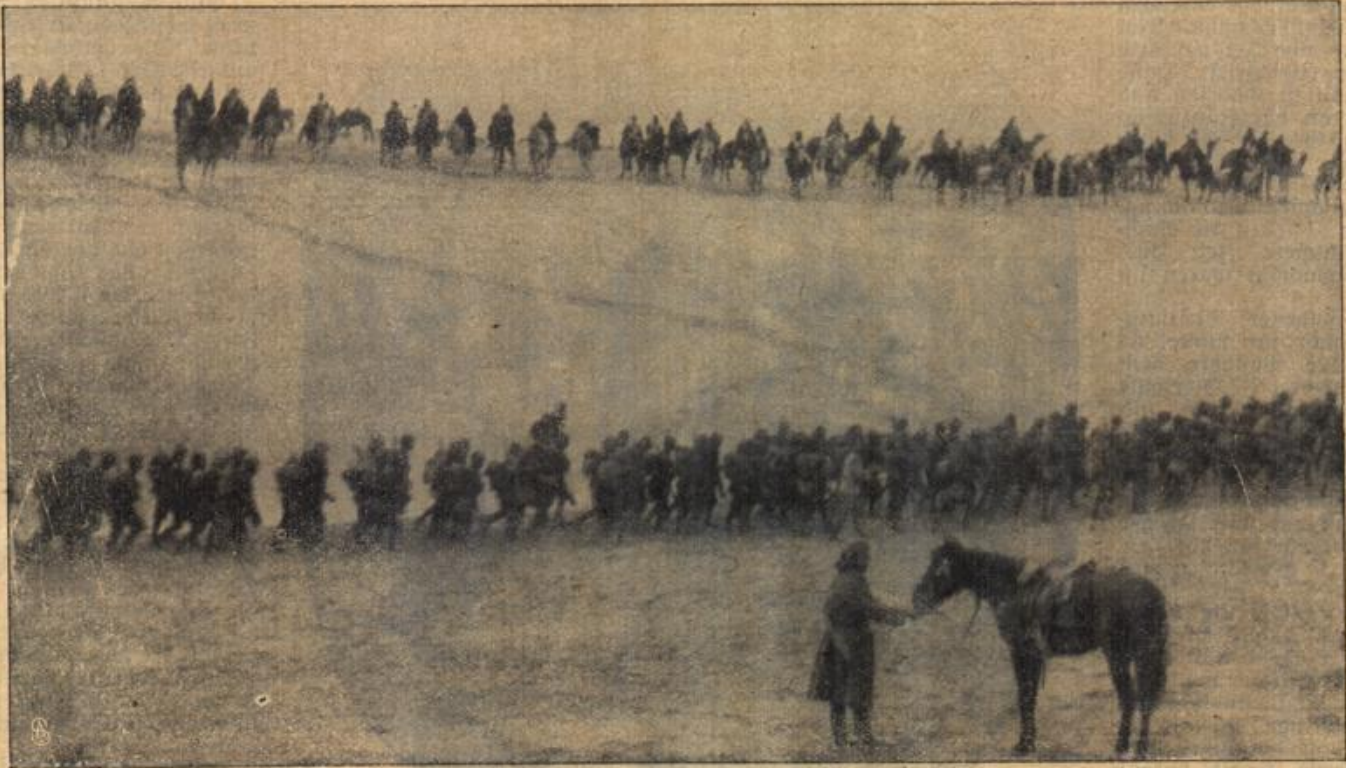
Marchkolonne syrischer Truppen in der Wüste.

Vielsagende Frage. Vater: Hast du den Wirt schon bezahlt, für welchen ich dir 50 Mark schicke? — Sohn: — Welchen meinst du denn?“