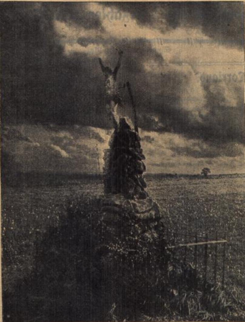
Das Kreuz von Saarburg.

Auf der Straße von Saarburg nach Bruderdorf wurde ein Kreuz aus Granat getroffen; das Geschloß zerbrach das Kreuz, während die Christusfigur unverletzt blieb.