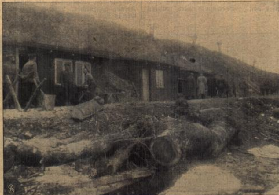
Dom westlichen Kriegsschauplatz: In eine Anhöhe hineingebaute Erdwohnungen deutscher Soldaten.

„Warum denn nicht die Ehrlichkeit, Gestohlenes zurückzugeben?“