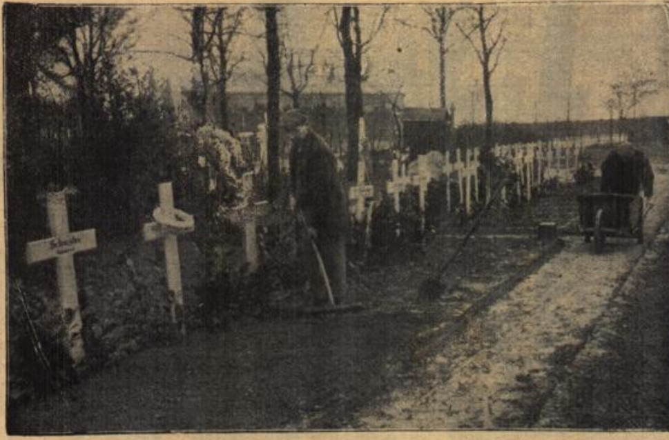
Deutsche Soldatengräber in Belgien.