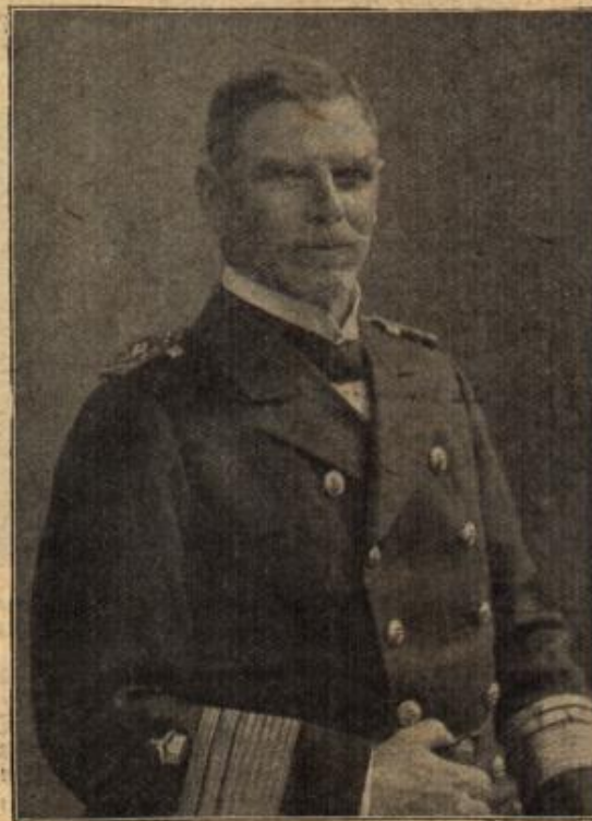
Vizeadmiral Maximilian Graf v. Spee.

Die Ställe und Wirtschaftsgebäude lagen voll französischer Verwundeten, für welche der bei ihnen zurückgelassene Arzt von mir die Beschaffung von Bouillon verlangte, welche ich ihm leider nicht geben konnte. In einem Doppelbett lag nebeneinander ein ungleiches Paar, welches merkwürdigerweise die fast gleiche Ver- wundung aufwies, nämlich eine Schußwunde dicht unter dem