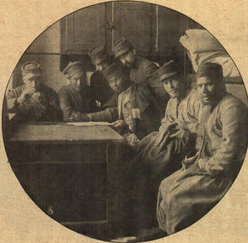
Aus dem Gefangenenlager in Ohrdruf in Thüringen. Russen, Franzosen und Turkos.

In's schier Endlose ließe sich die Reihe der Beispiele verlagern. Aber schon das, was hier Platz finden konnte, wird wohl ausreichen, um dem Leser zu zeigen, daß der Erfinderdrang sich mitunter auf ganz seltsame Gebiete verläuft und dann mancherlei einträgt — bloß kein Geld. Das aber ist doch die Hauptsache, wenigstens wenn man die materialistische Denkweise gelten läßt, die zu Anfang dieser Zeiten entwidelt ist. Schade ist's nur um all die Mühe und auch den Kapitalaufwand, mit denen doch nur Unbrauchbares oder gar Lächerliches zustande gebracht wird. Immerhin: ganz und gar unnütz sind letzten Endes auch sie nicht veran, denn wirklich ernstgemeintes Streben geht nicht spurlos unter. Wir vermögen nur nicht allzuweit die Zusammenhänge zu erkennen