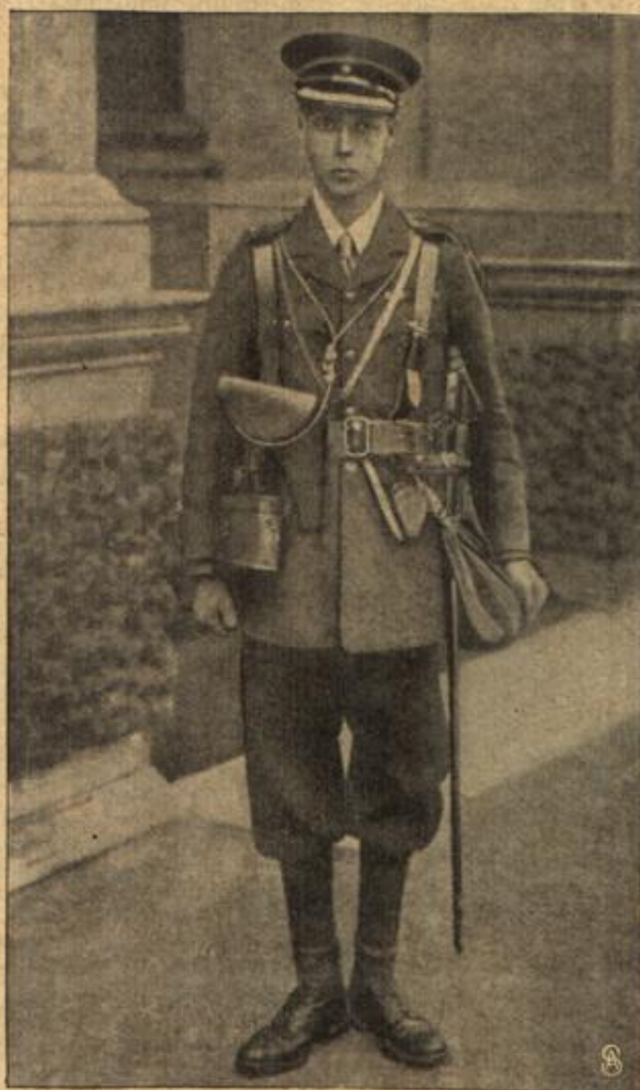
Der Prinz von Wales.