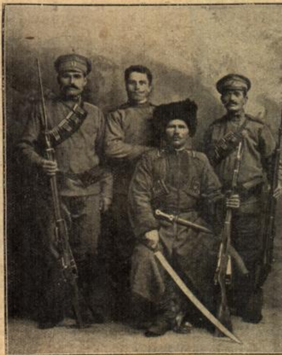
Russen in Tchernowiz.

Nachdruck aus dem Inhalt dieses Blattes verboten. (Gesetz vom 19. Juni 1901.) Verantwortl. Redakteur: E. Kellen, Bredebeck (Habr.). Gedruckt u. herausgegeben von Fredebeul & Kornen, Str. n. (Habr.).