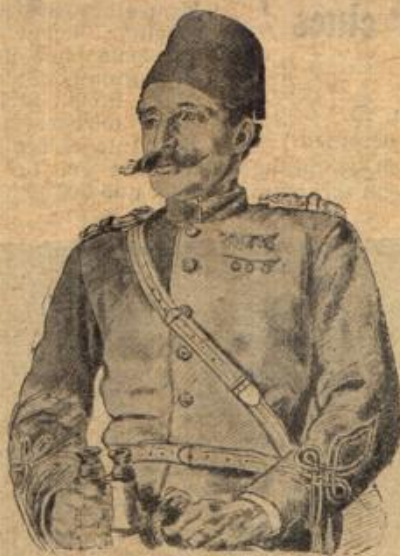
Ein türkischer Brigadegeneral.

Suche andere zu erfreuen, zu trösten, zu unterhalten' ihnen zu schenken, zu danken, zu helfen, mit ihnen recht freundlich, recht liebevoll, zuvorkommend, in allem recht ge- fällig, lieb und rücksichtsvoll zu sein.