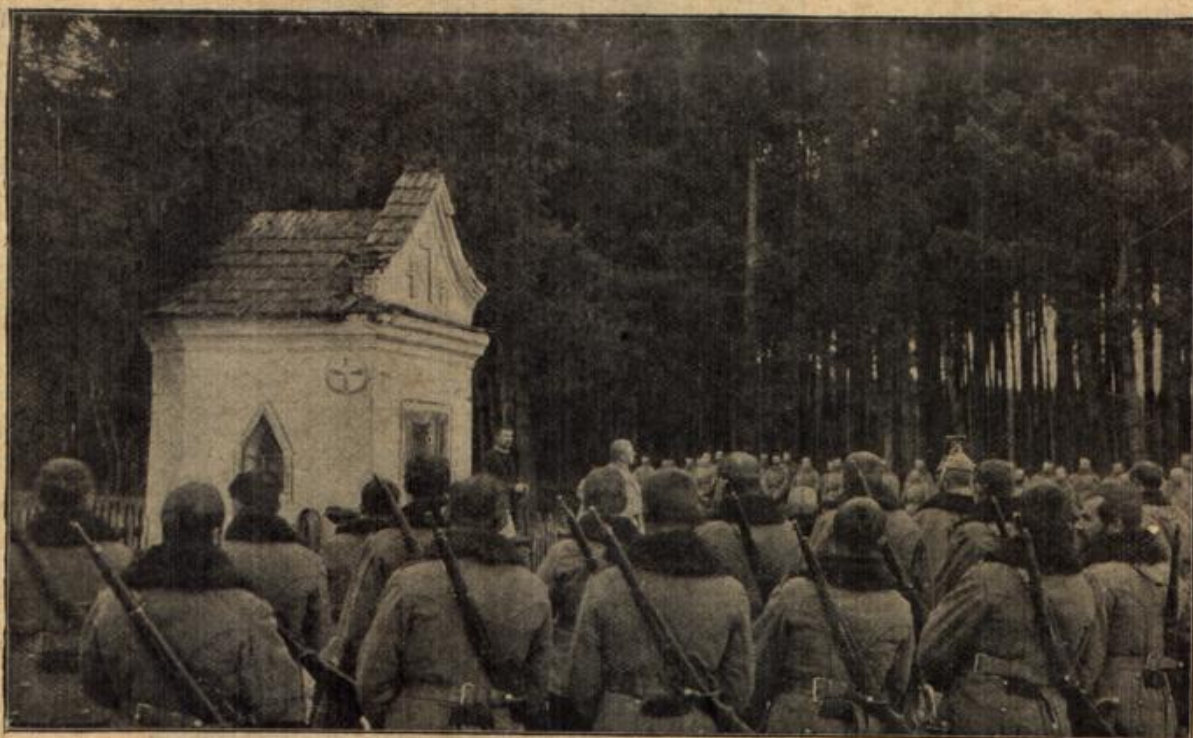
Vom österreichisch-ungarischen Kriegschauplatz: Ein Feldgottesdienst nach einem Begräbnis.

Ein anderer will seinen Mitmenschen warme Füße verschaffen und baut einen „Pedalcalorifactor“ — der wissenschaftliche Name