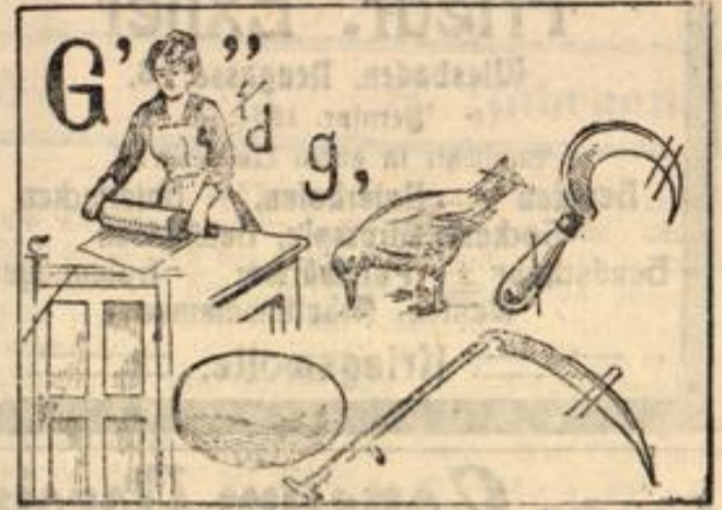
Gold gab ich für Eisen.

?) Bienenstock. Während der Winterruhe soll am Bienenstande vollständige Ruhe herrschen. Man soll aber nicht nur die Bienenstöcke ruhig stehen lassen, sondern auch die Erschütterungen vermeiden, die durch Klopfen, Hämmern, Fahren usw. hervorgerufen werden. Dann aber Sorge man in besonders vorsichtiger Weise dafür, daß sich keine Mäuse einnisten, denn diese richten durch ihre Unruhe sehr großen Schaden an. Sie ziehen durch ihren Geruch aber auch Kägen an und dann entwickelt sich nachts ein Degenabath, der in kurzer Zeit einen ganzen Stand ruinieren kann.