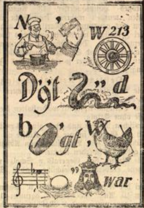
Noch nie ward Deutschland besiegt, wenn es einig war

allerdings wahr, daß ich noch nicht im Feuer gelitten bin. Aber wenn alle Frauen in meiner Heimat über den Krieg sprechen und über die Heldentaten ihrer Männer berichten, kann ich doch nicht meiner Frau zumuten, daß sie allein nichts zu sagen weiß.“