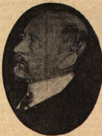
Wirtl. Geheimrat Professor Dr. Emil v. Behring. (Mit Text.)

weg am Kanal entlang, wo nicht mitnehmen wollte. Wir mußten die Nacht auf Deck bleiben, — da hat er Wache bei mir gehalten und mich mit seinem Über-