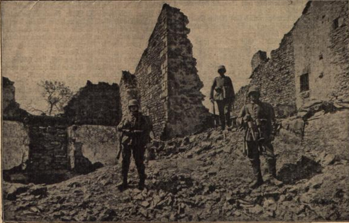
Aus den Kämpfen bei Verdun: Deutsche Sturmtruppen mit den neuen Stahlshühnelmen.

Als der erste Sturm vorüber war und ich Zeit fand, mich um-