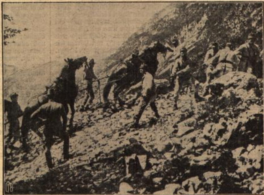
Schwieriger Transport von Gebirgsgehäusen in den Tiroler Alpen.

Unterwegs merkte ich, daß auch Englands Kriegserklärung drohend über uns hing, — man versicherte mir, daß keine Möglichkeit zur Heim-