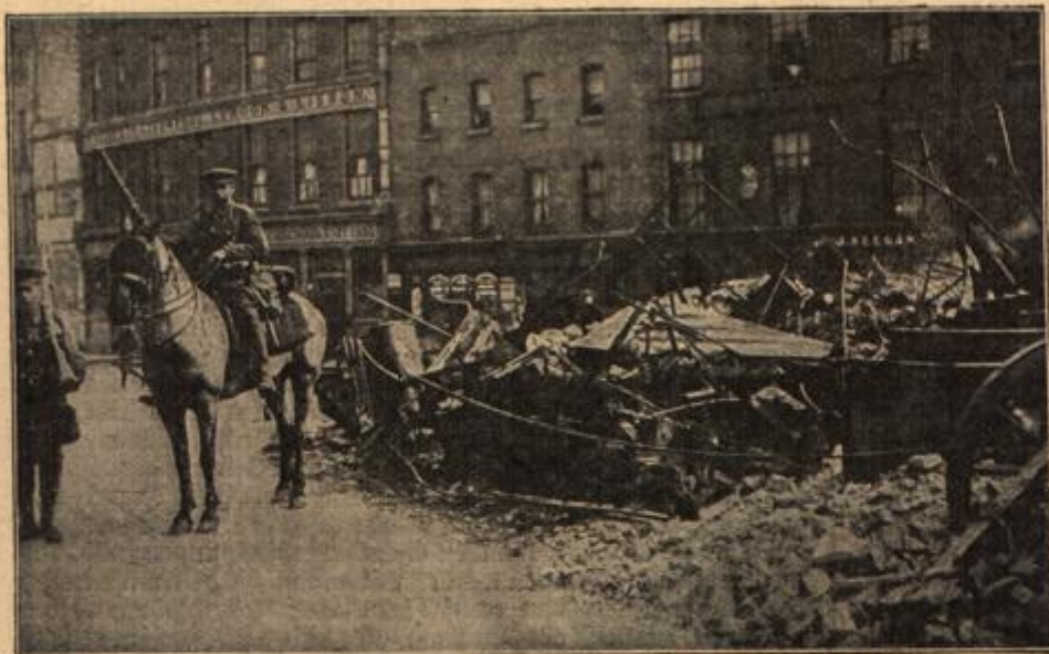
Vom Hauptplatz der irischen Befreiungskämpfe:

Eine durch englische Artillerie zusammengeschossene Barricade in der Piffenstraße in Dublin. Die Barricade bestand aus Wagen der Usterischen Straßenbahn.