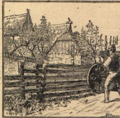
Wo bleibt der Fuhrmann?