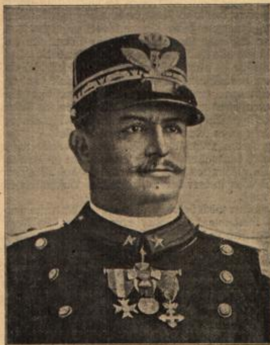
General Paolo Morrone, der neue italienische Kriegeminister.

Da hob mich ein deutscher Student — er war aus Cambridge geflohen und wollte als Kriegsfreiwilliger eintreten, — im letzten Augenblick zu sich in den schon fahrenden Zug. All mein Gepäc ließ ich leichten Herzens zurück, — nur dankbar, heimzukommen. Er gab mir seinen Platz, teilte sein Brot mit mir, erklämpfte mir einen Platz auf dem schon überfüllten Schiff, das mich ohne einen Ausweis und Fahrschein weg am Kanal entlang, wo nicht mitnehmen wollte. Wir mußten die Nacht auf Deck bleiben, — da hat er Wache bei mir gehalten und mich mit seinem Über-