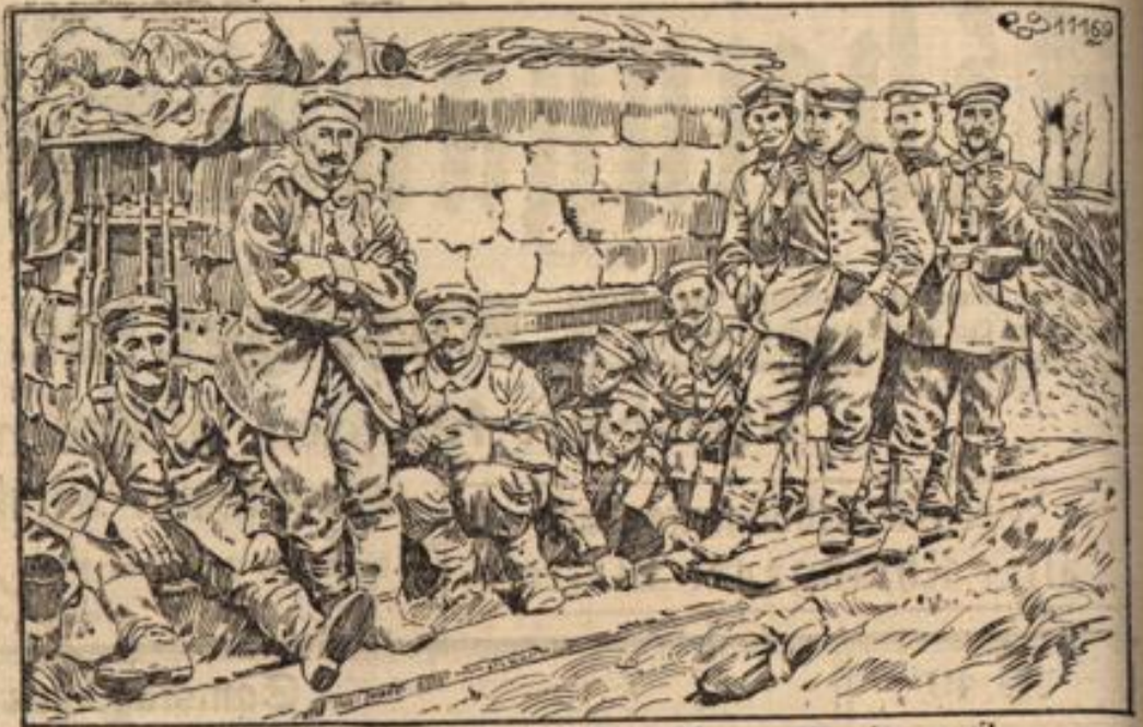
Wie unsere Feldgrauen jetzt ihre Unterstände ausbauen.

Unsere Aufnahme zeigt einen zurechtgebauten Unterstand von unseren Feldgrauen, wie er jetzt aussieht. Früher wurde er aus Baumstämmen aufgebaut und mit Säcken bedeckt.