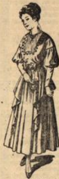
Nr. 4729 Kleid mit wasserfallartigem Liebeskleid.

An den Unterschied zwischen größter Einfachheit und elegantester Ausschmückung in unserer Frauenkleidung werden wir uns allmählich wohl gewöhnen müssen. Bei der einen Art heißt es nämlich jetzt sparen, sich nach der Deke strecken und wenn möglich aus Altem Neues machen. Diejenigen, die die Geldmittel dazu haben, verbinden dagegen damit auch die Verpflichtung, zum „Durchhalten“ aller Industrien beizutragen und auch nicht knauserig bei der Anschaffung ihrer Kleidungsstücke zu sein. Selbstverständlich ist jede Liebetreibung auch hier zu meiden. Nebenstehendes Gesellschaftskleid bedarf für Rock und Taille nur 5 1/2 m Stoff bei 1,10 m Breite und eignet sich besonders für leichte Seide, Schleier, oder sonst einen klaren Stoff. Der tiefe, eckige Taillenausschnitt wird durch ein Tüllbündchen gedeckt und der verdickerten Schulter ist eine Puffe angelegt, der sich vom Ellbogen an ein enger Ärmel anschließt. Der hohe Gürtel tritt vorn auseinander. Eigenartig wie die Taille ist auch der Rock, dessen hinten zippiges Unterkleid vorn hinterfallartig in eine breite Vorderbahn verläuft. Das hübsche Kleid kann mit süße eines Savorischnittes von jeder Frau selber gearbeitet werden. Schnitt zur Taille unter Nr. 4729 in 44, 46, 48, 50, 52, 54, 56 cm halber Oberweite 60 Pf., zum Rock unter Nr. 488 in 96, 100, 104, 108, 112, 116 cm Hüftweite 80 Pf. Zu beziehen durch die Modenzentrale, Dresden-II. 8.