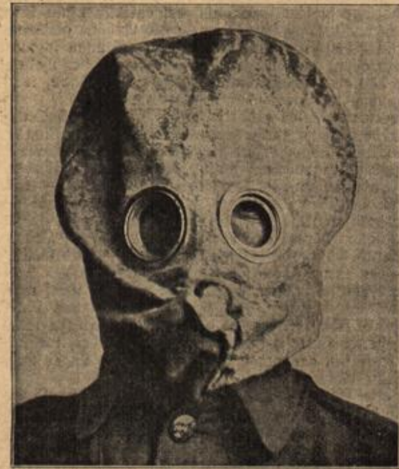
Englischer Infanterist mit einem der neuen Schutzhelme gegen betäubende Gase.

Noch erstaunter blickten da die Träger auf das junge Ding, welches so rein und glatt deutsch sprach, als wäre sie eine Lands- männin von ihnen. Und so war es auch. Auf Befragen erzählte Marie, daß ihre verstorbenen Eltern Deutsche gewesen. Nach ihrem Tode war sie von der Schwester der Mutter, die an einen Franzosen verheiratet war, aufgenommen worden.