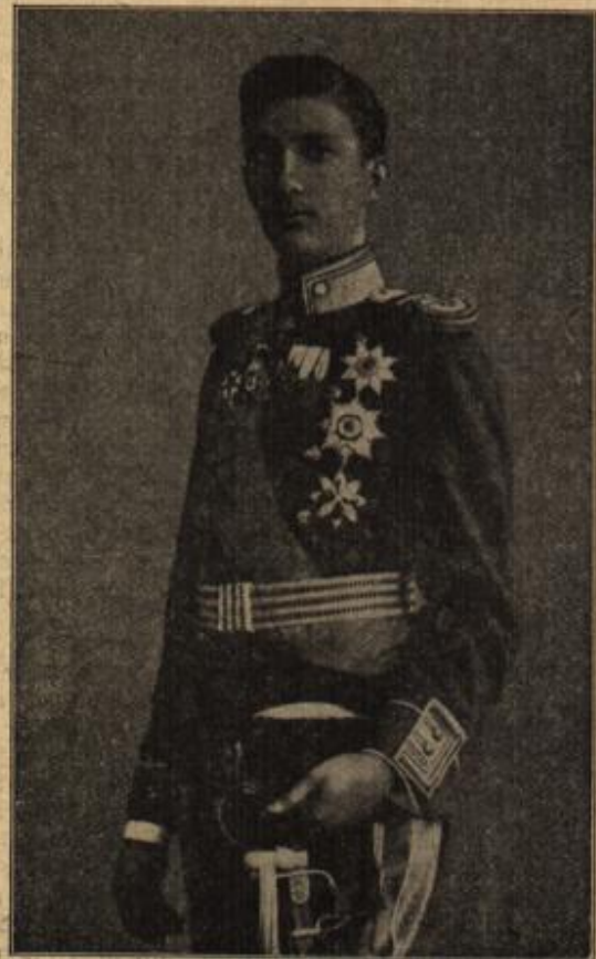
Boris, Kronprinz von Bulgarien.