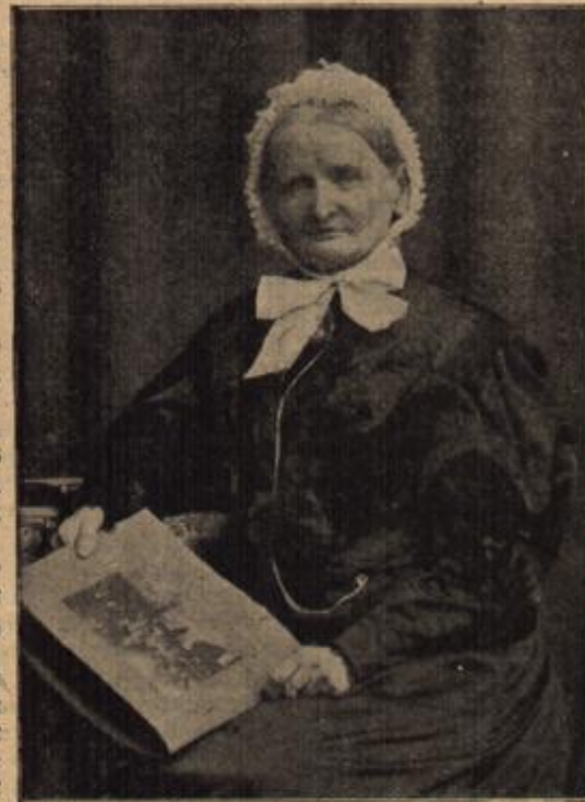
Die Mutter des Generalfeldmarshalls v. Madensen vollendete kürzlich ihr 89. Lebensjahr. Der Generalfeldmarschall ist ihr ältester Sohn.