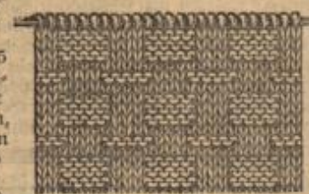
Arbeitsprobe zur Sportjade.

vielmehr in den verschiedensten Farben gestrickt oder gehäkelt werden. Auch die Verbindung zweier Farben, wie grau-weiß, nimmt sich sehr hübsch aus. In dieser Weise wurde auch die Jade gefertigt, die unsere Abbildungen darstellen, und zwar ist die ganze Jade in dem nebenstehend abgebildeten Muster in grauer Sportwolle gestrickt, während der aus einfachen, rechten Maschen bestehende Rand in weißer Wolle angefügt ist. Um die Jade zu stricken, verfährt man folgendermaßen: Man legt einen gut passenden Schnitt zugrunde, der aus 5 Teilen (Rücken, 2 Borderteile, 2 Ärmel) besteht, und beginnt mit dem 5 Zentimeter breiten, glatten Rand aus rechts gestrickten Maschen.