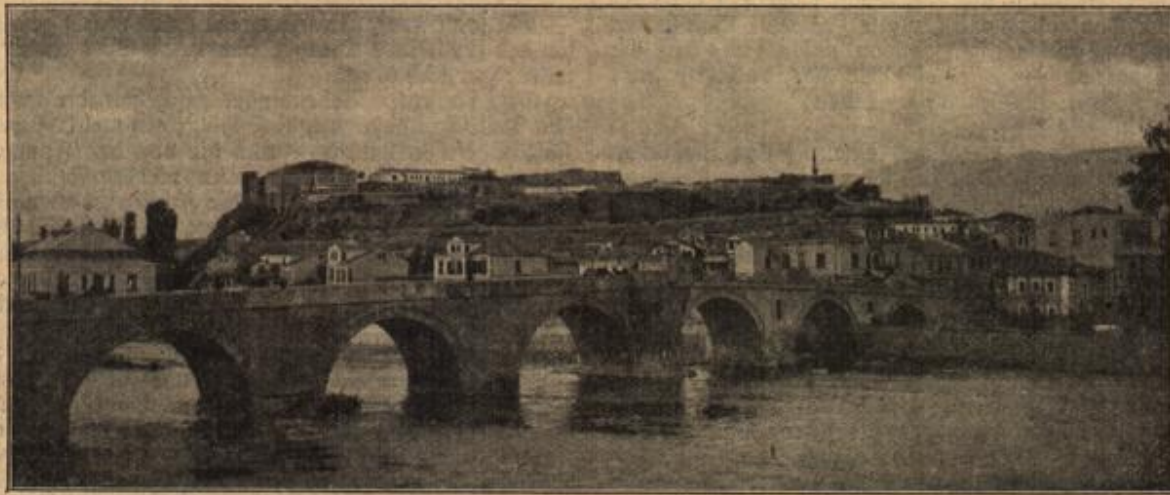
Die serbische Stadt Skopje, die alte Hauptstadt Mazedoniens. (Mit Text.)

und die Füßchen, die gestern so schwer gingen, die fliegen heut fast über den beschwerlichen Weg. — Und nun ist Marie ange- langt. Ihr blonder Führer erwartet sie und führt sie durch lange, hölzerne Bauten in einen schattigen Garten. — Dort sitzt, noch