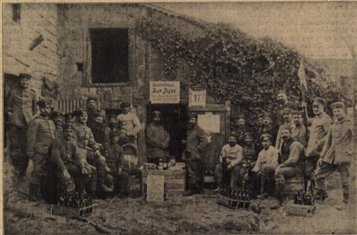
Ein „Warenhaus“ auf dem westlichen Kriegsschanplatz.