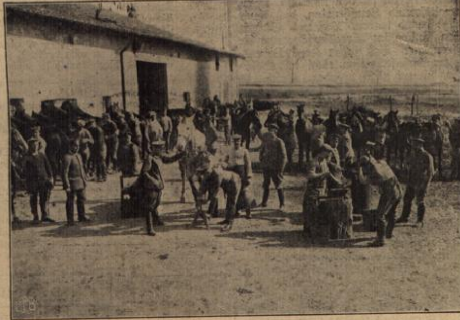
Leben und Treiben vor einer Feldschmiede an der Westfront.

In der Schlacht von Marathon, welche 490 v. Chr. geschlagen wurde, focht der Athener Kynegiros, ein Soldat des Griechenheeres, mit großer Tapferkeit und verfolgte den Feind bis an seine Schiffe, auf denen er die Flucht mit vollen Segeln ergriffen hatte. Einer kleinen Barke, in der ein feindlicher Offizier mit einigen Soldaten den Schiffen nachzukommen suchte, schwamm Kynegiros mit unbeschreiblicher Gewandtheit nach, ergriff dasselbe mit der rechten Hand, um das Boot umzukurzen. Als ihm diese abgehauen wurde, versuchte er dasselbe mit der linken, und als er auch diese verlor, faßte er das kleine Steueruder mit den Zähnen, tauchte mit seinen letzten Kräften unter, und das Fahrzeug, in dem alles sich zum Steueruder gedrängt hatte, um dem Wogehals den Todesstreich zu geben, schwankte um und begrub alle in den Wogen.