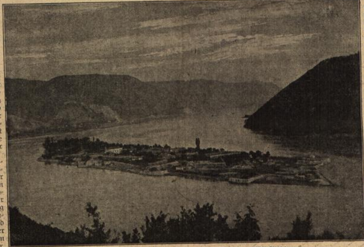
Der Schauplatz des Donauübergangs bei Orjova. (Mit Text.)

Ihm schwindelte jetzt bei dem Gedanken an seinen heißen und unbändigen Zorn und an seine fürchterliche Absicht. Er blickte dankbar zum Himmel, der inzwischen eine satte Wutrote annahm. Wie froh und glücklich mußte er sich fühlen, daß ein Mächtiger ihm nun in den