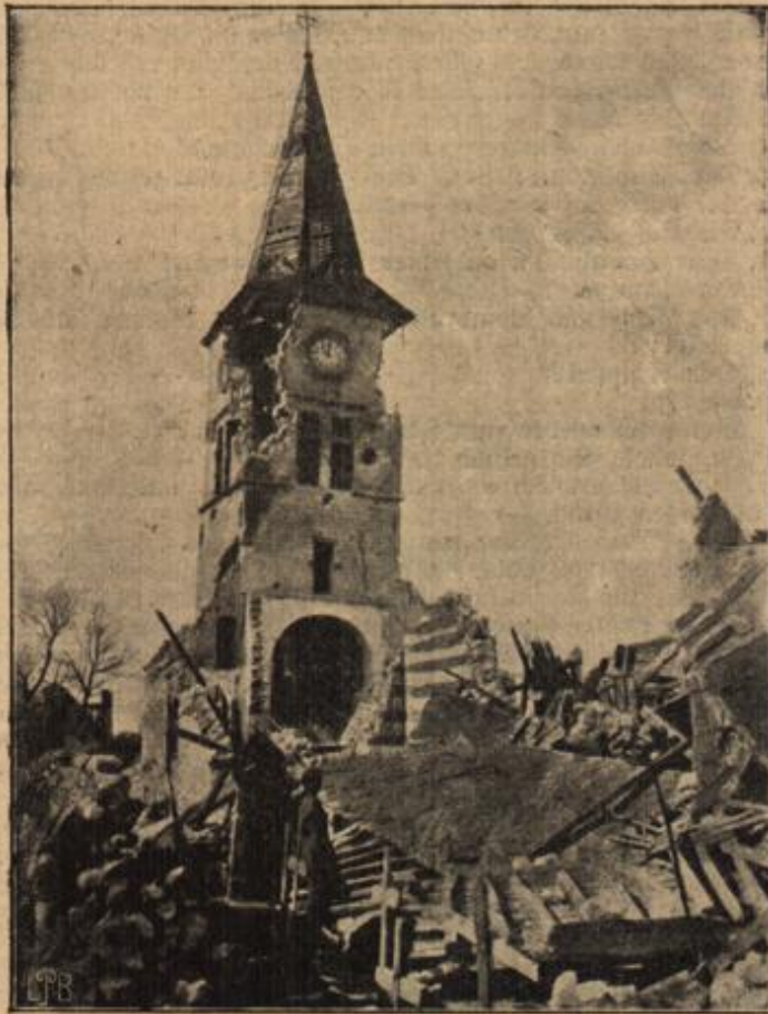
Die von den Franzosen und Engländern zerstörte Kirche von Tholus bei Arras.

sorgsam in Betten und Decken eingehüllt, ihr Schülking. Als Marie ihm nun aber gegenübersteht, verläßt sie all ihr schöner Mut. — Schüchtern streckt sie ihm nur eine rote Rose hin, die ihr