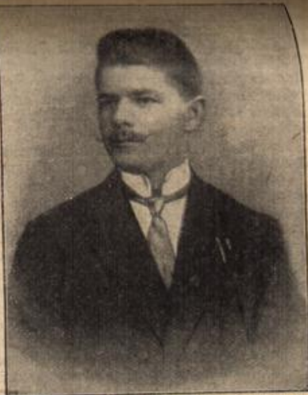
Das „Eiserne Kreuz“ für einen „Schipper“. (Mit Text.)

Der „Empire of Ireland“ durchjagt die glatte See, die wie ein Bogen Stanniolpapier glitzert. Hinter dem schönen Schiff zieht ein langer und breiter Schaumstreifen her. Hier weißchen die beiden Schrauben