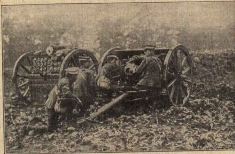
Englische Artillerie in Gefechtsstellung.

Beide Männer wenden sich nach der angeedeuteten Richtung. Dort, fast am Horizonte, hat sich das Meer einen trüben Schleier vor das Antlitz gezogen.