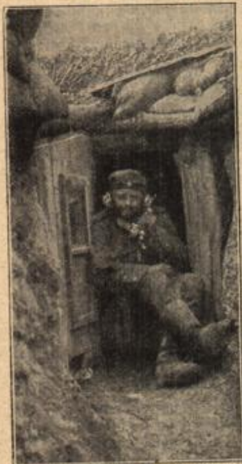
Telephonzelle im bombensicheren Unterstand.

„Ich habe Ihnen erzählt, was es heißt, wenn ein Mädchen einem Manne eine der teutschen Alpenblumen gibt.