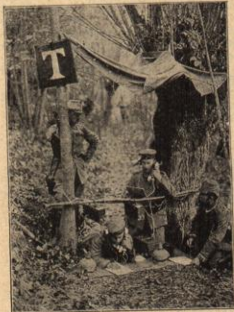
Vorgeschobene Telephonstation an den Klern der Aione.

„Was wird er nun von mir denken?“ fuhr es ihr durch den Sinn. „Wird er es nicht so deuten, als ob —“