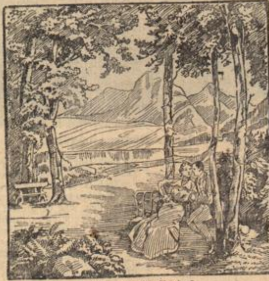
Wo ist die Uferschlichte?

Als Spargelpflanzen kaufe man aber ja nicht billige, kümmerlich entwickelte Pflanzen. Nur die Spargelanlage hat eine Zukunft, welche mit den besten, gesunden Pflanzenmaterial angelegt worden ist. Einjährige Spargelpflanzen haben sich bei allen seitherigen Versuchen als die besten erwiesen. Jetzt wird das für Spargel vorgezeichnete Stück Land in Beete abgeteilt. Die einzelnen Beete erhalten einen Abstand von 1,20 m von Mitte zu Mitte, die Pflanzgräben eine Breite von 30 cm, so daß die Zwischenräume noch eine Breite von 90 cm haben. Auf diese Zwischenräume wird die ausgehobene Erde gleichmäßig verteilt. In die Gräben werden die Pflanzen in Abständen von 60 cm gepflanzt. Die Stelle, an welcher eine Pflanze sitzt, wird durch ein Stäbchen gekennzeichnet. Nicht zu flach dürfen die Pflanzen gelegt sein, da sonst die Pflansen zu kurz werden. Doch dürfen die Gräben im ersten Jahre nicht schon vollständig zugeworfen werden, da den Pflanzen Luft und Licht vollständig entzogen würden. Man fällt deshalb im ersten Jahre nur etwa drei Finger hoch Erde darauf und schüttet erst im nächsten Jahre wieder Erde nach.