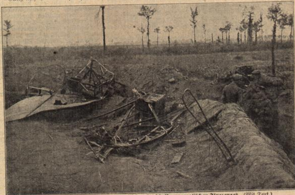
Trümmer eines von deutscher Artillerie herabgeschossenen englischen Flugzeuges. (Mit Text.)

hat sich das Meer einen trüben Schleier vor das Antlitz gezogen.