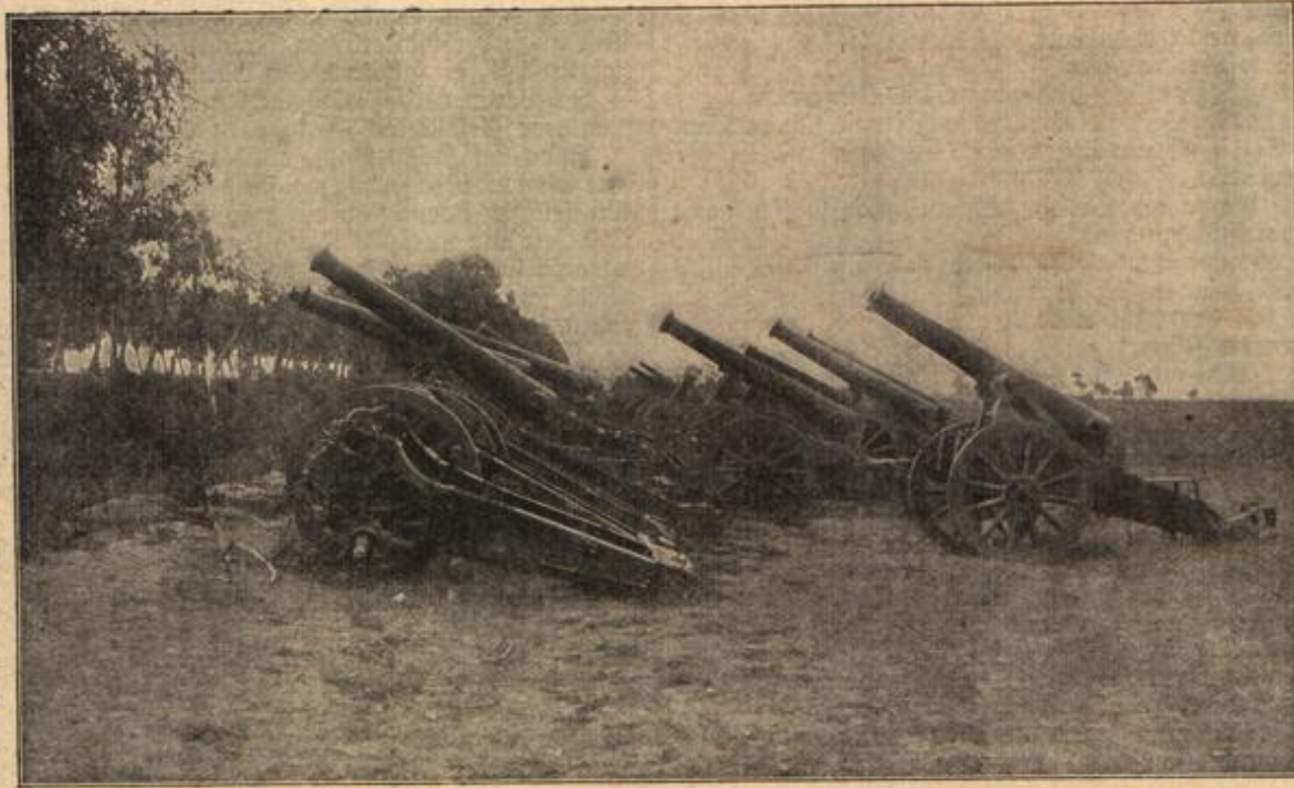
Kriegsbeute aus Przemyśl: Geschütze, die den Russen bei der Wiederoberung der galizischen Festung abgenommen wurden.