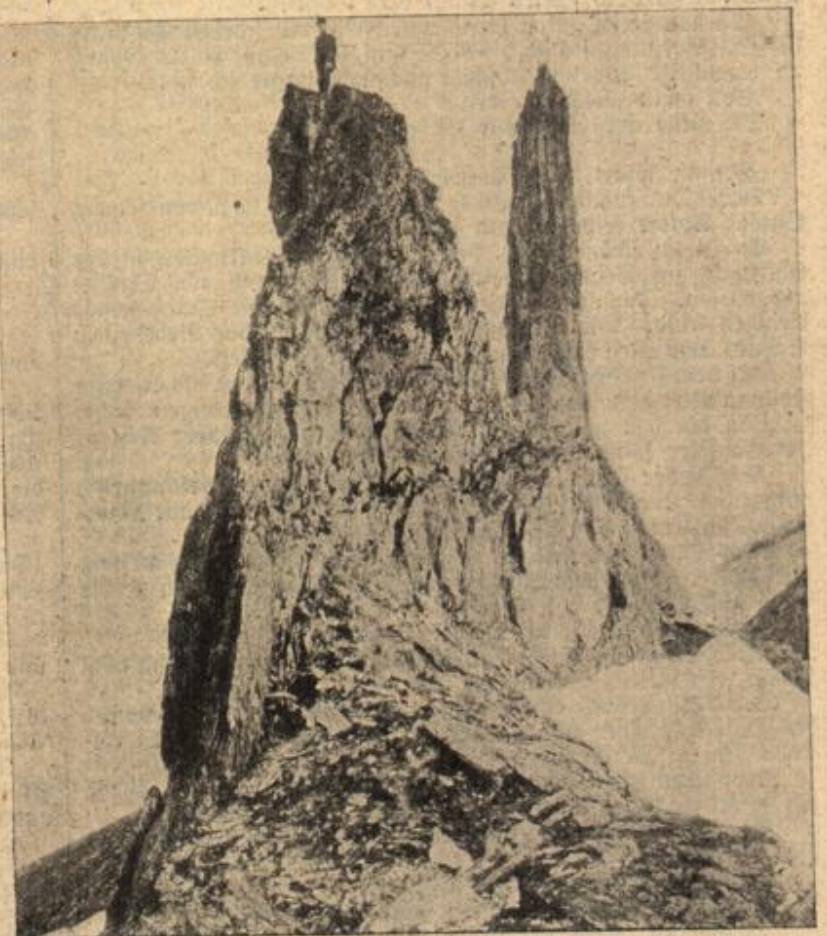
Schweizerische Grenzbesetzung: Eine Patrouille im Hochgebirge.

Am Ausschnitt ihres hellblauen Seidenkleides trug sie ein klei- nes Sträußchen Edelweiß. Bernd hatte es sofort bemerkt. — Sie dachten beide an den Tag, an wel- chem sie sich auf dem Kornfeld be- gegnet waren, und an dem er ihr die innige Be- deutung der teu- schen Alpenblu- me erklärt hatte, die Sage, die sich daran knüpft.