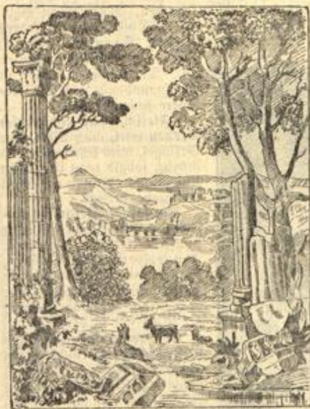
So ist der Hirte?

den Vorabend dieses kirchlichen Festtages, und es prägt sich gerade in dieser Feier die gläubige und leicht für zeremonielle Feierlichkeiten empfängliche Gemütsstimmung des Italiens aus. Das Volk hält an dem Glauben fest, daß Christus am Vorabend des Himmelfahrtstages vom Himmel herniedersteigt und die Ernte segnet. In der Campagna beleuchten die Hirten ihre Hütten, ähnlich wie die Bewohner der italienischen Städte ihre Häuser und Loggien, jede Veranda und jeden Balkon mit Lampions zu der gleichen Feier schmücken. Die Kirchentüren aber tragen als Schmud rotweißes Tuch