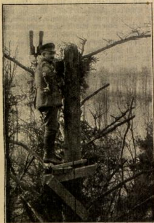
Scobachtungsposten der Artillerie.

Wir hatten bis dahin Wize gerissen, jetzt wurde mit einem