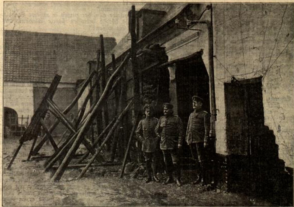
Der Sitz eines deutschen Regimentsstabs auf dem französischen Kriegsschauplatz. Die nach den gegnerischen Stellungen zu liegende Hausfront ist durch Sandsäcke gegen Granatfeuer geschützt.

„Sie scheint sich das Leben genommen zu haben.“