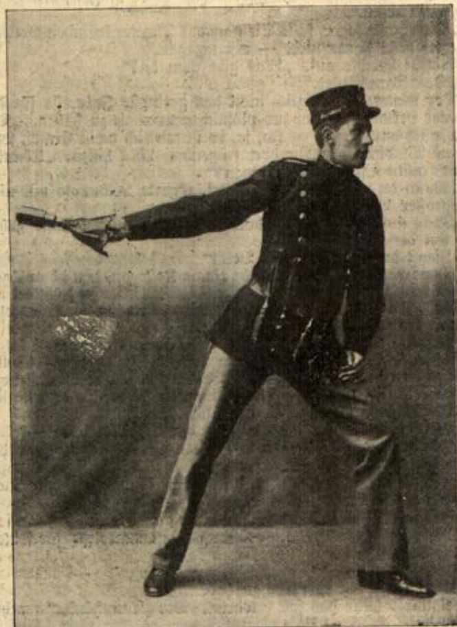
Handgranate. (Mit Text.)