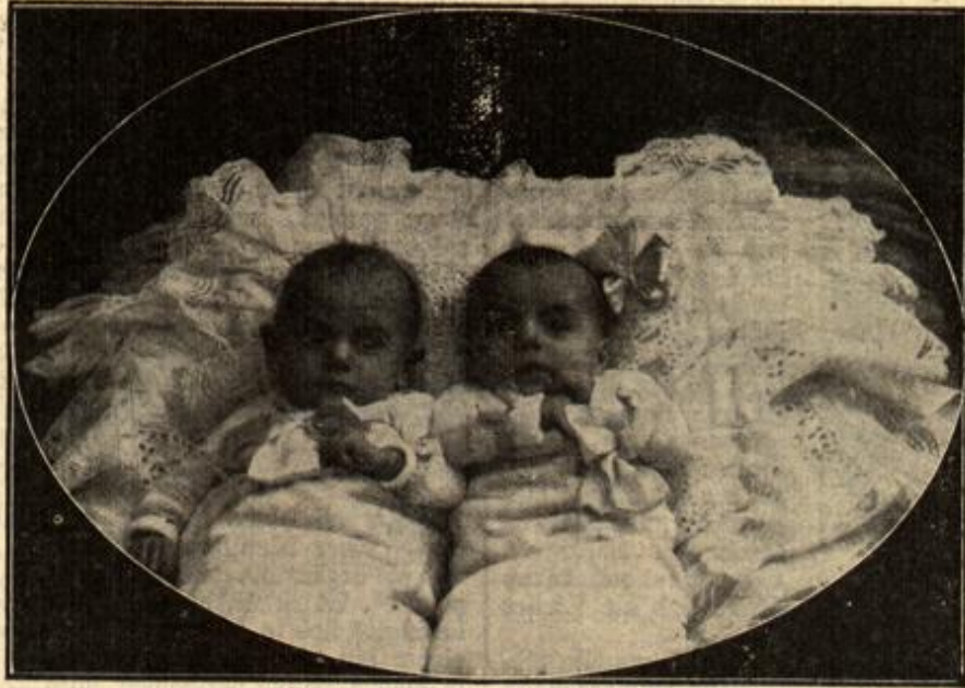
Väterchens Kriegsfreude. (Mit Text.)

Ein heizbares wohlverprobiantiertes Blockhaus auf dem westlichen Kriegsschauplatz. Über die Fortschritte, die die deutschen Soldaten im Laufe des Krieges auf dem Gebiet des Baues von Unterkunfthäusern gemacht haben, berichtet der schweizerische Oberst Karl Müller folgendes: Die Vereinstellungen sind große, gut ausgestattete, heizbare Blockhäuser mit Beleuchtungseinrichtungen. An der Verbesserung ihrer Bequemlichkeit und Innenausstattung wird, im Bestreben, Gesundheit und Wohlbefinden der Mannschaft zu fördern, fortwährend weitergearbeitet. Das Lagerstroh wird nach Möglichkeit erneuert und durch Strohstäbe und Papierschneibelfäden ersetzt. Unterstände und Blockhäuser sind ausnahmslos gut geheizt. Anher den von der Heeresverwaltung gelieferten Öfen findet man zuweilen aus Backsteinen und Lehm von den Mannschaften selbst erbaute Öfen, die sich ausgezeichnet bewähren. Aus den Wälden im Innern der Blockhütten kriechen jetzt, durch die Wärme getrieben, viele grüne Zweige und Blätter. Die Natur selbst sorgt so für den Innenschmut der Soldatenwohnungen.