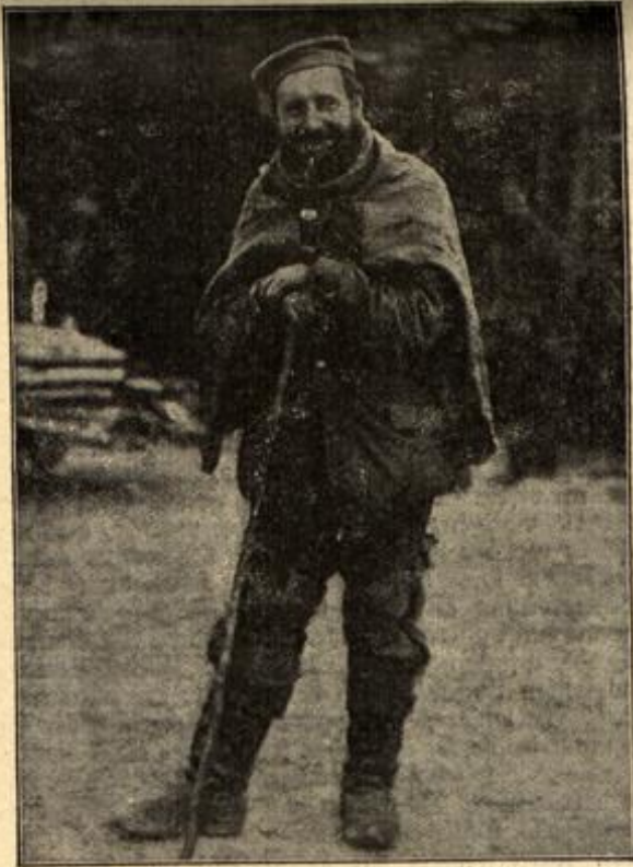
„Grad aus dem Schützengraben komm' ich heraus!“ Landwirthmann mit selbstgefertigten Winterumhang u. Antewärmern.

mit dem Regen in der Haut voran. Das befeuert auch den Boghaftesten. Solche Männer wiegen ganze Truppen auf.