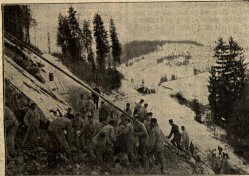
Schweizerische Truppen an der Grenze beim Herstellen von Strassen.

Und gleich darauf folgte das Sturmsignal in seiner hellen, aufreizenden Tonreihe. — Die Trommeln schmetterten zum Sturmangriff. Ein „Hurra!“ wie von Wahnsinnigen ausgestoßen, brach aus unseren Kehlen. In jedem hatte sich eine furchtbare Wut aufgespeichert, und wir alle fühlten es wie eine Erldung, daß wir nun heimzahlen konnten. Im Lausfchritte ging es nun gegen den feuerpeienden Hügel heran. Unsere Offiziere