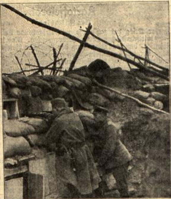
Sicherung der Schützengräben durch Drahtnetze vor Handgranaten.

Beim zweiten Erwachen lag ich in einem Lazarett und fühlte