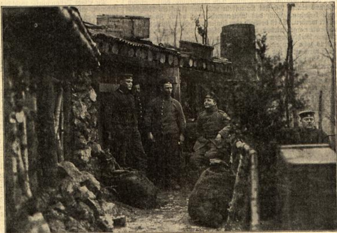
Heißbares, wohlverproviantiertes Blockhaus auf dem westlichen Kriegsschauplatz. (Mit Text.)