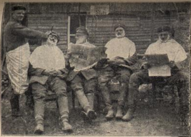
Der Verschönerungsrat im Schützengraben.