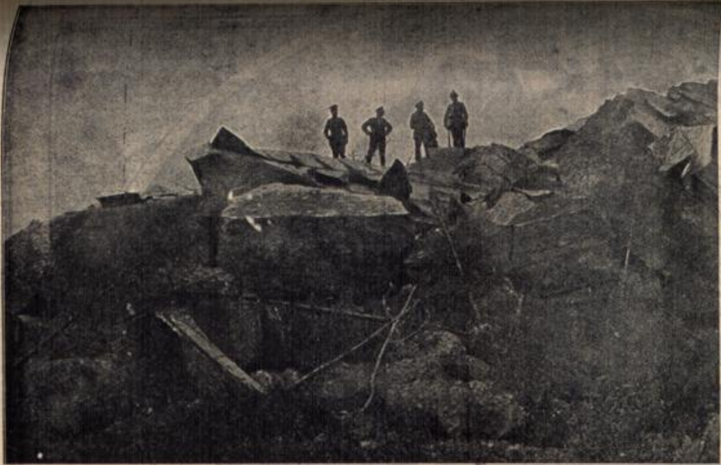
Fort XI von Przemyśl nach der Beschießung durch schwere Artillerie. Betonblöcke von 3 Meter Stärke sind geborsten und abgeplütert und gleichen zerstörten Sandburgen. Die Trichter der 42-Zentimeter-Geschosse weisen eine Tiefe bis zu 8 Meter und eine Breite bis zu 15 Meter auf.

„Für treu geleistete Dienste, steht da, Bahwett.“ „Kriegt ma da jetzt auch schon a Medallje? Und i hab alleweil g'meint, a Medallje krieg'n bloß die Veteranen und die General?“