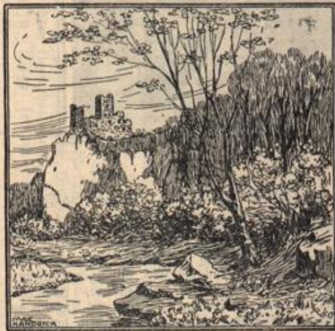
Wo ist der Forellenangler?

ischen Grenzstation; von da sind es nochmals 40 Kilometer bis nach Trient, kurze Entfernungen, denn der Schnellzug durchheilt die 143 Kilometer lange Strecke Verona-Bozen in kaum 4 Stunden. Von Mailand nach Verona erfolgt der Antransport der Truppen in 145 Kilo-