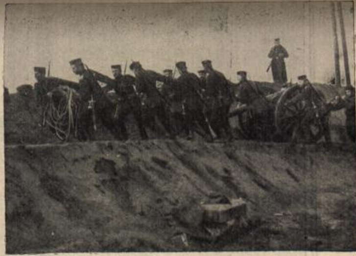
Aufstellung eines schweren Geschüzes in Flandern.