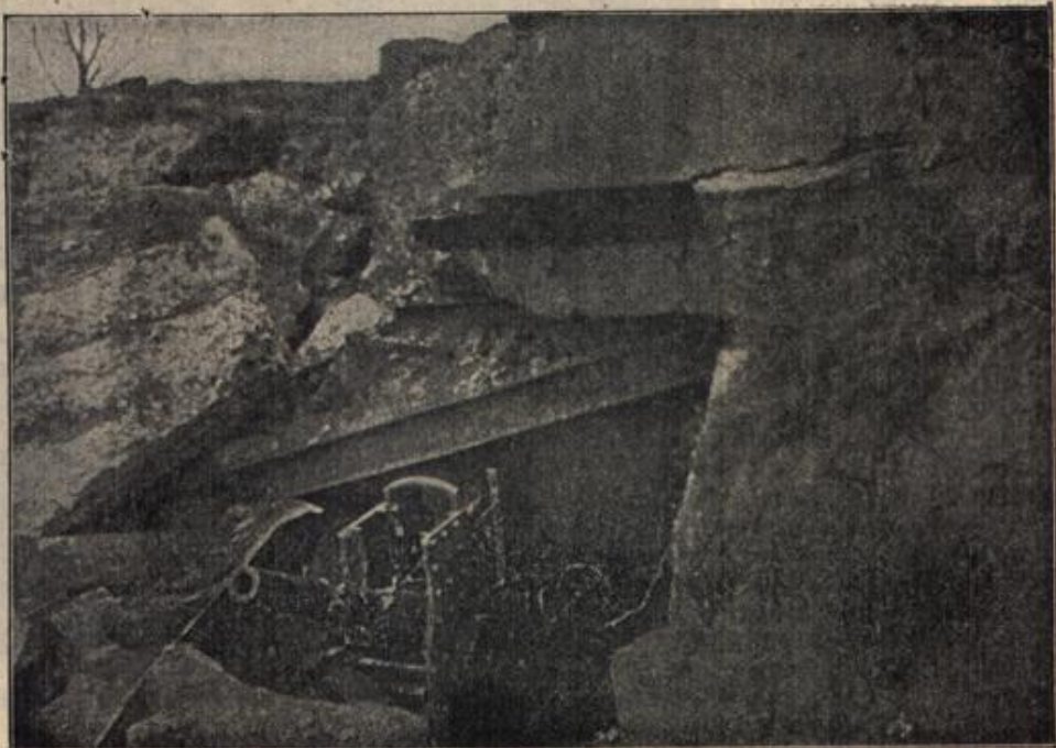
Ein von den Bayern ersticktes Nordfort von Przemyśl. Die russischen Befestigungen, die eine Gesamtausdehnung von 50 Kilometer hatten, bestanden aus kleineren und größeren Forts, die untereinander durch mächtige Schützengraben und sonstige Erdwerke, sog. gemauerte Kasernen, verbunden waren. Breite, meist in dreifacher Reihe angelegte Drahthindernisse sperrten nach allen Seiten den Zugang zu den Befestigungsanlagen. Nach einer Belagerung von vier Tagen war Przemyśl im Besitz der deutschen und österreich. Truppen.