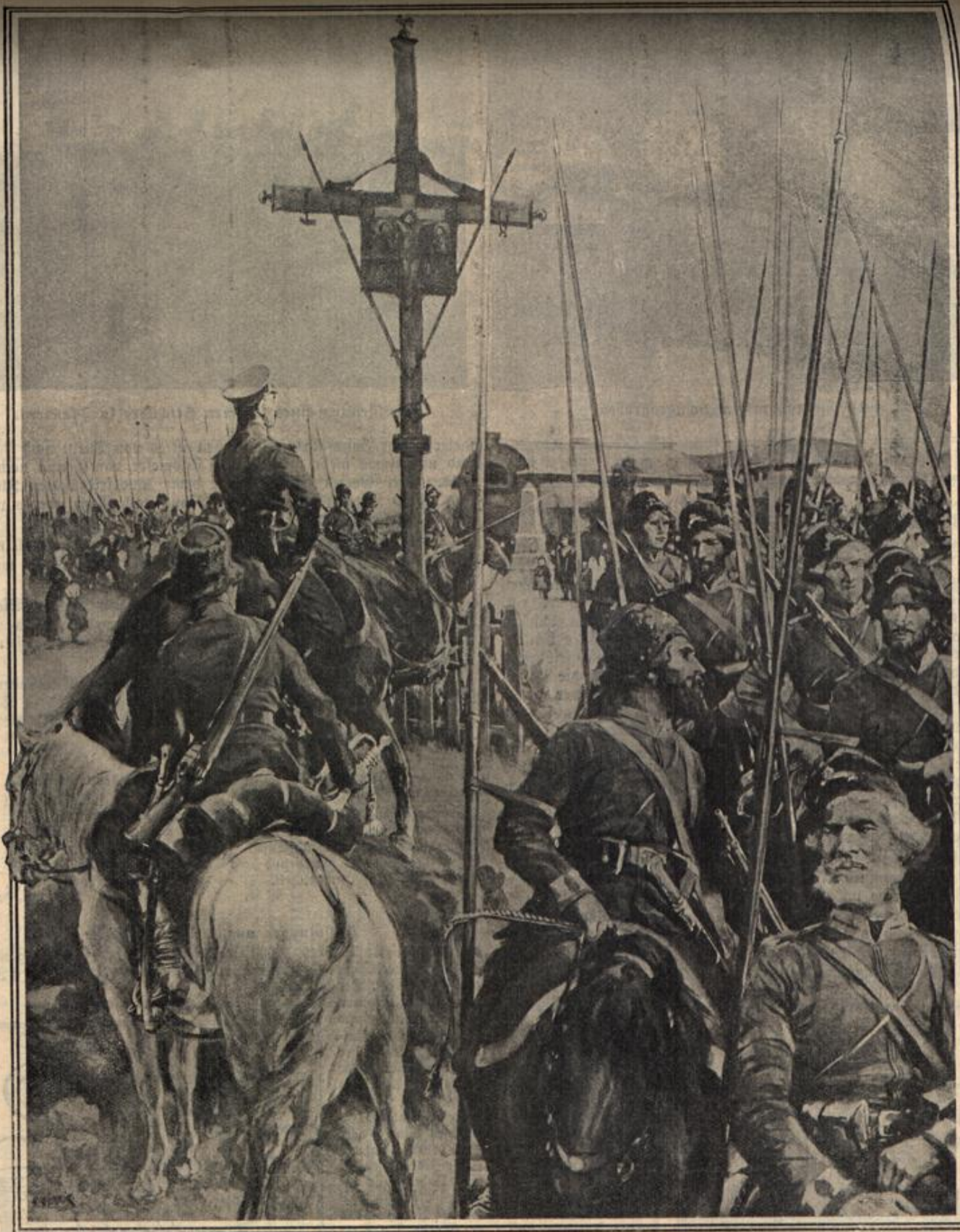
Kosakenhorden aus dem Ural.

Die russischen Kosaken (oder richtiger Kasaken) erfreuen sich im allgemeinen keines guten Rufes, denn sie haben sich, wie immer, so auch in diesem Kriege als uniformierte Nordbrenner erwiesen, wovon sowohl die von ihnen überfallenen Bewohner Ostpreußens wie die Galliens zu berichten wissen. Bezeichnenderweise bedeutet das Wort „Kosak“ im türkischen Sprachsatz so viel wie Straßenräuber. Bei den napoleonischen Feldzügen 1812/13 spielten sie eine bedeutende Rolle, war doch die Aufgabe, das in Auflösung begriffene Heer von allen Seiten zu umschwärmen, unablässig anzufallen und vollends zu vernichten, wie geschaffen für diese wilden, speertragenden Steppenreiter auf ihren struppigen, aber unglaublich anpruchstosen und ausdauernden Pferdchen. Für die offene Feldschlacht ist ihr militärischer Wert heutzutage nur noch gering anzuschlagen, dagegen stellen sie für den Klein- und Vorpostenkrieg ein recht brauchbares Material dar. Besonders hohe kriegsische Eigenschaften werden den Kaukosaken am Kuban nachgerühmt. Da sie sich zum Teil selbst verpflegen müssen und nur geringe Löhnung erhalten, be-