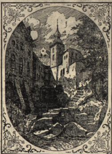
Wo ist der Schlossherr?

sich die ersten Veräufungserscheinungen zeigen, kommt die Hilfe in der Regel zu spät. Dem Genuße folgt in den meisten Fällen der Tod. Der giftige, häufig mit dem eßbaren Champignon verwechselte Knollenblätterchwamm hat weiße und weiß bleibende Blätter oder Lamellen