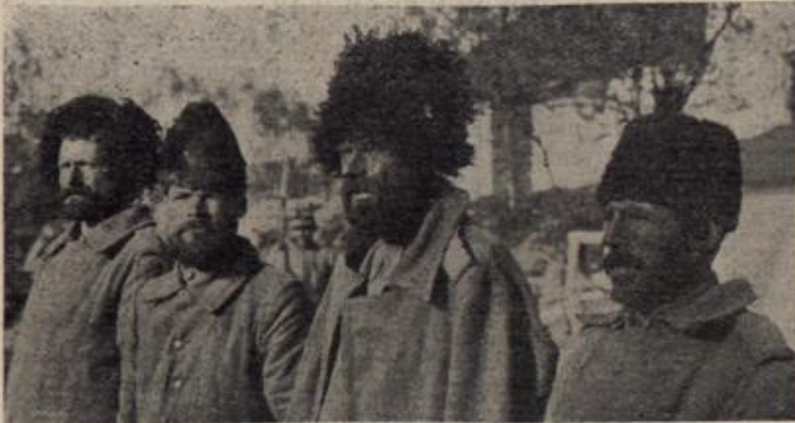
Gefangene Russen vor der Behandlung in einer Entlausungsanstalt.