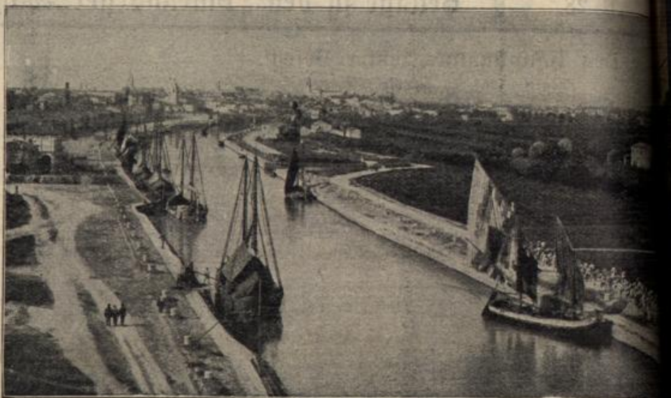
Blick auf den Kanal von Rimini und die Stadt, deren Beschließung durch die österr.-ung. Flotte den Krieg gegen Italien einleitete.