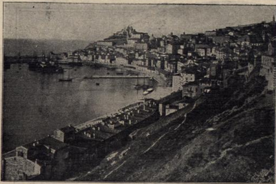
Ancona, an der Ostküste Italiens, das von der österr.-ung. Flotte erfolgreich beschossen wurde.

gemäß die Geschichte des Kleinods, das seit vierundvierzig Jahren so sorglich von ihrem Gatten gehütet wurde.