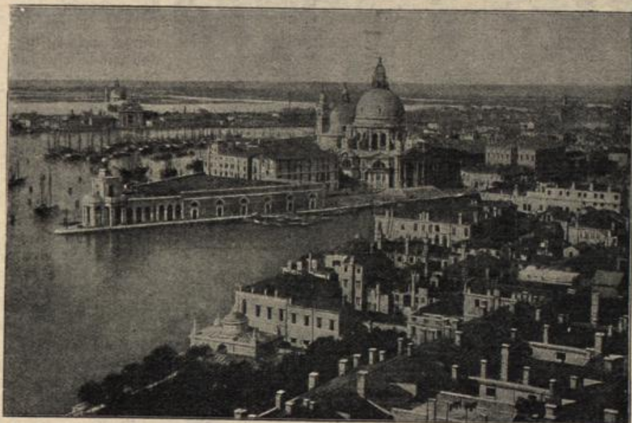
Gesamtsicht von Fiume, das von österr.-ung. Seesflugzeugen mit Bomben belegt wurde.

Die scheidende Sonne sandte ihre letzten Grüße über die Dächer der alten Mietskajernen der Mühlengasse. Sogar in Bertrams Kammerlein verirte sich ein zitternder, goldiger Strahl, huschte über des Kranken Bett, über sein eingefallenes Gesicht, und der zersorgten Frau, die mit gefalteten Händen am Fenster saß, war es, als fielen ein belobender Hoffnungsstrahl in ihr gequältes Herz: der alte Gott lebte noch, sein Auge schaute milde auf ihre Not. — Da Schritte im Flur, Stimmen. Zwei