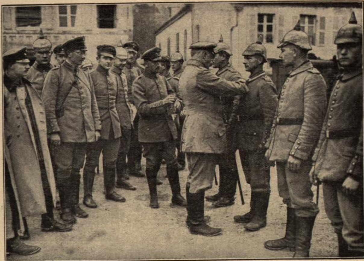
Unsere deutschen Helden werden mit dem Eisernen Kreuz geschmückt.

der Erde ist Spanien. Hier scheint die klare Sonne jährlich mindestens 3000 Stunden, in Deutschland nur 1800, in England nur 1400 Stunden. — In den Vereinigten Staaten von Amerika werden jedes Jahr 4000—6000 Kilometer neue Eisenbahnlinien gebaut. — In Korea, das jetzt zu Japan gehört, werden die Kleidungsstücke nicht aus einzelnen Teilen zusammengenäht, sondern zusammengeleimt, wozu man einen aus Fischen hergestellten Leim benutzt. — Sowohl im Polargebiet wie in den heißesten Tropengegenden behält das menschliche Blut seine gewöhnliche Temperatur von 37\frac{1}{2} bis 38 Grad Celsius.