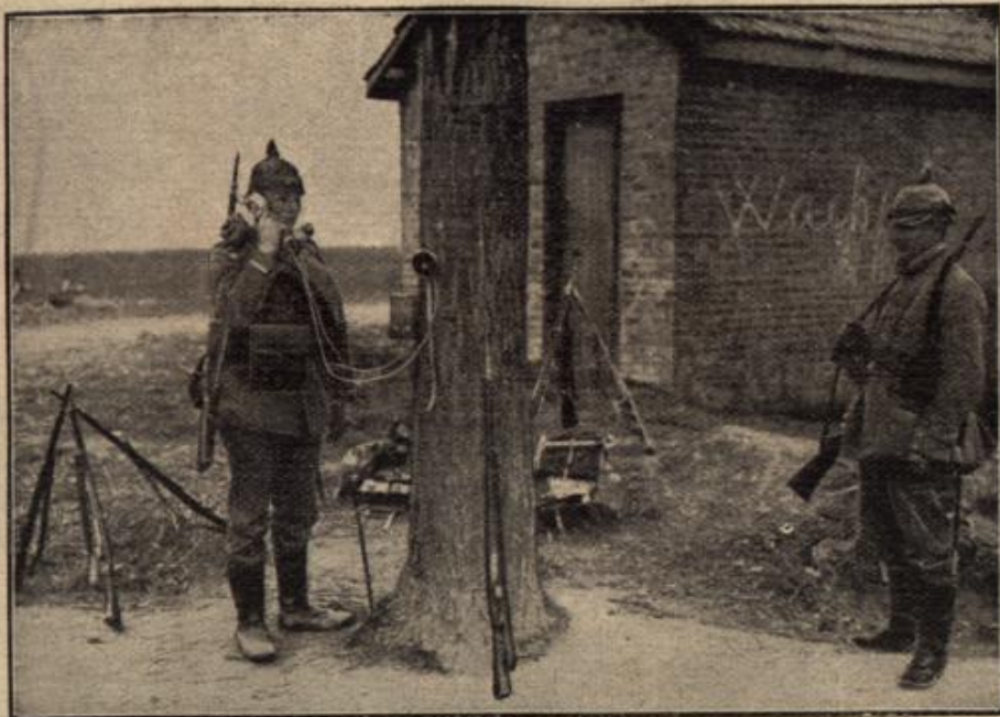
Ein Feldtelefon in vorderster Kampfesstellung.

Unser Bild zeigt ein schnell angelegtes Feldtelefon in der Nähe eines Wachpostens, das die Verbindung mit dem Oberkommando herstellt.