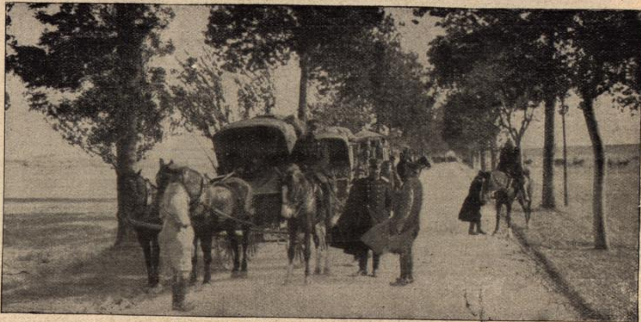
Deutsche Feldpost auf dem westlichen Kriegsschauplatz.