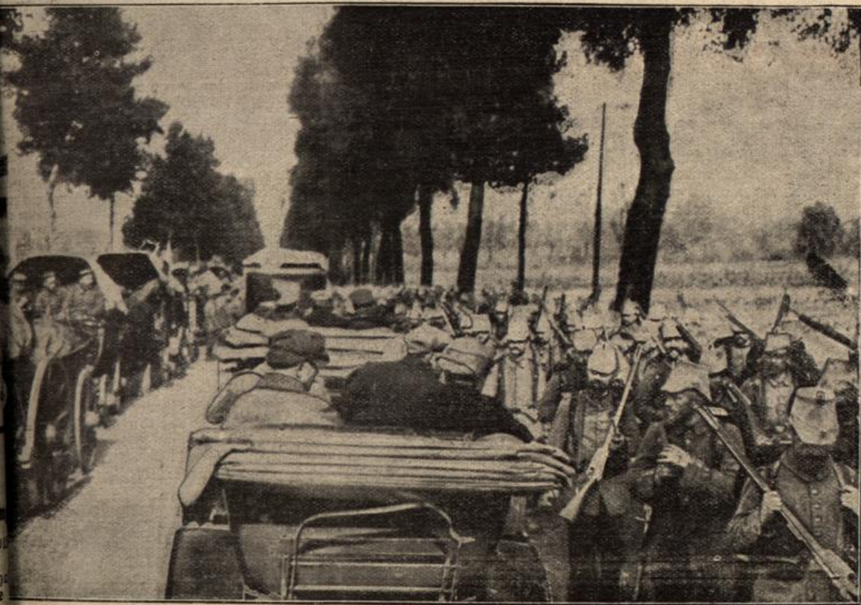
Vom westlichen Kriegsschauplatz: Verkehr auf einer Landstraße.

sagung, die nur das Glück des geliebten Kindes will, doch Jutta erschien die Mutter wie eine fremde Frau... Vielleicht wäre es anders gewesen, wenn Frau Magdalene sich nicht so geflissentlich von ihr ferngehalten hätte,