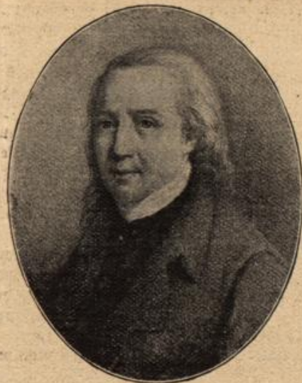
Matthias Claudius, geb. 17. August 1740 — gest. 21. Januar 1815.

Wenn das Grün des Sommers den Laubwald wie eine undurchdringliche Mauer längs des idyllischen