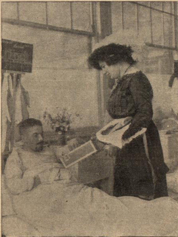
Es wird schon wieder besser werden!

Wie eine Soldatinnung werden. Eine alte Lüburgerin berichtet: 1674, als Bayern in der Festung legten, wurde von den Josen der Wall unter und gesprengt, wo Personen bayerischer sation umkamen. Meine angezündet, ist Soldatenweib in die jagt worden, eine Weite ohne Schaden gefallen, wieder auf und unverfehrt dargangen. Hat aber schimpft und ist arg Laune gewesen.