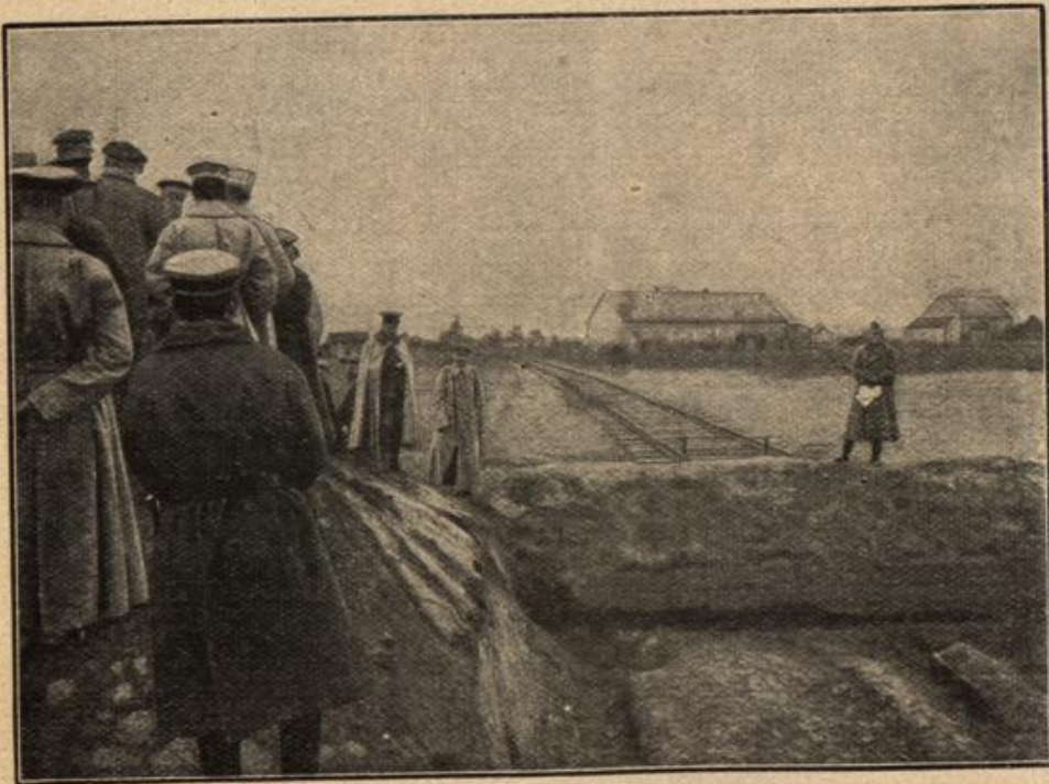
Standort eines 42-cm-Geschützes während der Beschießung von Antwerpen. Die gewaltigen Mörser werden auf Geleisen nach den vorher fertig gestellten, mit starken Betonfundamenten versehenen Standorten gebracht. Nach drei Tagen sind sie dann schußbereit.

„dicke Marie“, „dicke Barbara“ usw. Seitdem der erste hohenzollernsche Fürst in der Mark gegen die Zwingburgen der Quirkows die bekannte „faule Grete“ hatte auffahren lassen, die freilich sehr fleißig gearbeitet, aber wegen ihrer schweren Be- weglichkeit den angeführten Beinamen erhalten hat, müssen sich gewöhnlich alle übermäßig großen Geschütze die Bezeichnung „faule Grete“ gefallen lassen; in Berlin hieß so bis zum Jahre 1870 die im Zeughaufe aufbewahrte, zum Geschlecht der Mauer- brecher gehörende Lübecker Karttaune, jetzt gilt der im Kastanien- wäldchen aufgestellte, vom Mont Valerien bei Paris stammende „Bullerjahn“ im Berliner Volksmunde als „faule Grete“. — In- zwischen hat die Bezeichnung „dicke Berta“ für das neue große Geschütz auf der ganzen Linie des westlichen Kriegsschauplatzes gefestigt.