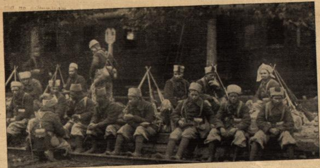
Frankreichs asiatische Helfer: Indische Truppen in Winterausstattung.

gewesen, und der Garten mit dem halbversumpften Teich hatte in Blüte gestanden, und eine verspätete Nachtigall hatte in der Lindenallee geschluchzt. . . Die kahlen Zimmer hier mit den abgenutzten Tapeten, den Fußböden, die sehr lange keinen frischen Anstrich gesehen, hatten so viel Familienglück umschlossen. Ein fallender Baum hatte es zerstört. . .