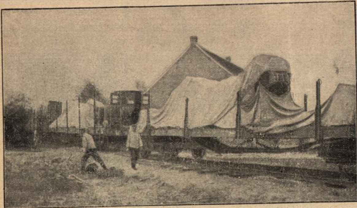
Beförderung eines zerlegten Kruppischen 42-cm-Geschützes nach einem neuen Standort in Feindesland.