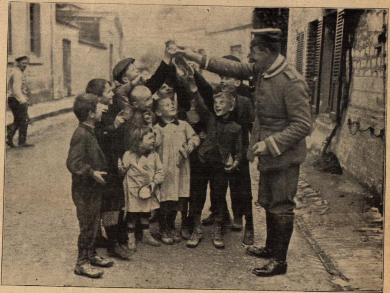
Ein Feldgrauer verteilt an hungrige französische Kinder Brot.