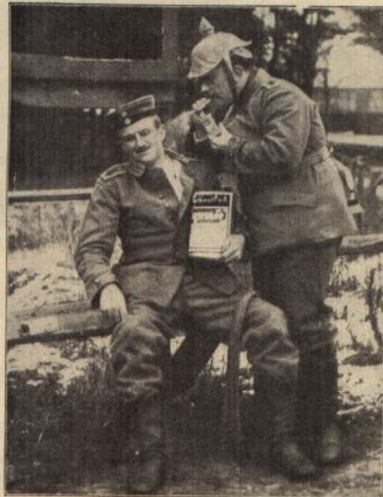
Im Kampf mit russischem Angezieser. (S. 56)