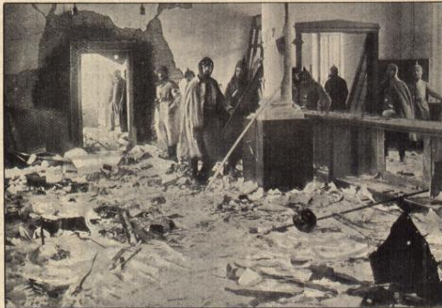
Die von den Russen verwüstete Bank von Pflthal. (S. 56)

„Um halb fünf wird eine Droschke vor der Tür stehen.“ Anne sah, wie Frau Treffow ein Paket unter ihrem weiten Mantel hervorholte und auf die bunte Plüschdecke legte. „Sie dürfen nicht erkannt werden. Hier sind einige Kleinigkeiten, die Sie anziehen werden. Auch Schminke ist dabei. Damit wissen Sie ja von früher her Bescheid. Diese Sachen bleiben in dem Wagen, der Sie hierher zurückbringt. Was ich von Ihnen verlange, ist, daß Sie im Geschäft das Kassabuch und das Hauptbuch der Person übergeben, die Sie schon im Wagen vorfinden werden. Weiter nichts.“