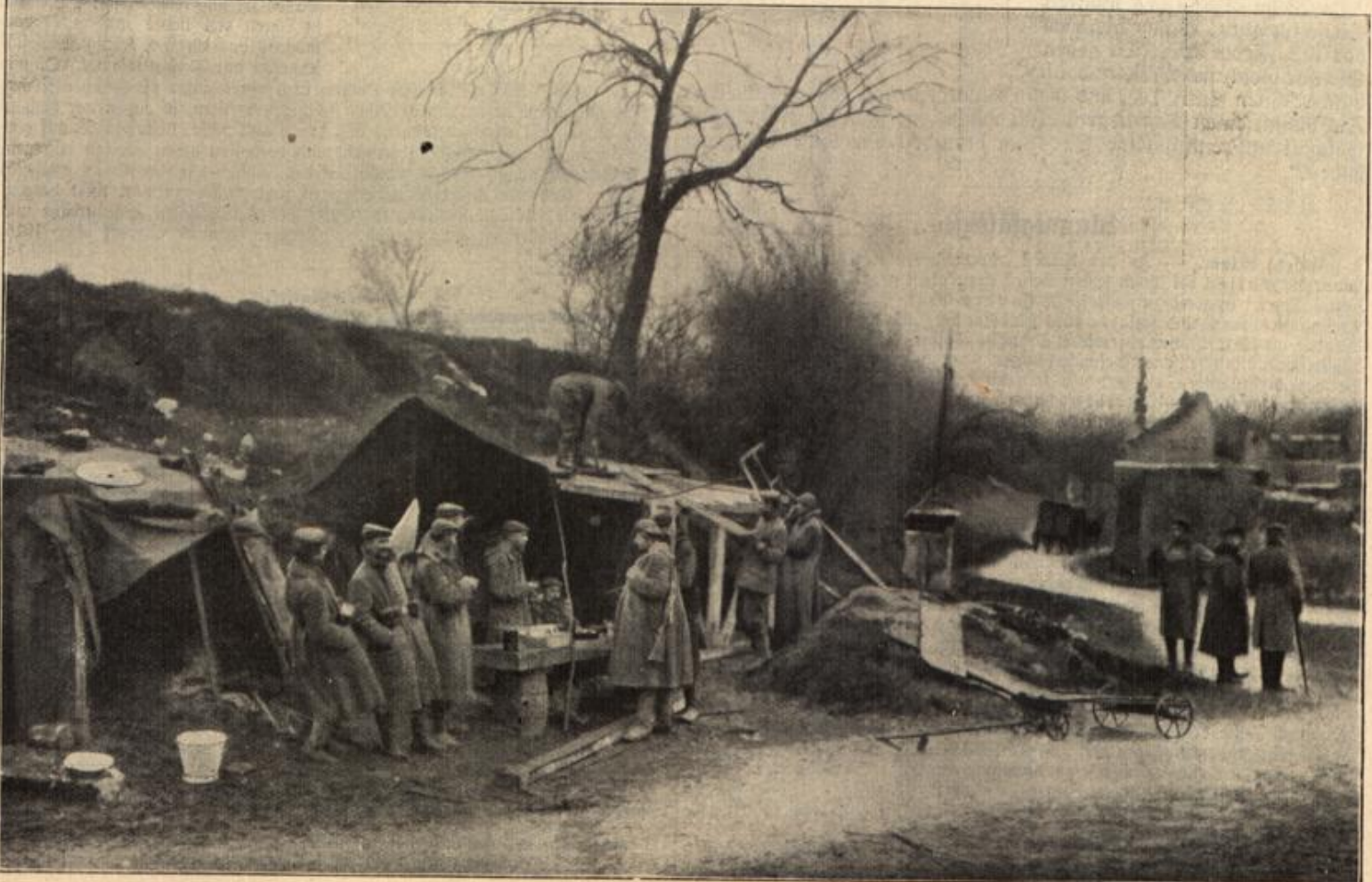
Beim Bau von Unterständen (westlicher Kriegsschauplatz). (S. 56)