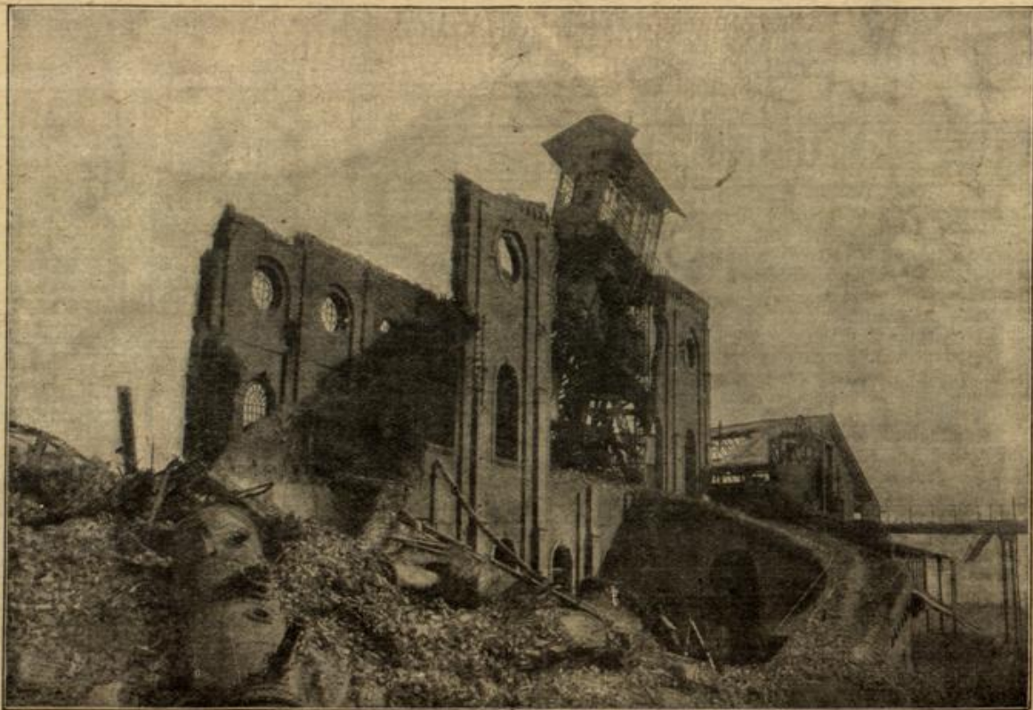
Wie die Engländer die als Konkurrenz für sie in Betracht kommenden Kohlenzechen in dem französischen Becken von Lens systematisch zusammenschleßen.

„auf möchte ich nicht sagen,“ sagte der Pfarrer, „das klingt — für deine Zukunft gar zu trostlos. Du hast Bitteres aber das menschliche besitzt die Fähigkeit, sich auf dem wieder eine aufzubauen. Welche Täuschung darf gleich ganz und glauben verlieren; daraus Gewinn kläuterter daraus n. Die Prüfungen das Schicksal über uns, müssen unsere Kraft stärken; sie sind wie den aus neu erstandenen zu geboren werden. Du darfst mit