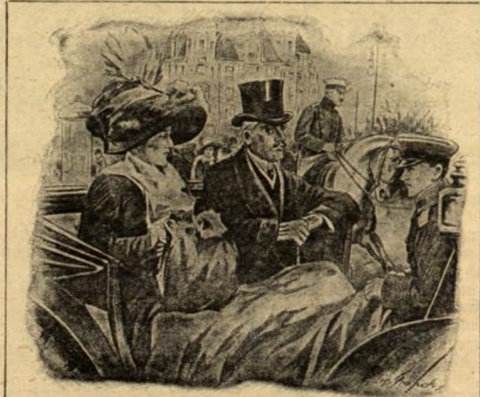
Naiv. „Hinter und reitet Leutnant von Denuitz, Männchen! Hast du übrigens nichts bemerkt, der scheint ein Kluge auf unsere Elga geworfen zu haben?“ „Ja, und das andere auf meinen Geldsack!“

„Ich habe ihm nur auf ganz weise Weise sein Spiegelbild vorgehalten.“ „Das kann ich mir gut vorstellen,“ lachend der Monarch. „Aber sorgt, er soll dir nichts antun.“ „Aber er würde es dennoch, so ließe ich ihm Viertelstunde nachher am nächsten oder Laternenpfahl aufknüpfen.“ „Sire,“ schlug da der wichtige Hofnarr vor, „möchten Sie ihn nicht in Viertelstunde vorher aufknüpfen?“ Der König lachte. „Aber selbst in der selben Stunde noch befahl er Triboulet, seinen Hofnarren ungeschädigt zu lassen, wenn ihm sein Herr nicht zu nahe sei.“ Der Befehl wurde befolgt.