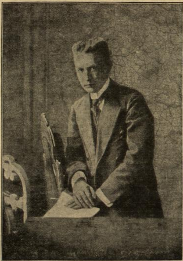
Alexander Feodorowitsch Kerenski, vielgenannter Kriegsminister der neuen russischen Regierung. (Mit Text.)

In der nächsten Minute wäre vielleicht alles zu meinen Gunsten entschieden gewesen. Da — ein sporenklirrender Tritt, ich hatte ihre Hand freigegeben, und der Major trat ein. Er schien mit einem Blick die Situation zu umfassen, ein Blick seiner Augen verriet es mir. Sonst war sein Benehmen höflich und liebenswürdig wie stets. Ich verwünschte dieses Dazwischenkommen in meinem Herzen, aber es war zugleich so von Glück und Freude erfüllt, daß ich mich auf morgen verträufelte und, als auch die Präsidentin und noch mehrere Besucher sich einfanden, mich mit der Ausflucht von notwendig zu erledigenden