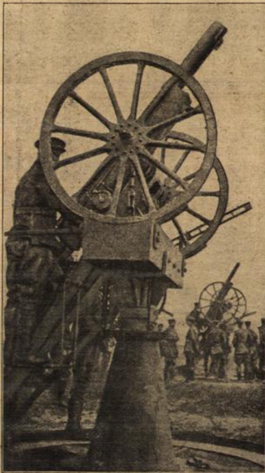
Englisches Flugabwehrgeschütz auf drehbarem Fuß montiert.

Eine Weile hatte sie so gefesselt, dann erhob sie sich und trat