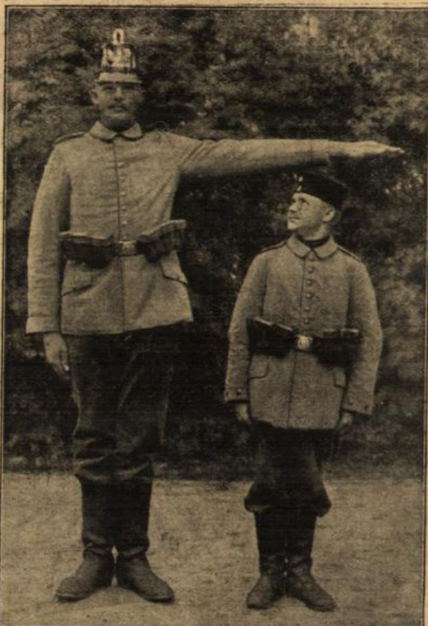
Groß und Klein gefellt sich gern. (Mit Text.) (Benj. Gen. (Gen.))

Helmut schüttelte mit trübem Lächeln den Kopf. „Ja, du bist ein starkes, braves Mädchen, du würdest das wohl auch können. Aber mir fehlt dazu die Energie und Ausdauer, ich würde bald erlahmen in dem kleinlichen Lebenskampfe.“