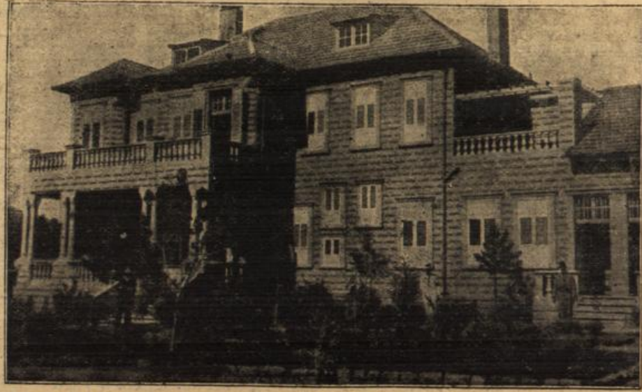
Das deutsche Konsulatsgebäude in Haifa in Kleinasien, das während des Krieges vollendet wurde.

Noch ein leises Neigen ihres Hauptes . . . dann verließ sie stolzer Haltung das Gartenhäuschen und bald war sie im Garten verschwunden, die Tränen waren halb verdunstet.