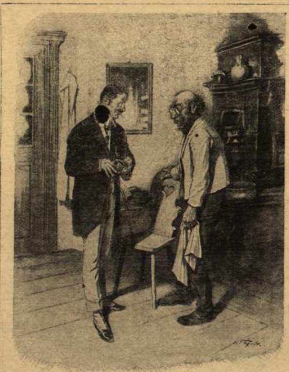
Übung macht den Meister. „Bin ganz erstaunt, Meister, daß Sie meine Haare so tadellos schneiden konnten; ich dachte, Sie hätten doch gar keine Übung darin?“ „Ja freilich, linst mir mehr, wo i doch alleweil an Wirt keine dreihundert Schafe scher'n muoß!“

Das Legen von Linoleum auf Fußböden ist nur dann empfehlenswert, wenn es sich um altes, gut ausgeglichenes Holz handelt. Bei Neubauten oder gelegten Fußböden ist Gefahr vorhanden, daß das noch feuchte Holz unter dem Linoleumabschluss in Fäulnis übergeht.