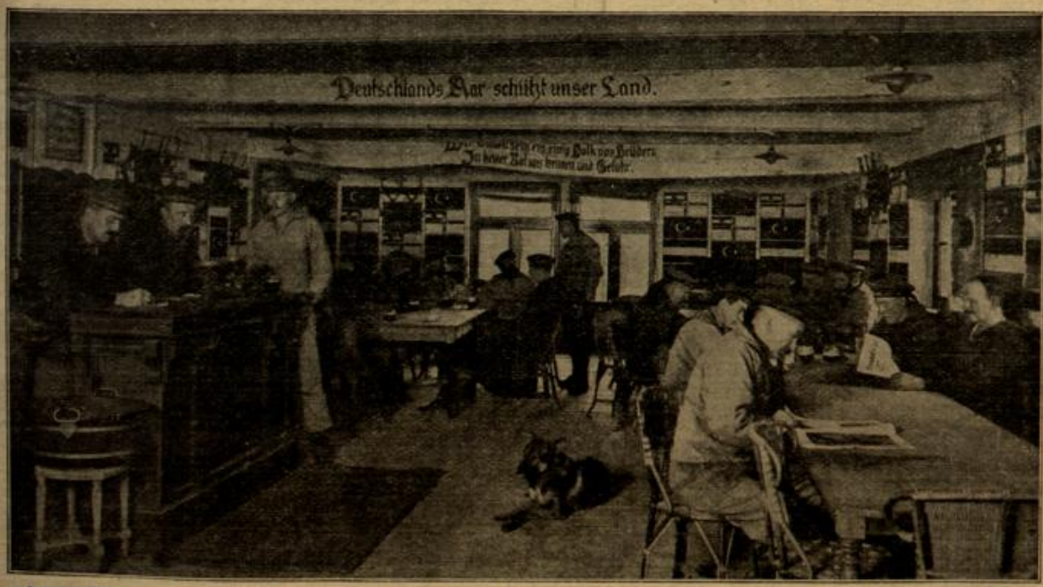
In den flandrischen Dünen: Ein ehemaliger Pferdestall, von dem deutschen Marinekorps als Mannschaftslantine eingerichtet.

wegen eines Vergnügens, dem du dich vielleicht nicht mehr hingeben kannst, während die Zukunft ganz anderes von dir verlangt. Du bist nicht allein. Agnes und Mia bedürfen deiner mehr denn früher. Für sie wirkst du jetzt im eigentlichen Sinne