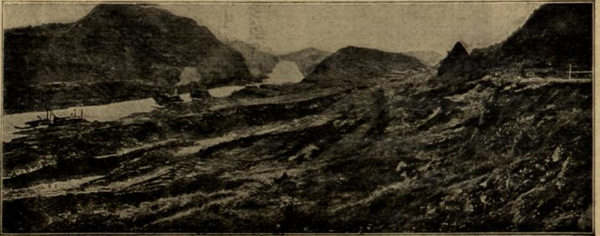
Die Gefährdung des Panamalanals. (Mit Text.)

Christian und Agnes war mit Ausnahme der Einrichtung freilich nichts übrig geblieben. Die vielen Jagdtrophäen und die Gewehre waren Christian überlassen worden. Nun verbrachte er manche