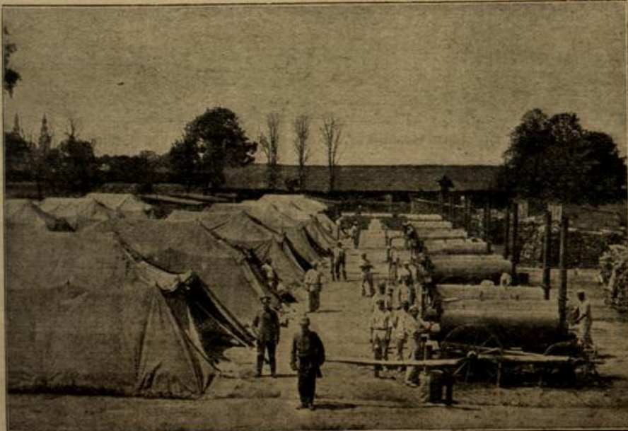
Eine deutsche Feldbäckereitonne.