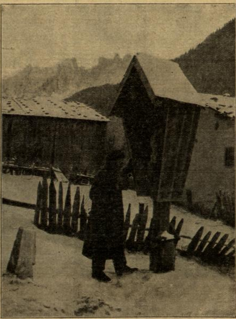
Von der österreichisch-italienischen Front: Tiroler Landsturmman im Gebet.

fache von dem, was ihr gezahlt habt. Junge, laß den Kopf nicht hängen, es wird und muß auch ohne Jagd gehen.“