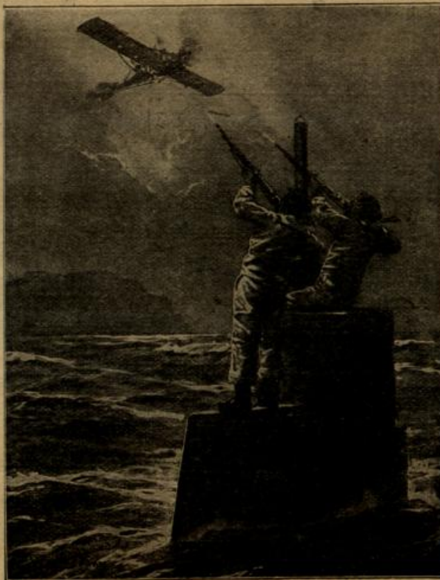
Abwehr eines englischen Fliegerangriffs durch die Besatzung eines deutschen Unterseebootes.

Das eine, und das hatte er auch meisterhaft verstanden, den Anschein zu geben, als ob das Schiff unentwegt nach wie vor gute Fahrt voraus mache, von gleich sicherer Hand, wie seit Jahrhunderten von den Vätern gesteuert. Es kam der Zusammenbruch seiner eigenen Frau genau so überraschend, wie dem letzten Bewohner von Waldburg. Lange blieb das Ereignis