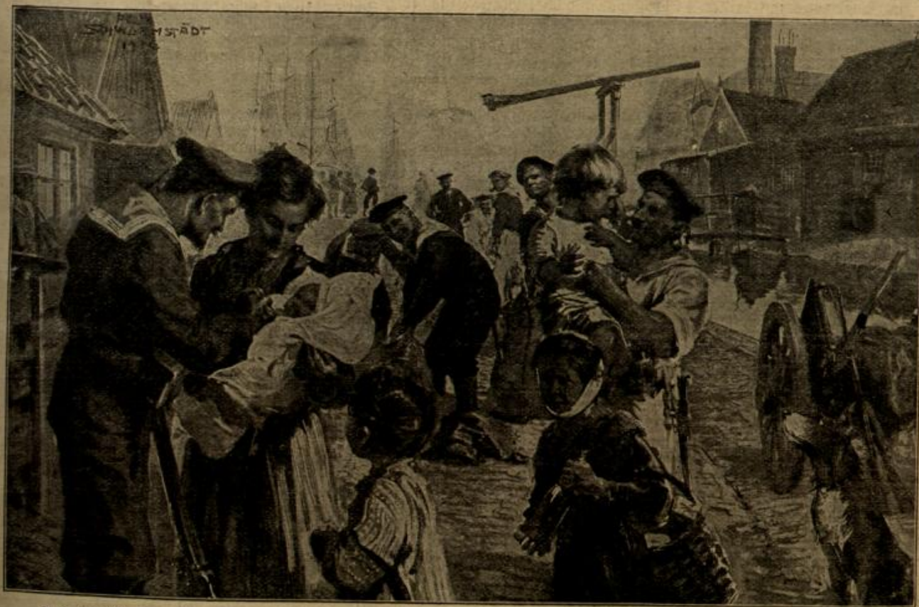
Das gute Einvernehmen zwischen den deutschen Besatzungstruppen in Belgien und der einheimischen Bevölkerung: Deutsche Matrosen während des Aufenthaltes in einem Küstenort an der belgisch-holländischen Grenze. Nach der Schilderung eines Augenzeugen gezeichnet von Felix Schwarzstadt.

suchte er, es ging, den Tat- abzu- Das Ge- mess- te sich er- War es mit des als gewe- daß ein ines Ra- ihm ver- blieben? rafft sei- schlechts u Ende, braucht, te einem m Die- ter wo- nen so- voll die lften. für Se- stark die arter und sein ristian. lähmte. Er unheim- des dunkles Waldb- troch en wo- das mit nefe Hän- den seinem Zwie- langte, r W- die ochwol-