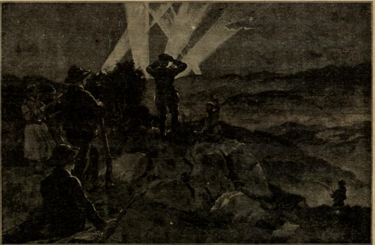
Wachen zur Beobachtung von Fliegern auf den Höhen des Schwarzwaldes.

Zu beiden Seiten des Obertales dehnten sich viele hund-