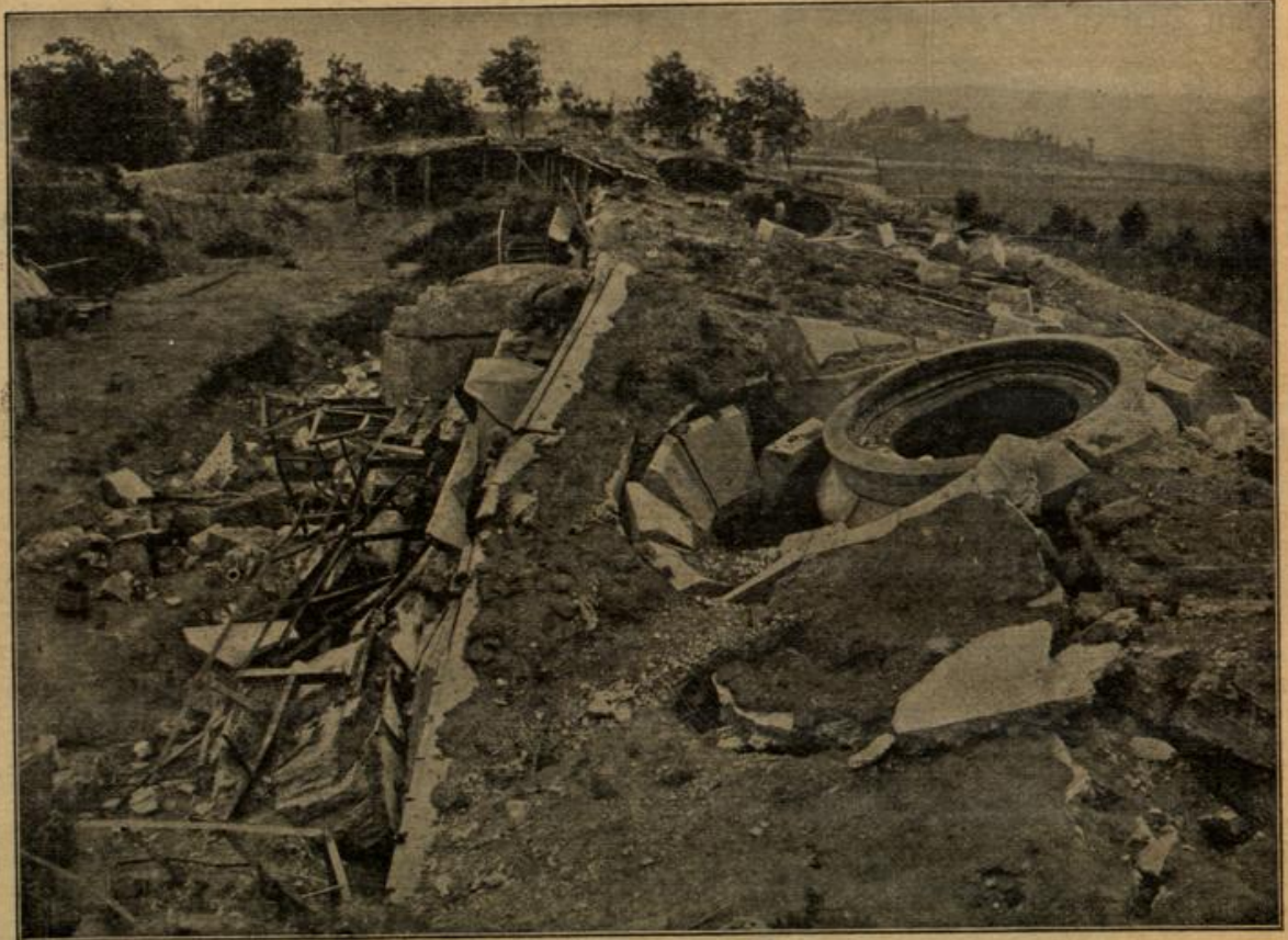
Die Wirkung der deutschen und österreichisch-ungarischen schweren Geschütze an der Donau: Die Überreste einer serbischen Donaubefestigung.

Es war nach Mitternacht. Fünf Reisende stiegen aus.