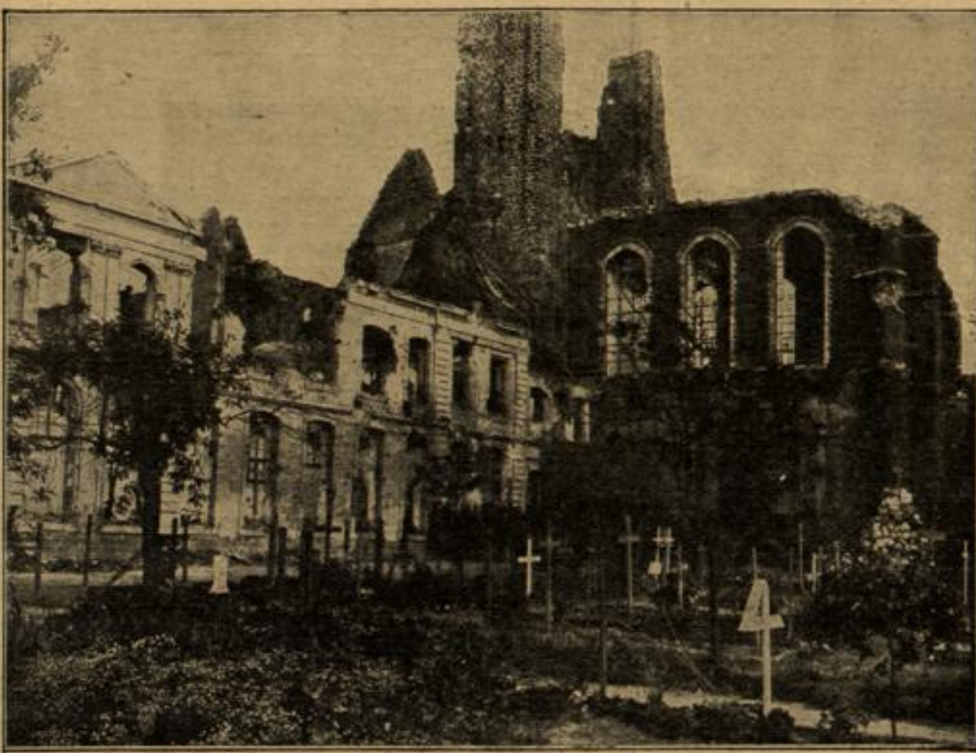
Das zerstohene Kloster Meßines. Im Vordergrund deutsche Soldatengräber.

lich, daß er, um nicht vor Steifigkeit umzusinken, eine Stütze an dem Soldaten suchte, der hinter ihm stand. Denn er befand sich in der letzten Reihe, und zur Bedeckung war ringsum hinter