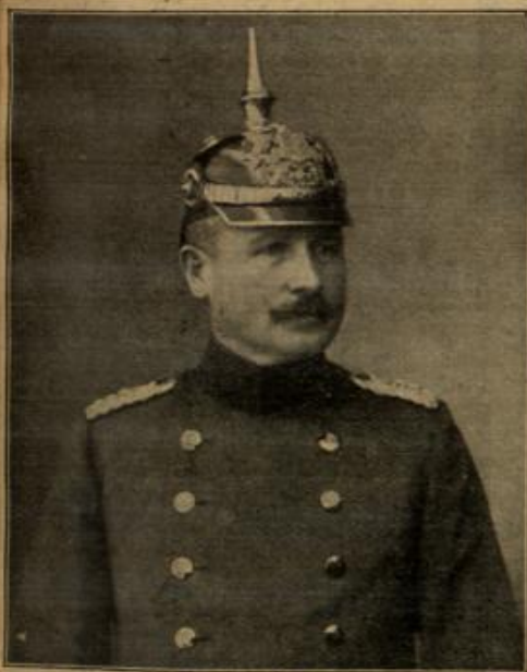
Generalmajor Dr. v. Gröner. (Mit Text.)

"Das werde ich gern tun — ich danke Ihnen bestens für Ihr Vertrauen. Jawohl, Sie haben recht, das Publikum möglichst zurückzuhalten. Aber ich bin wirklich zum Plagen gespannt, was da schließlich sich zeigen wird." (Schluß folgt.)