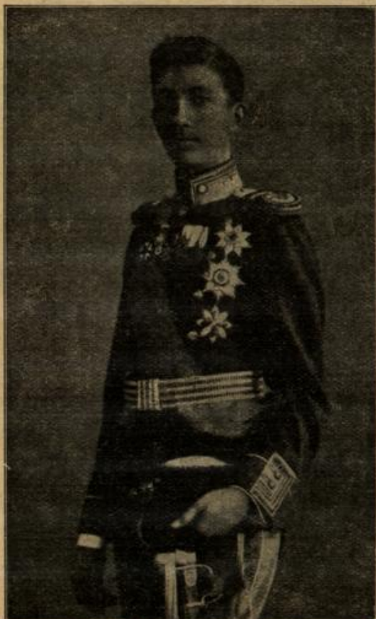
Boris, Aronprinz von Bulgarien.

selbst gefertigte Angebinde zu zeigen und die vom Geiste echter Poesie getragene Widmung vorzulesen. Wenn ich damit gegen den Willen der gnädigen Frau verstoßen habe, so tut mir das ja herzlich leid!"