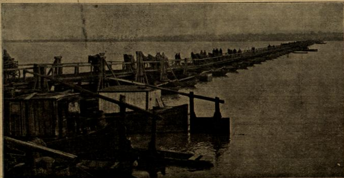
Der Übergang über die Donau. (Mit Text.)

"Bin ganz damit einverstanden, Herr Doktor — vollständig einverstanden!" versetzte die Baronin mit süßsaurem Lächeln. "Mit der Angabe der wirklichen Tatsachen wird allen vagen