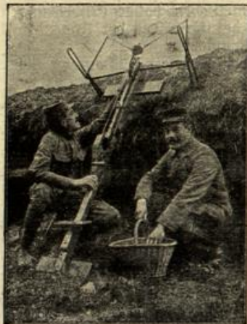
Armburst zum Granaten-Schleudern. Französische Photographie.

zu liegen scheint. Das Mitleid mit der vor ihr Sitzenden, auf deren bleichen Zügen der Schmerz noch tiefere Falten zog, überwog aber endlich doch alles andere. Wie mußte dieses Mädchen Nacht für Nacht durchgearbeitet haben, um mit dem Verdienste ihrem Liebsten den Weg zu einer angesehenen Stellung zu ebnet.