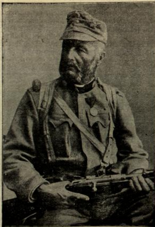
Der älteste Tiroler Standschütze. (Mit Text.)

Bei heiterem Geplauder verging das Essen, bei dem der alte Christian, der vollständig wieder auf seinem Posten war, bediente. Notar Wendland neckte Paula, ob sie nicht bald Holmsberg einen Herrn geben wolle. Sie wehrte lachend ab, konnte aber ein leises Erröten nicht verhindern, das der Notar und Christian schmunzelnd bemerkten. Nach dem Mahle ging Notar Wendland zum Büfett,