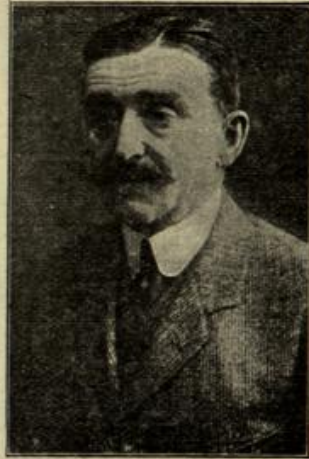
Fürst Bożisław Lubomirski, der in letzter Zeit vielgenannte, von der deutschen Zivilverwaltung eingesetzte Stadtpräsident von Warschau.