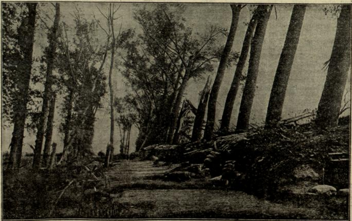
Flandrische Allee mit französischen Unterständen am Ufer des Dierkanals bei Boesinghe.