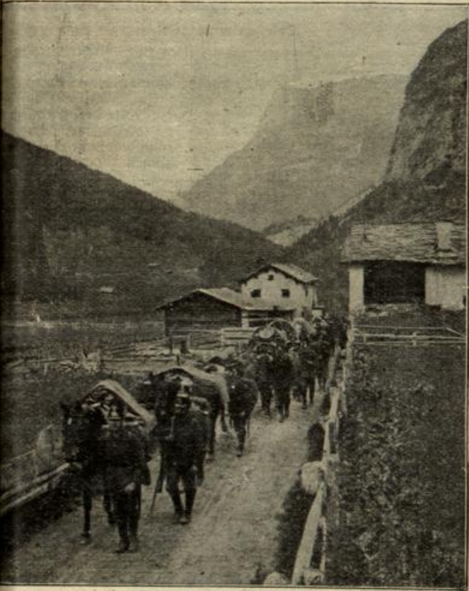
weizer Gebirgsinfanterie. Bagagelolonne auf dem Marsch im Gebirge.

Natsweiler an. Er wollte sich erst ein wenig einleben und mich holen. Regelmäßig kamen anfangs seine Briefe, all-