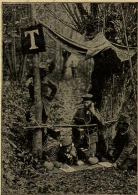
Vorgehobene Telefonstation an den Ufern der Nisne.

wohlüberlegtes Haushalten. Zweckmäßig scheint es, diese Aufzeichnungen hin und wieder zu kontrollieren, doch gebe man dabei nur freundschaftliche Weisungen und Ratschläge und hüte sich vor willkürlichem Eingreifen, denn das würde das Gefühl der freien Verfügung und der damit verbundenen alleinigen Verantwortung einschränken und vielleicht sogar zu Heimglichkeiten Veranlassung geben.