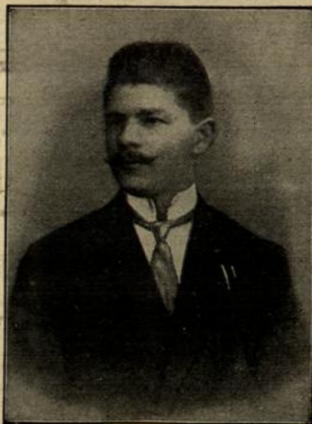
Das „Eiserne Kreuz“ für einen „Shipper“.