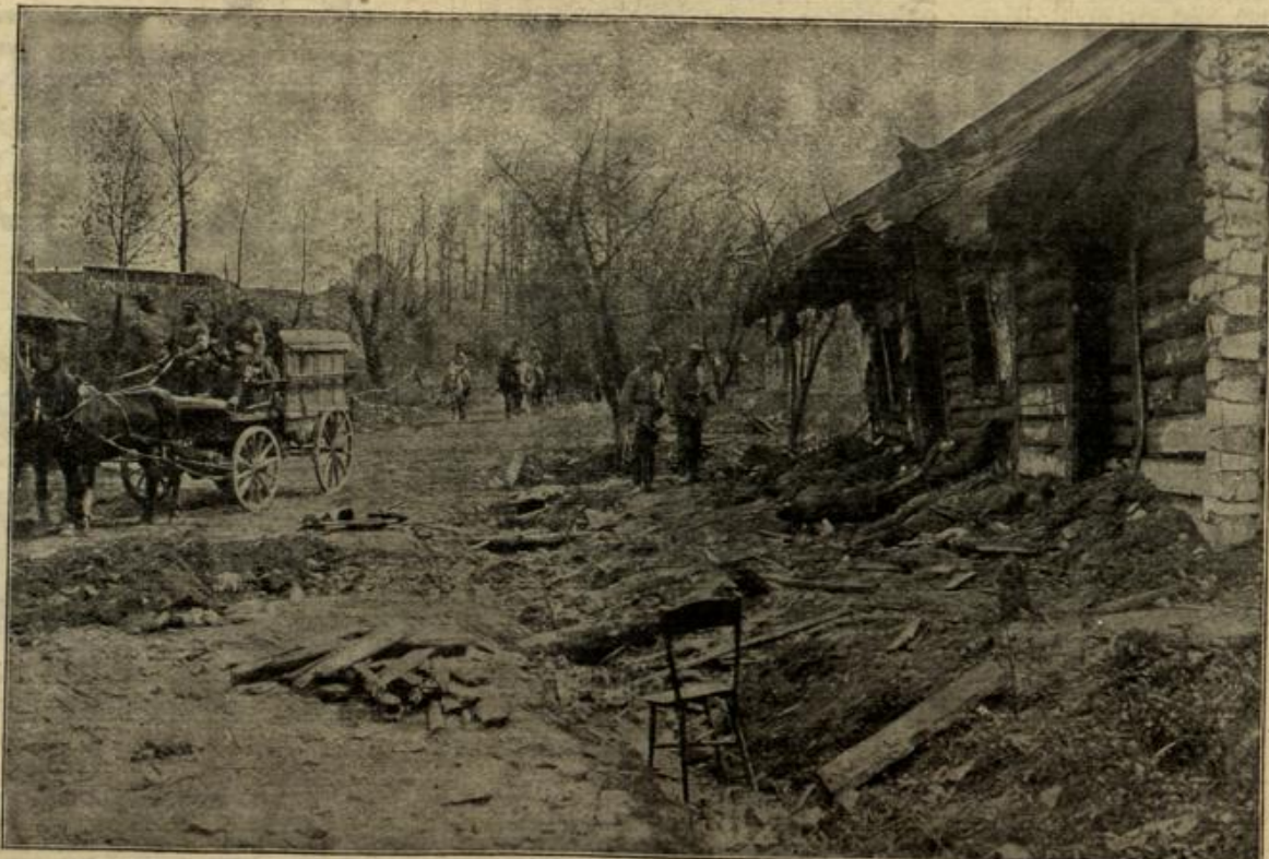
Nach dem Kampf: Eine Sanitätsabteilung sucht ein Gefechtsfeld in Ostgalizien nach Verwundeten ab.

Die Erziehung zur Sparsamkeit kann freilich erst in späterem Alter beginnen. Auch hier ist der einzige Weg der, dem Kinde selbst Geld in die Hand zu geben und ihm eine gewisse Freiheit in der Verfügung darüber einzuräumen. Feinlich fordere man aber das genaue Aufschreiben aller Einnahmen und Ausgaben, denn dieses ist die erste Grundlage einer vernünftigen Geld-