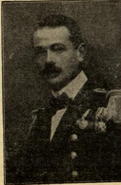
Linienschiffslieutenant Ritter v. Trapp, Kommandant des österr.-ung. Unterseebootes U 5 (Mit Text.)

Auch ein Standpunkt. „Du bist ein Froh?“ — „Wieso denn?“ — „Wer trägt denn jetzt im Winter noch einen Pelz; den hat doch jeder normale Mensch längst im — Leihhause!“