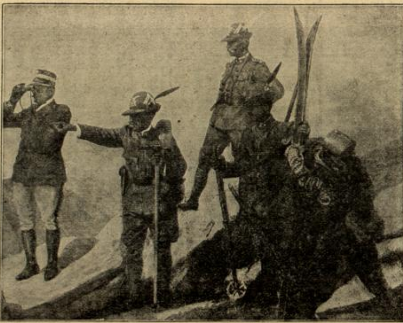
Italienische Truppen: Offiziere und Mannschaften der Alpenjäger in graugrüner Felduniform.

über ihre allzu schnelle Vertraulichkeit, denn sie hatte sich doch ganz fest vorgenommen, ihm nicht zu schnelle und zu große Hoffnungen zu machen. Von nun an würde sie also entschieden vorsichtiger sein müssen! Der würzige, starke Tee verfehlte seine Wirkung nicht, — bald waren alle in bester Stimmung und die Unterhaltung floss nur so dahin. Natürlich besprach man auch das Ereignis des Tages noch einmal, und Felix hatte wieder Gelegenheit, seinen Mut und seine helle Freude über den erwarteten Ausbruch eines Krieges zu zeigen. Da fiel der Blick des alten Herrn auf den Bechsteinflügel. Und nun bat er, daß Melanie ein wenig spielen möge. Sie ließ sich auch gar nicht lange nötigen. Denn erstens spielte sie gern, dann aber wußte sie, daß sie sich auch hören lassen konnte. Sie spielte ihren Liebling zuerst. — Grieg's „Einsamen Wanderer“. — Und sie spielte ihn mit ganzer Hingabe. Stürmischer, ehrlicher Beifall belohnte sie. Dann spielte sie „Erotil“ von Grieg. Und noch mehr begeistert war man. Als sie dann sich umdrehte auf dem Klaviersessel, fragte sie: „Was nun?“