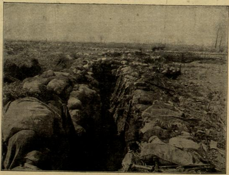
Deutsche Schützengrabentinie, rechts Annäherungsgraben.

Das Mädchen kam, lächelte fein schelmisch, zuckte aber die Schultern: „Bedaure, gnädige Frau ist schon ausgegangen.“ Er stand da und riß den Mund auf, — zuerst begriff er gar nicht. Dann sagte er drollig: „Ach nee!?“ Ruhig heiter nickte sie: „Doch, doch, schon vor einer Stunde.“ Da riß er sich zusammen. „Also jut. Zeben Sie der Gnädigen diese Blumen und bestellen Sie einen schönen Truß!“ Es machte ihm Freude, hier so zu verlinern. Die Kleine nickte und nahm die Blumen. Da besann er sich plötzlich. „Halt mal! halt!“ Und schnell zog er eine Visitenkarte heraus, schrieb darauf: „Schönen guten Morgen.“ „So, zeben Sie dies der Gnädigen.“ „Sehr gern“, lächelte sie ihm zu. Nachdenklich ging er wieder. Weshalb dies kleine Luderchen