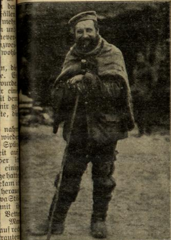
...ad aus dem Schützengraben komm' ich heraus!" ...in Landwehrmann mit selbstgefertigtem Winterumhang und Kniewärmern.