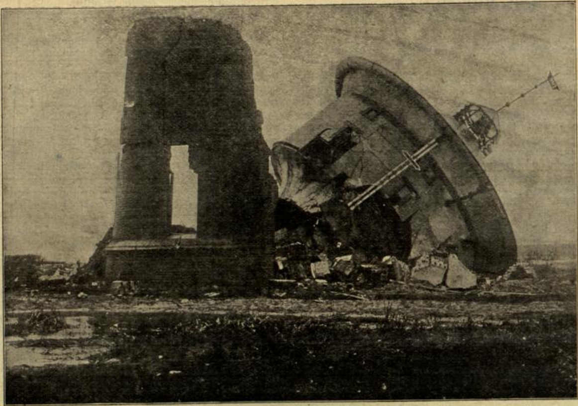
Der von den Russen gesprengte Bahnhofs-Wasserturm in Memel.

Der Justizrat entwickelte hier genau dieselben Bedenken, die auch schon Sochinski mir gegenüber geltend gemacht hatte. Ich hieß daher für mich abwarten, so schwer mir dies auch wurde. Immerhin hoffte ich, bald ans Ziel zu gelangen, da mir eine unbestimmte Ahnung sagte, daß Stölner jedenfalls auch mit dem neuen Erben daselbe Spiel versuchen würde, das er mit mir getrieben hatte, wobei er sich leicht eine Blöße geben konnte, die sich vielleicht für meine Zwecke ausnutzen ließ.