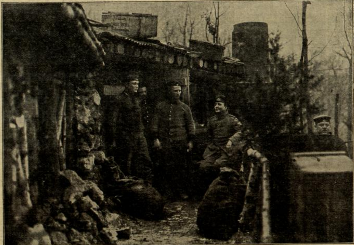
Ein heizbares wohlverproviantiertes Blochhaus auf dem westlichen Kriegsschauplatz. (Mit Text.)

Dieser nickte eifrig. "Also das ist die Lösung! Wer hätte daran gedacht!" meinte er ganz sprachlos. "Sochinski war nun unschlüssig, ob er dem Pärchen noch weiter folgen sollte," fuhr Boto Hillgreen fort, "schließlich ent- schied er sich aber doch dafür, nach Berlin zurückzukehren und nur Justizrat Magnus das Beobachtete telephonisch mitzuteilen."