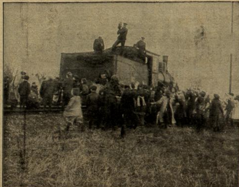
Die Not in Frankreich: Verschicken von Kohlen an Frauen und Kinder, die jeden durchfahrenden Zug umlagern und um Feuerungsmaterial bitten.