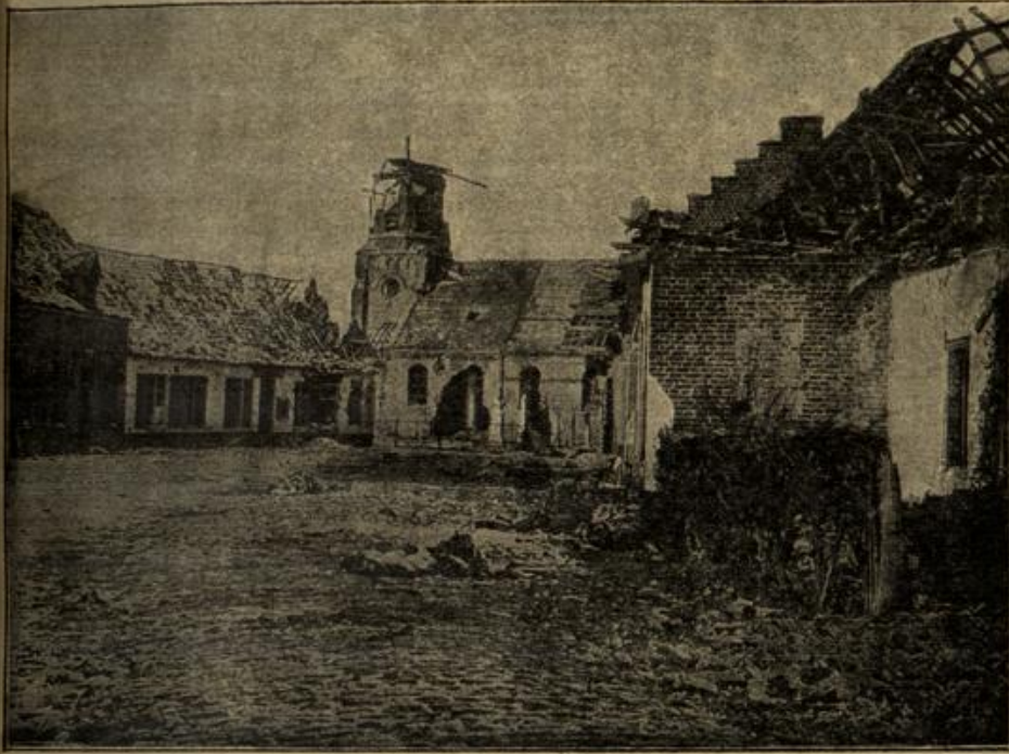
Vom Kriegsschauplatz in Westflandern: Dorfstraße in Ghelvelt nach dem Kampf.

„Aber das habt ihr doch auch alles hier, Cillichen.“ „Ja, Vater, aber da ist alles so viel hübscher, so hell alles und so bunt.“ — Rein, bunt und hell war das Leben in dem alten und ziemlich düsteren Herrenhause nicht — fröhlich war weder Hansjen, noch Fräulein Kroner, noch er selbst mit den Kindern.