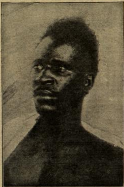
Ein Vorkämpfer für französische Kultur. (Mit Text.)

Sein einziger Trost war, daß vorläufig das Gut noch