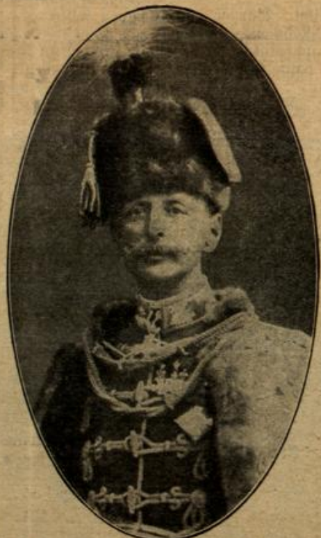
General d. Inf. Stephan v. Zarlotic, zum Landeshof und kommandierenden General von Bosnien und der Herzegowina ernannt.

Heut aber würde sie ohne schmerzvolle Gedanken auch dieses Lied wieder hören können, jetzt wo sie sich durch treue Ar-