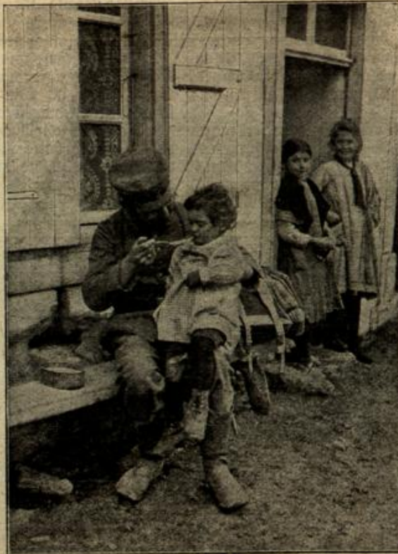
Ein deutscher Landwehrmann teilt sein Essen mit einem hungrigen Franzosenkind. (Mit Text.)

Thea wollte nicht lauschen — nichts lag ihr ferner, aber sie mußte sich versteckt halten, um nicht mit dem Paar zusammenzutreffen.