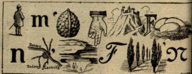
Auslösung folgt in nächster Nummer.