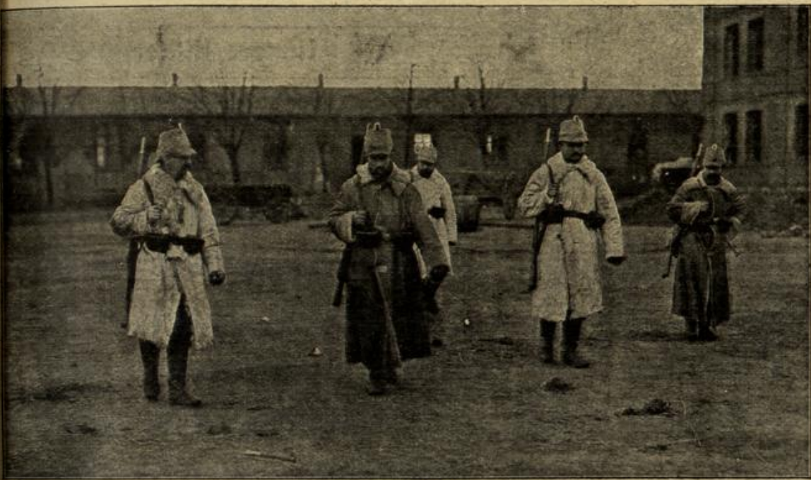
Vom Kriegsschauplatz in Russisch-Polen:

Er hatte bisher noch nie darüber nachgedacht, was wohl der Grund und die Ursache solcher knappen, kühlen Sachlichkeit von seiten eines weiblichen Wesens, noch dazu eines jungen weiblichen Wesens, seien. Es war doch eigentlich ein Zeichen besonderer Reife. Wie alt Thea war, hatten ihm ihre Zeugnisse gesagt — nun, so mußten wohl ihre Schicksale, ihre Erlebnisse sie über ihre Jahre gereift haben. Oder am Ende eine unglückliche Liebe? Eigentlich war ja die landläufige „unglückliche Liebe“ für ihn als modernen Dichter ein ganz überwundener Standpunkt, aber Fräulein von Briselow stammte vom Lande und „das Land“ war