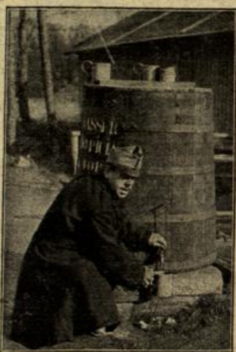
Gesundheitsschutz in der österreichischen Armee. (Mit Text.)

Thea war so lebhaft geworden, wie er sie noch nicht gesehen ein Windstoß hatte ihr auch den Hut entführt, und so stand vor ihm, das schöne, sprechende Gesicht mit den klugen, leuchtenden, dunkelblauen Augen vom blonden Haar umweht. „Aber nur einen Augenblick — sie stülpte den Hut sofort auf ihren Kopf —“